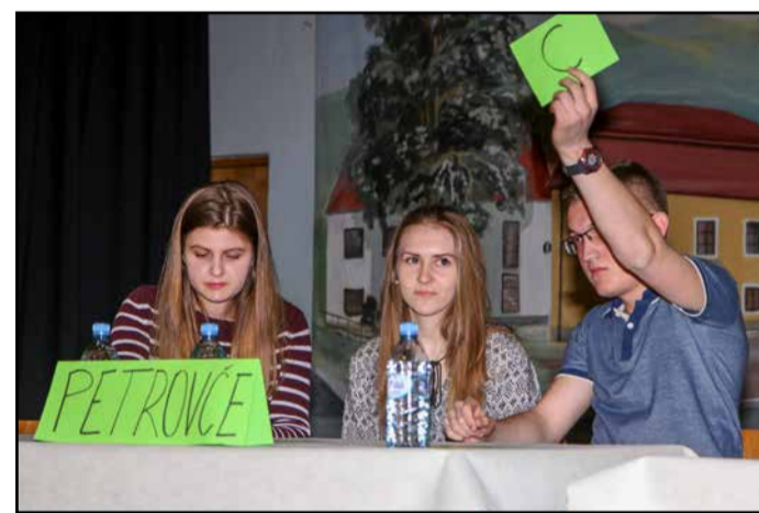
Ekipe DPM Petrovče, ki se bo udeležila regijskega kviza.