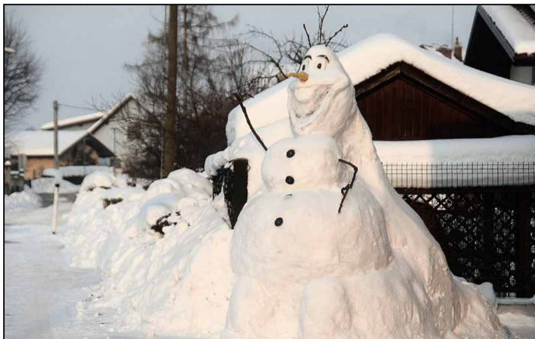
Ledeno kraljestvo tudi v Spodnji savinjski dolini

Letošnja bogata snežna odeja je omogočila otrokom in tudi odraslim, da so iz snega ustvarili prave umetnije.