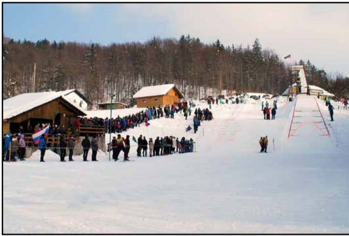
Pogled na skakalnico in prizorišče nedeljske tekme

Pred sedmimi leti, na pustno nedeljo, 18. februarja 2012, je bil Timi na tej skakalnici predtekmovalec. Če bi skakal v konkurenci, bi bil absolutno najboljši, saj se je kot enajstle-