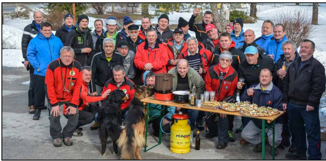
Nekaj udeležencev na začetku pohoda