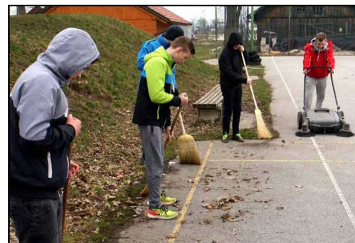
Mladi iz Športnega društva Trnava so urejali zunanja športna igrišča.

S količino zbranih odpadkov so dokazali, da črna odlagališča skoraj izginjajo, da je ob bregovih potokov Trebnik, Radigaj in Trnavca ter reke Bolska manj odpadkov kot lani, da so ožja območja Braslovškega in Žovneškega jezera ter bregovi Preserskih jezer čistejši kot lani. Večje količine odvržene embalaže v braslovški občini pa je še vedno najti ob bregovih reke Savinje.