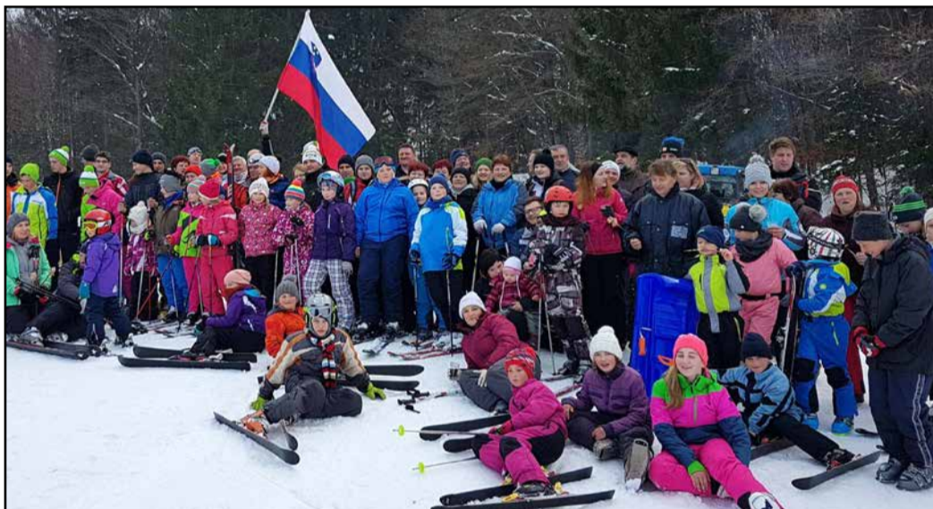
Udeleženci smučarskega tekmovanja v Andražu nad Polzelo

Prizadevni krajanji zaselka Podsevnik v Andražu nad Polzelo postavijo vsako leto med zimskimi počitnicami na »Petelinskem hribu« smučarsko vlečnico, če seveda to dopuščajo snežne razmere. Letos so jim.