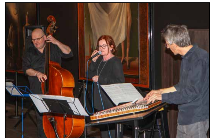
V okviru citrarskega abonmaja je v Žalcu nastopil Trio Unikum iz Avstrije.