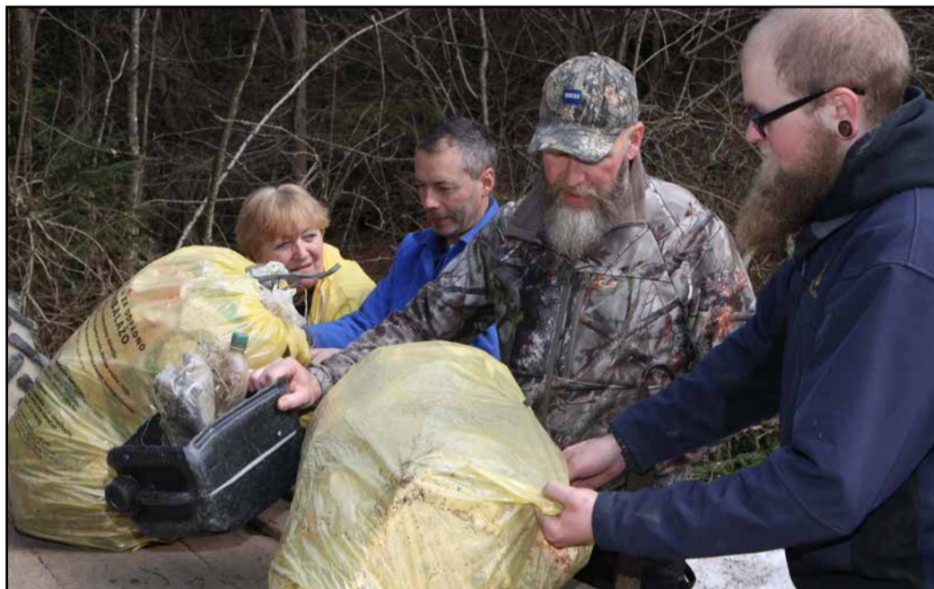
Turistični delavci Gomilskega in člani PGD Grajska vas v akciji

Turistični društvi Braslovče in Gomilsko sta v soboto, 24. marca, organizirali čistilno akcijo.