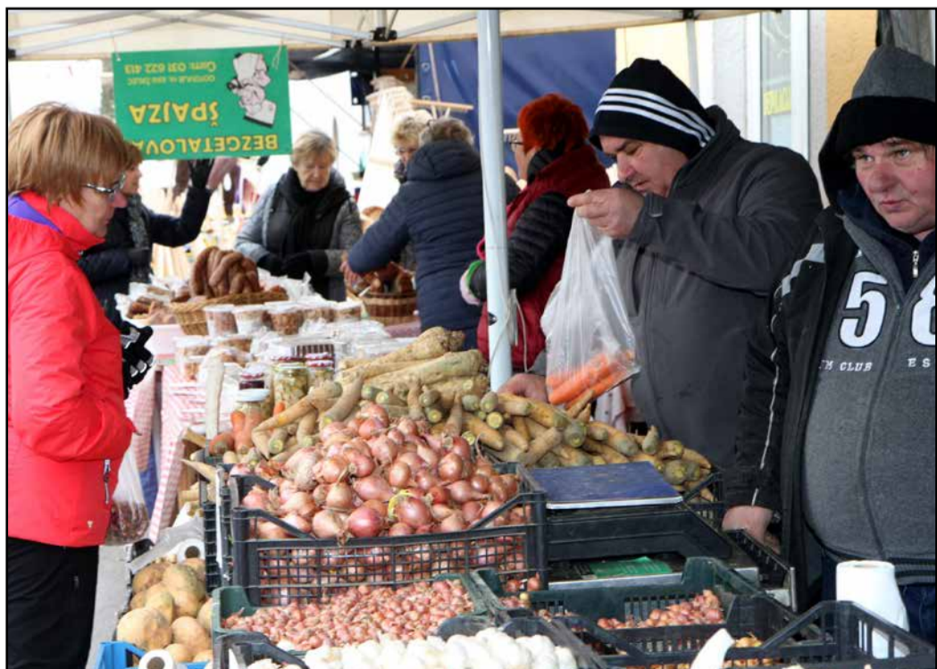
Pestra ponudba domačih vrtnin