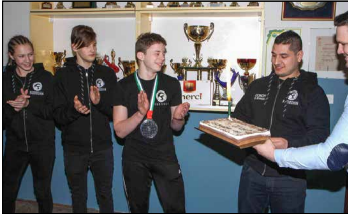
V klubu so uspešne tekmovalce počastili s torto.