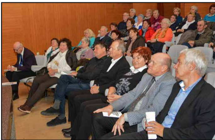
Del udeležencev zbora s predstavniki občin in predstavnico ZDIS

Za vse te programe so namenili slabo polovico od skupno zbranih 67.140 evrov, kolikor so jih pridobili od ZDIS in FIHO, članarine, občin, podjetij in zbrali z dobrodelnimi akcijami. Tudi v preteklem obdobju so bili zelo uspešni, kar so v svojih nagovorih po-