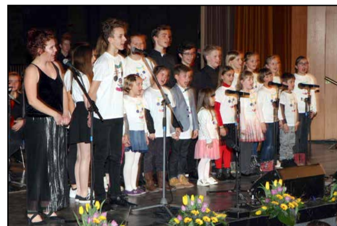
Med nastopom pevskega zbora žalske glasbene šole