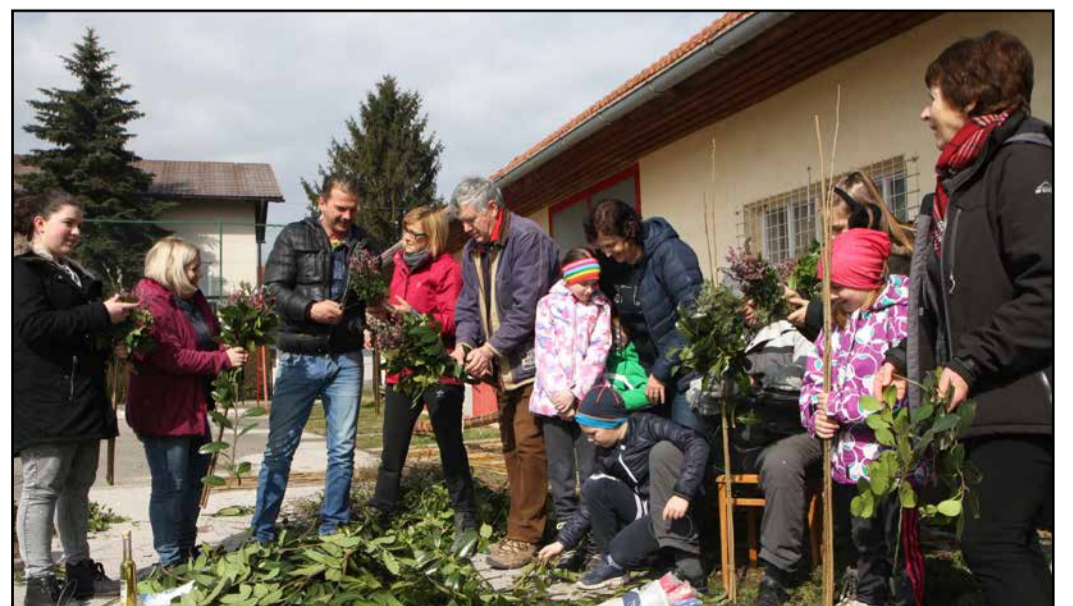
Nekaj udeležencev delavnice izdelovanja butar