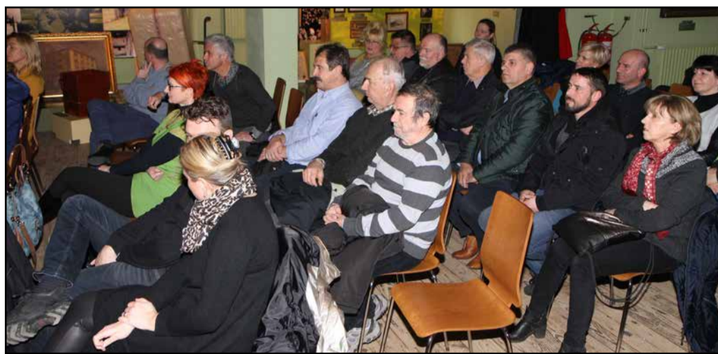
Udeleženci delavnice o razpršenem hotelu.