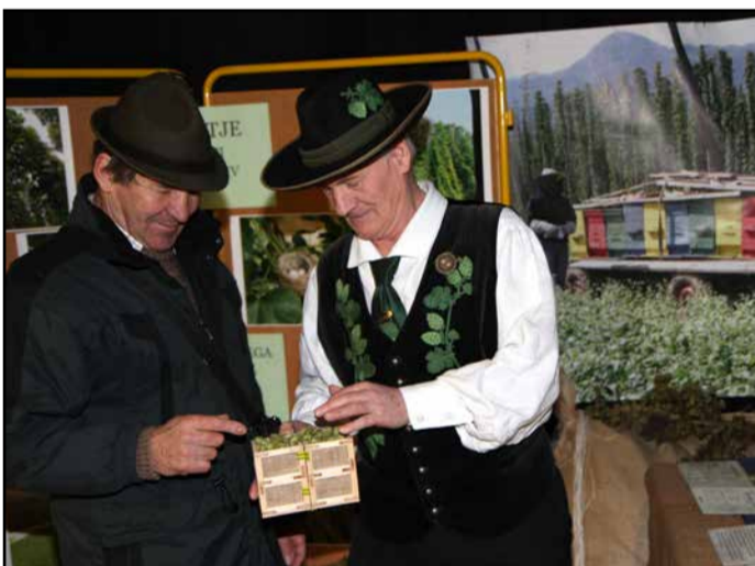
Na razstavi v Hmeljarskem domu so hmeljarji predstavili tudi 13 vzorcev slovenskih aromatičnih sort hmelja.

času se postavlja vprašanje, kakšno bo novo finančno obdobje, koliko poudarka bosta Slovenija in Evropa dali kmetu in kmetijstvu po letu 2020. Vsi bi želeli, da gre denar kam drugam, ampak če ne bo po deželje poseljeno, kot je zdaj, bo slabo tudi za turizem. Zato moramo najti primerno podporo za slovenskega kmeta.«