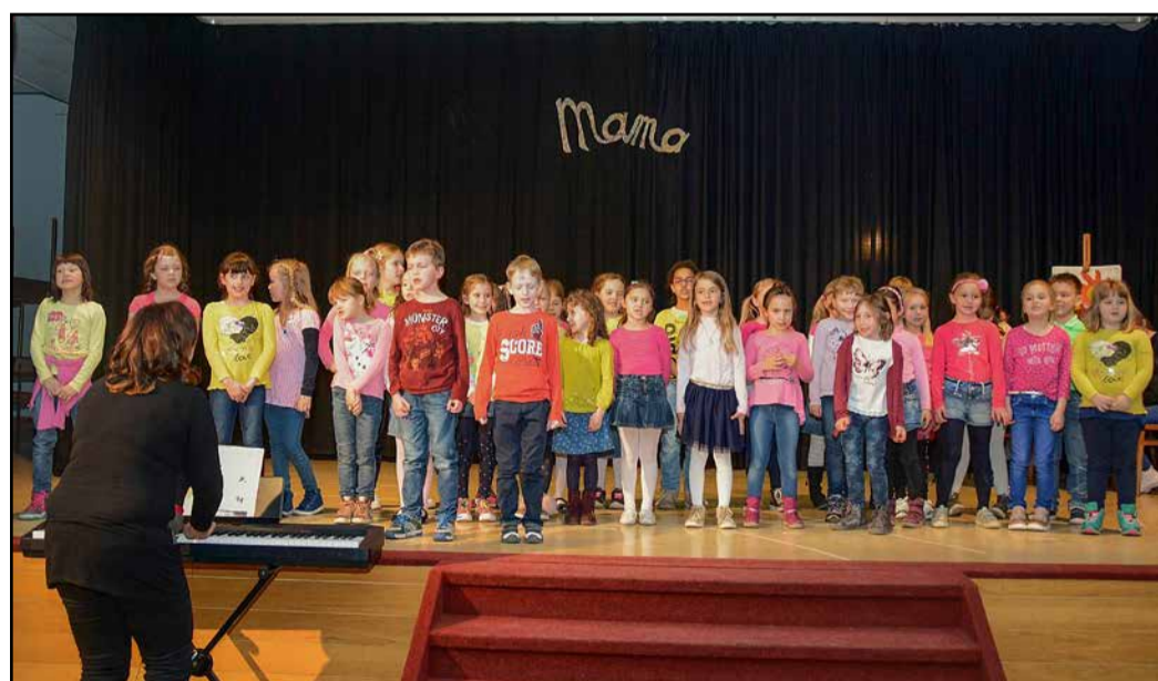
Med nastopom v čast ženam in materam

Kulturno društvo Petrovče je v sodelovanju s KS Petrovče v torek, 13. marca, v dvorani Hmeljarskega doma Petrovče pripravilo tradicionalno prireditev v poklon ženam in materam.