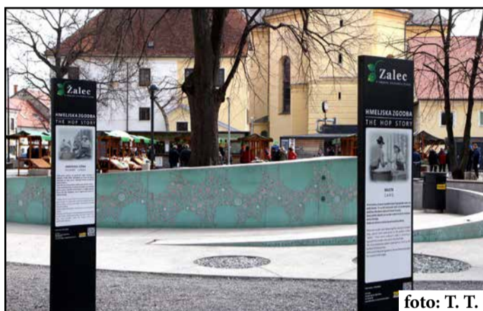
Žalska Fontana piv Zeleno zlato že čaka pripravljena na svojo tretjo sezono.

Na dan odprtja fontane 31. marca bodo lahko obiskovalci kupili vrčke s čipom za pivo po ugodnejši ceni 6 evrov (nakup z omejenim številom), sicer pa bo redna cena 8 evrov. Tudi letos bo na šestih pipah fontane