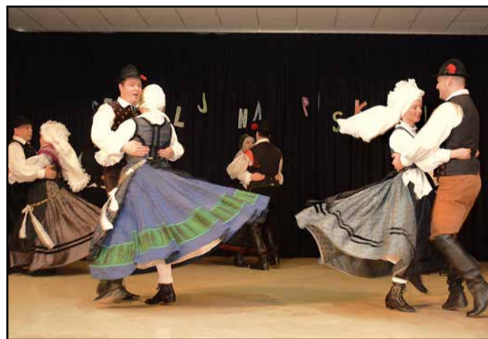
Med nastopom FS Ponikva

Prejšnjo soboto je v dvorani hmeljarskega doma v Petrovčah potekalo območno srečanje odraslih folklornih skupin, ki delujejo na območju Spodnje Savinjske doline. Srečanje je pod okriljem žalske izpostave Javnega sklada RS za kulturne dejavnosti organiziralo Kulturno društvo Petrovče.