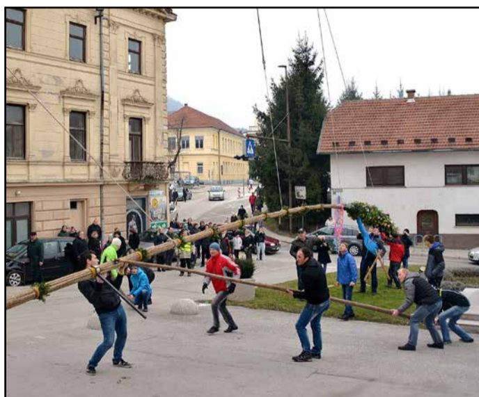
D. N. Dvig butare je precej zahtevno opravilo.

V Kaplji vasi so izdelali butaro velikanko, ki je merila 23 m, in jo postavili ob glavnem vhodu v preboldsko župnijsko cerkev. Približno 12 metrov dolgo in lepo okrašeno butaro so iz 5 km oddaljene vasi do župnijske cerkve sv. Pavla v Preboldu prinesli iz Matk. Ti so po končanem blagoslovu butaro odnesli nazaj v svojo vas, kjer so se pri vaški kapeli zadržali ob prijetnem druženju.