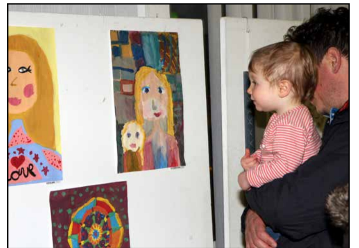
Z razstave »Žena – mati« na dan odprtja

Razstava je bila v mali dvorani kulturnega doma na Pol-