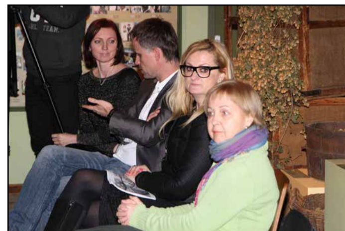
Lokalni snovalci turizma