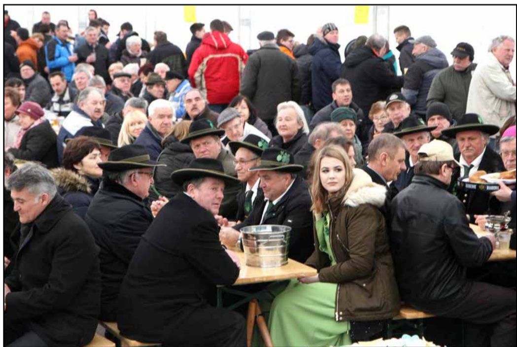
Ob odprtju 30. Jožefovega sejma je bil prireditveni šotor povsem poln obiskovalcev in številnih gostov.