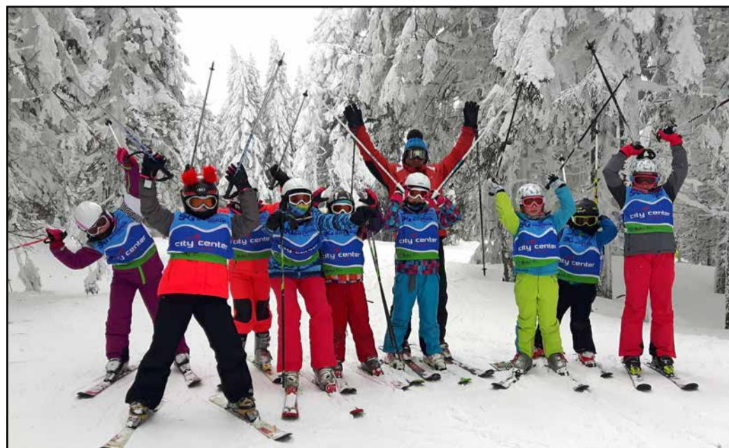
SK Gozdnik Žalec je letos organiziral šolo smučanja na Rogli.

SK Gozdnik je letos od jezera Vrbje do Roj in na žalskem