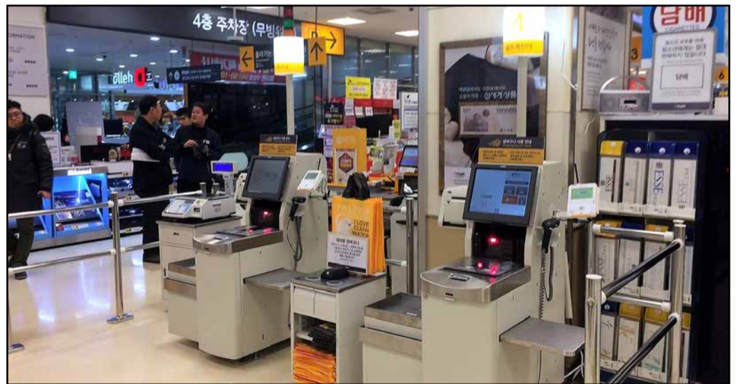
Prve blagajne v Južni Koreji

Družba Mikropis je v letu 2018 začela z nameščanjem samopostrežnih blagajn v hipermarketih največje trgovske družbe E-Mart v Seulu v Južni Koreji. V prvih mesecih letošnjega leta so samopostrežne blagajne namestili v treh hipermarketih, južnokorejski kupci pa jih že množično uporabljajo.