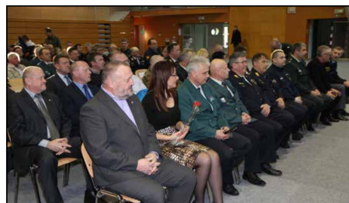
Del udeležencev osrednje regijske prireditve na Vranskem

V intervencijah je posredovalo 448 gasilcev 49 gasilskih enot in regijska enota Civilne zaščite s črpalko visoke kapacitete. Močan veter in poplave so prizadele to regijo tudi sredi decembra. Najhujše razmere so bile na območju Zgornje Savinjske doline v občinah Nazarje, Gornji Grad, Ljubno, Luče in Solčava. Združili so se trije ključni dejavniki, in sicer taljenje snega, močne padavine ter viharji veter z vetrolomom. Skupaj je v reševanju teh razmer posredovalo več kot 1.000 prostovoljnih in poklicnih gasilcev, pripadnikov Civilne zaščite in reševalcev ter 321 delavcev javnih in drugih podjetij. Neurja in močan veter so se pojavljali tudi v poletnih mesecih. Žal tudi s požari ni bilo prizaneseno. Marca lani je zagorelo v Hrastovcu pri Velenju. Gozdni požar je gasilo 219 gasilcev iz 11 gasilskih enot, pri gašenju pa je s helikopterjem pomembno vlogo odigrala tudi Slovenska vojska. Med intervencijo gozdnega požara se je težje poškodoval gasilec. Žal so tudi taki neljubi dogodki realnost, s katero se moramo soočiti. Pozeba aprila in suša v juniju sta prizadeli celotno regijo, trajne nasade v sadjarstvu in vinogradništvu, številne kmetijske površine. Škoda je presegala 0,3 promila načrtovanih prihodkov državnega proračuna,