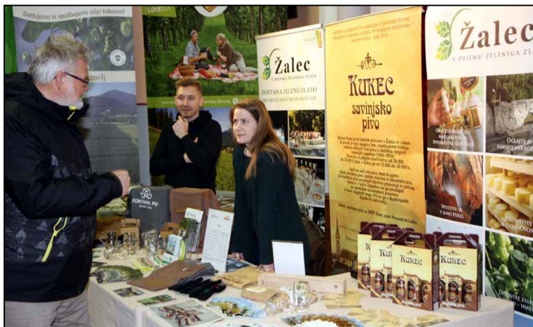
Osrednja tema letošnjega Jožefovega sejma je bila Hmelj, pivovarstvo – naša tradicija. Predstavljala se je tudi Občina Žalec z ZKŠT Žalec, ki je to tradicijo vtakla v svojo turistično promocijo.