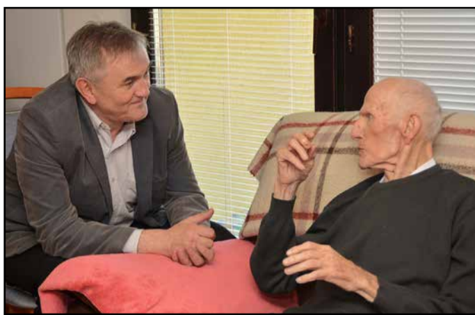
V pogovoru z županom