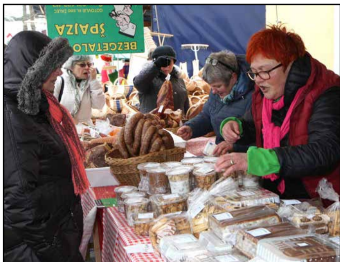
Ponujali so velikonočne dobrote