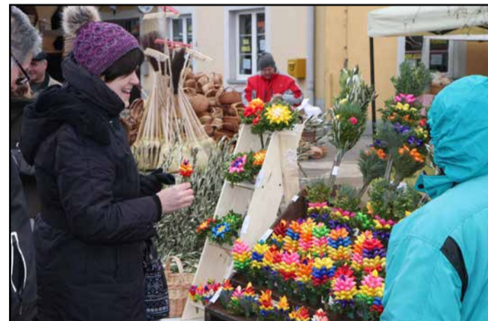
Stojnice na Jožefovem sejmu so letos ponujale tudi butare in velikonočne dobrote.