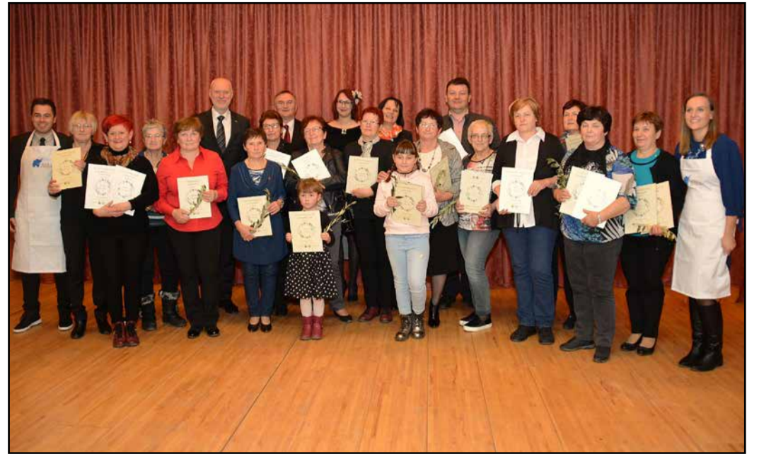
Prejemniki priznanj z županom, predsednikom DZ, voditeljema in predsednico TD Prebold