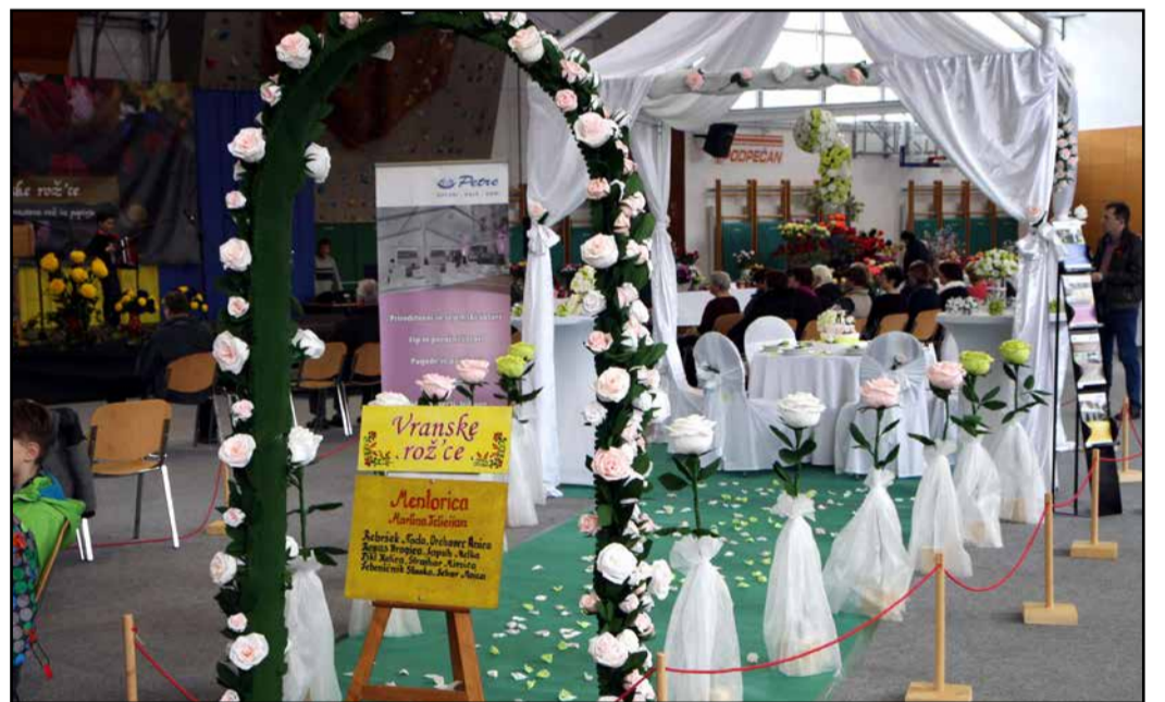
Rože iz papirja tudi za poročno dekoracijo

Sekcija Vranske rožice, ki deluje v okviru Društva univerza za tretje življenjsko obdobje Vransko, je pod pokroviteljstvom Občine Vransko v soboto, 10., in v nedeljo, 11. marca, v Športni dvorani Vransko pripravila 5. veliko vseslovensko razstavo rož iz krep papirja.