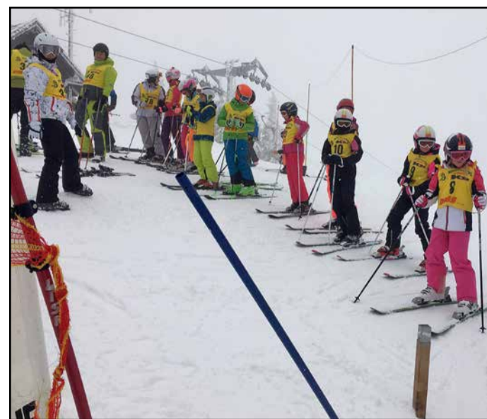
Na progo so se najprej podali najmlajši tekmovalci.

SK Prebold je med zimskimi počitnicami na Kopah organiziral tudi tečaj smučanja za šoloobvezne otroke, ki se ga je udeležilo 41 otrok, polovica iz preboldske občine, polovica pa iz ostalih spodnje-savinjskih občin, zanje pa so