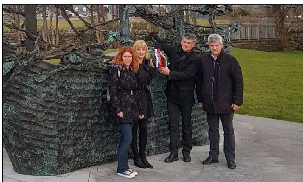
Žalska delegacija je k spomeniku žrtvam množičnega izseljevanja z Irske v ZDA položila venec.

Dan sv. Patrika je priljubljen in največji irski praznik, ki ga praznujejo Irski po vsem svetu v čast glavnemu zaščitniku Irske, sv. Patriku. Na ta dan v mestih potekajo barvite parade in slavijo pivo. Mesto Westport je