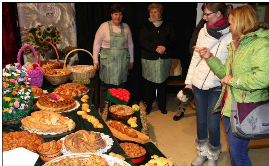
Dobrote kmečkih žena na razstavi v dvorani Hmeljarskega doma