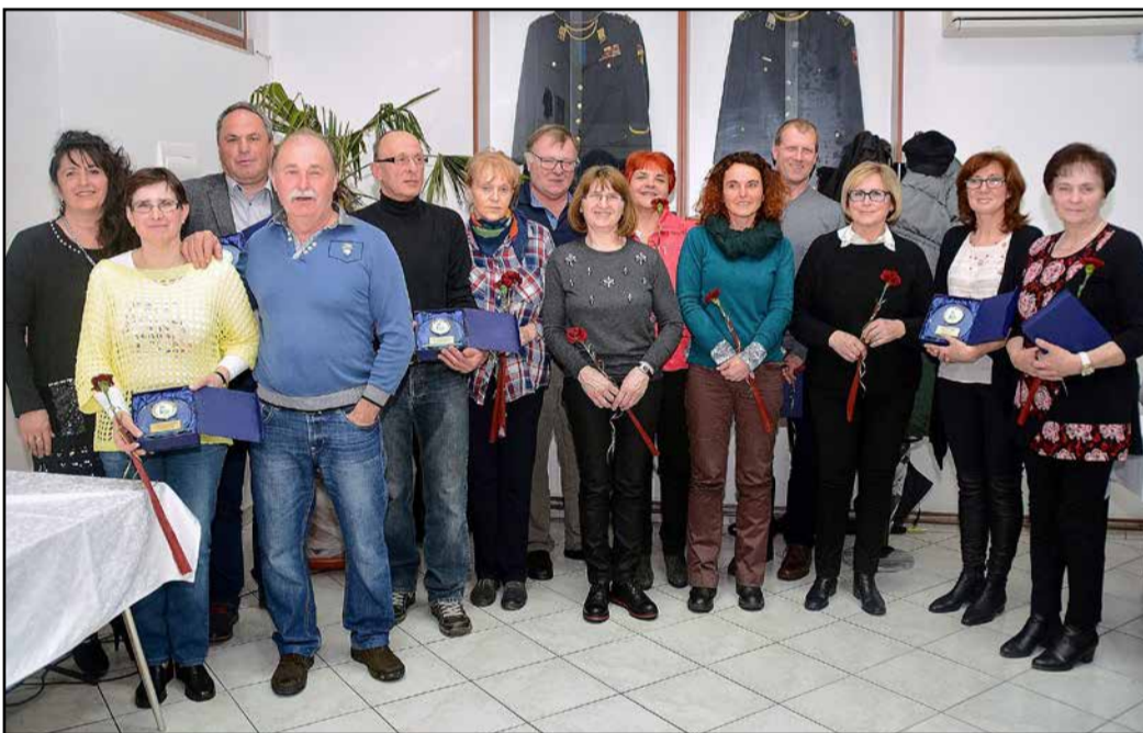
Dobitniki priznanj KS Šempeter za urejenost