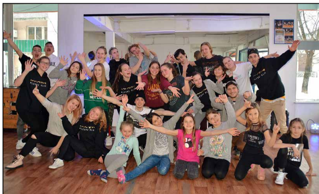
Udeleženci enotedenskega druženja na zaključni delavnici

Med zimskimi počitnicami ni bilo veselo samo na snegu, ki ga letos res ni manjkalo, ampak tudi v dvorani Plesnega kluba Moove v Žalcu na Cankarjevi ulici 5, kjer so ves teden potekale brezplačne plesne delavnice, ki so jih zadnji dan zaokrožili s skupnim druženjem vseh udeležencev delavnic.