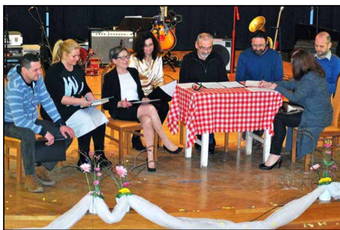
Dramska sekcija KUD Svoboda Griže je s humorjem popestrila prireditev ob dnevu žena.