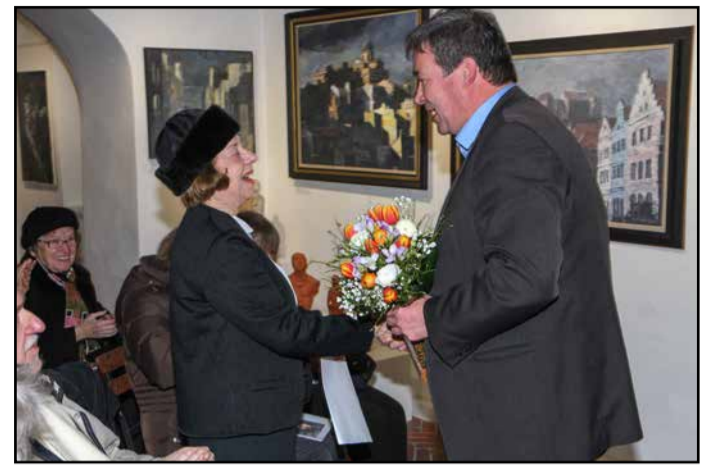
Na dan odprtja razstave