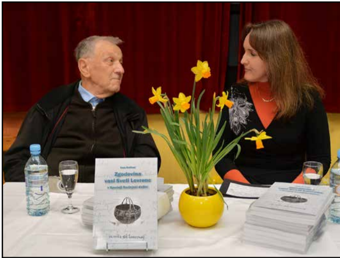
Knjižničarka in avtor med predstavitvijo knjige

Delo zajema zemljepisni in geološki opis vasi, oblike njene krajevnega imena, dogajanja na tem območju skozi čas, predstavljene so krajevne gospodarske panoge in dejavnosti. Postreže s številnimi statističnimi podatki, ponuja vpogled v družinska drevesa posameznih domačij, prav tako pa zajame zgodovino vasi več stoletij nazaj, ko je stal na hribu nad vasjo grad Žaženberk (Sachsenwart), ki se prvič omenja v dokumentu iz leta 1311. V njej boste našli