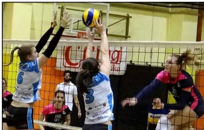
Četrtna tekma proti GEN-I Volley iz Nove Gorice

V tretji, odločilni tekmi četrtfinala končnice 1. DOL za ženske so odbojkarice Alianse Šempeter po zaostanku z 0 : 2 premagale GEN-I Volley iz Nove Gorice (3 : 2) in se uvrstile v polfinale državnega prvenstva, v prvi polfinalni tekmi pa v Mariboru izgubile s 3 : 0. Povratna tekma bo danes, v sredo, v telovadnici OŠ Šempeter.