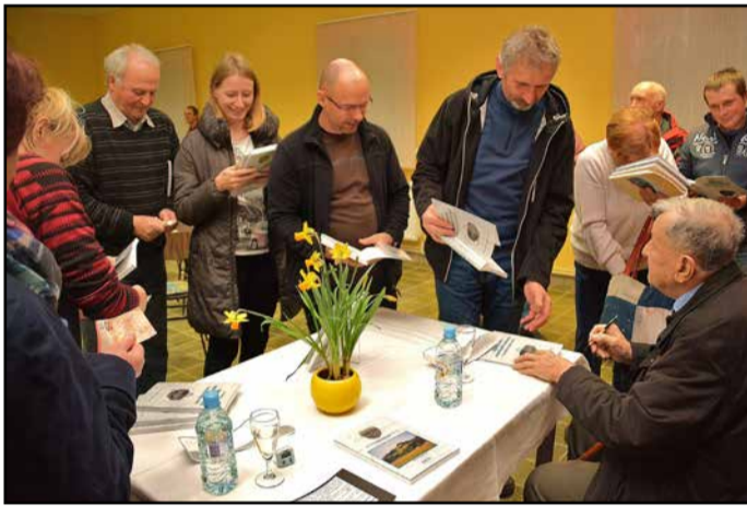
Avtor med podpisovanjem knjig

tudi poglavje o obeh svetovnih vojnah, ki sta zahtevali precej žrtev tudi v tej vasi in njim je knjiga tudi posvečena.