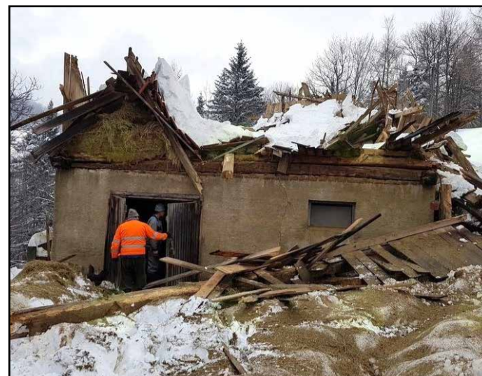
Del porušenega hleva kmetije Bistan

Občina Vransko bo lastniku kmetije pomagala z denarnim prispevkom v višini 1.500 evrov. T. T.