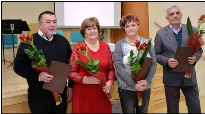
Letošnji dobitniki priznanj s predsednico žalske univerze za III. življenjsko obdobje (v sredini)

Ob pestrih vsebinah izobraževanja razvijajo člani svojo ustvarjalnost in pridobivajo znanja za kakovostno staranje, kar je še kako pomembno za aktivno življenje v družbi z vsemi generacijami. Tovrstna znanja jim koristijo pri enakopravnem vključevanju v širšo družbeno skupnost, predvsem pa pri prenosu na mlajše generacije. Društvo bo še naprej delovalo po začrtanih smernicah. Poleg izobraževanja, ki bo potekalo v 10 jezikovnih krožkih, 6 računalniških, 12 naravoslovnih in družboslovnih ter 7 krožkih za ohranjanje vitalnosti, bodo organizirali delavnico prikaza delovanja defibrilatorja, delavnice o demenci, obvladovanju