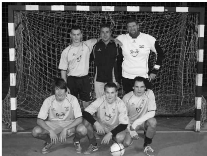
Prvaki ekipa ŠMD Turjak

Z odigranim 18. krogom se je 13. oktobra končala letošnja občinska liga v malem nogometu občine Velike Lašče v organizaciji ŠD NK Velike Lašče.