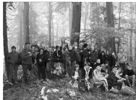
Skupinska fotografija na vrhu

V četrtek, 14. 10. 2010, so imeli na OŠ Primoža Trubarja učenci od 6. do 9. razreda športni dan. Vsebina je bila jesenski pohod. Zadnja leta smo