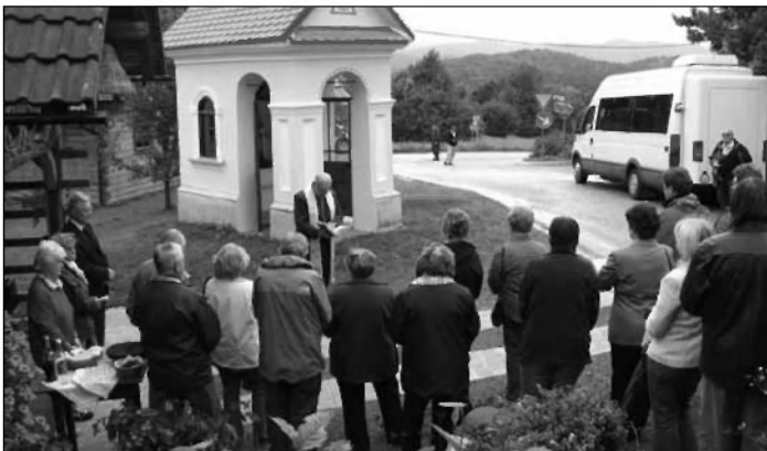
Blagoslov obnovljene kapelice

Zaradi močno razmočenih tal so bili s tradicionalnega programa sicer prisiljeni umakniti izvedbo pohoda po "Trubarjevi rojstni fari", so pa letošnjo prireditev obogatili z izvedbo blagoslovitve obnovljene kapelice Matere božje na Gradežu in odprtjem na novo urejenega vaškega središča.