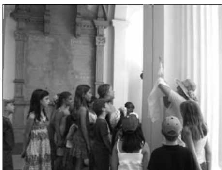
S pravljico smo prišli prav do Levstikovega spomenika na Navjah.

Zavod za razvijanje ustvarjalnosti sodeluje v projektu ljubljanskega Združenja za starše in otroke Sezam z naslovom Še so z nami. Ta projekt, pri katerem poleg Sezama in ZRU sodeluje tudi Društvo Rastoča knjiga, sestavlja mozaik bogate ponudbe mesta Ljubljane, letošnje svetovne prestolnice knjige. V severnem mestnem parku Navje je ZRU poleg štirih tematskih pesniških večerov (klasične oblike, kratke oblike, angažirana poezija in prevodi) z avtorji in urednicami portala Pesem.si za otroke pripravil tudi ustvarjalne delavnice na temo knjige, branja in literature.