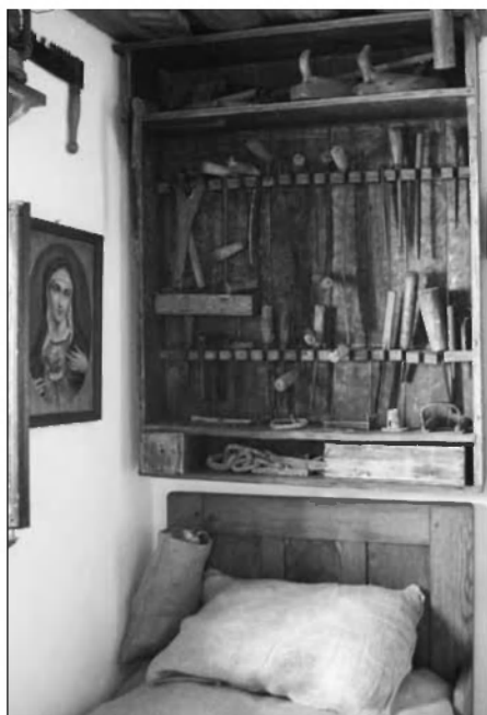
Pečnica