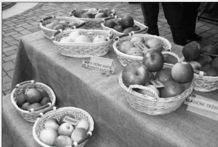
Razstava starih sort jabolk