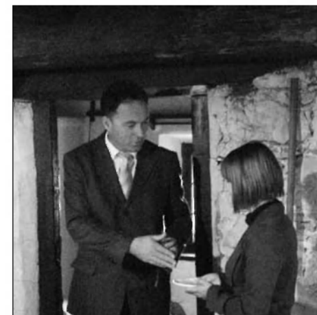
Ob odprtju pečnice

- ustanovitelju Občini Veliki Lašče, ki skrbi za investicijsko vzdrževanje domačije;