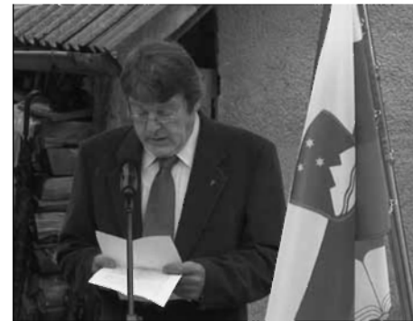
Zgodovina dogodkov v času NOB