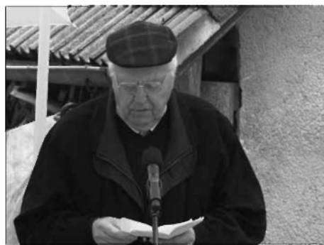
Pozdrav borcev Levstikove brigade

Kot da bi se vedelo vnaprej, je po dveh dneh prenehalo deževati. Sprva je hladno zapihalo, nato pa se je med koprenastimi oblaki pokazalo celo sonce,