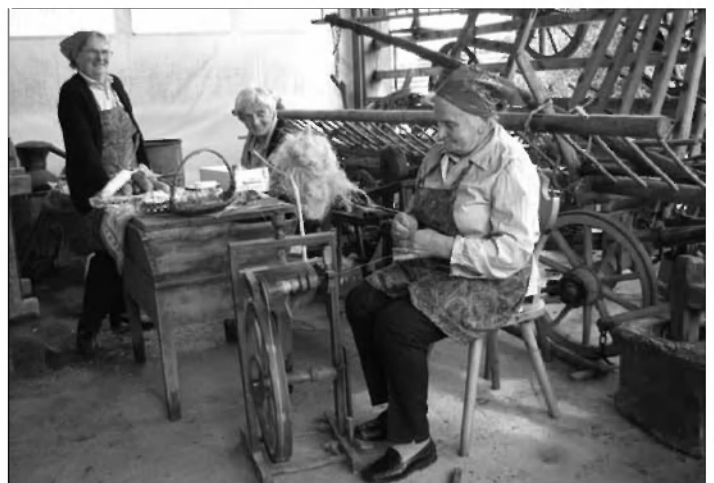
Pri zbirki starega orodja pod kozolcem

Prireditve sta z napevi starih pesmi popestrila gostujoči možki pevski Kvartet Zvonček in domače "Suhe češplje". Pod kozolcem, kjer je na ogled postavljena stalna razstava starega kmečkega orodja, so domače žene obiskovalcem prikazovale, kako so same nekoč izdelovale klince, predpražnike iz ličkanja, naglavne svitke in drugo, še vedno spretno predice pa so na starem kolovratu demonstrirale prejo lanene preje. Glede na bogato letino sliv in jabolk je tudi v času prireditve s polno zmogljivostjo delovala vaška sušilnica sadja.