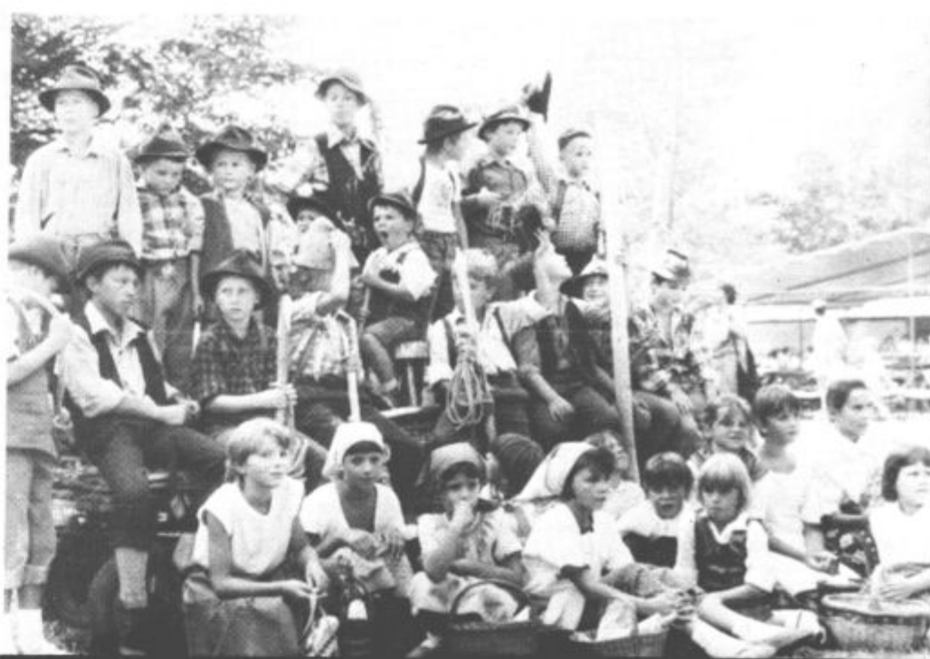
Za flosarski naraščaj in nadaljevanja izročila se Ljubencem vsekakor ni treba bati

no pa je seveda naprodaj, če kupci že niso prepoznali. V petek proti večeru so najprej v prostorih osnovne šole odprli razstavo starih fotografij tega kraja, vso potrebno flosarsko opremo in značilnih krajevnih jedi, kar za tem pa se je začelo »zares«. Z večerom domačih pevcev, godcev in folklornim nastopom »Oljke« iz Smartnega ob Paki. Ob tem so prikazali nekdanja kmečka opravila od jutra do večera, na novo pa še starotrški običaj razdeljevanja rib po skupnem ulovu, ki ga je trgu Ljubno milostno dovolila gornjegrajska gosposka (ne)davnega leta 1459. Bilo je zanimivo in izvorno, razen še uvodoma omenjene pomanjkljivosti. Pa nič za to, bo prihodnjič boljše. V soboto je bil