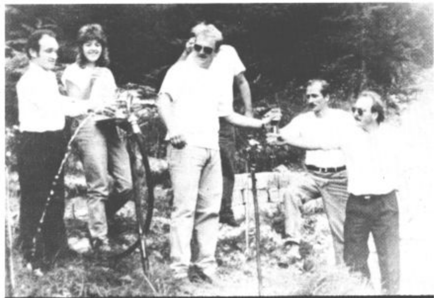
Čeprav so se zbrani najprej odžejali z vinom, jim je kljub temu čista voda iz novega zbirališča zelo teknila.

Želja po napredku je v tej krajevni skupnosti še veliko, vendar o njih v nedeljo niso podrobneje govorili, saj je bilo praznovanje tudi priložnost, da so bili krajani znova skupaj, na srečanju, ki so ga popestrile tudi njihove vaške igre. vos