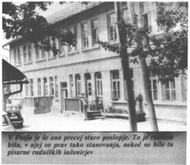
V Pesju je še eno precej staro poslopje. To je manor hiša, v njej so prav tako stanovanja, nekoč so bile tu pisarne rudniških inženirjev