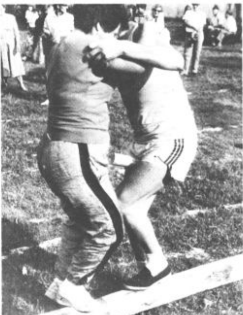
Veselo, sproščeno je bilo tudi med vaškimi igrami.