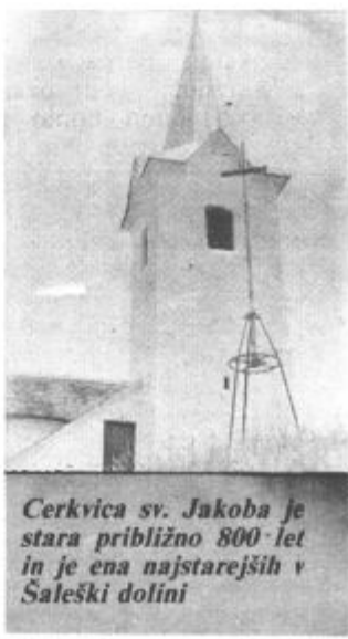
Cerkvica sv. Jakoba je stara približno 800 let in je ena najstarejših v Šaleški dolini