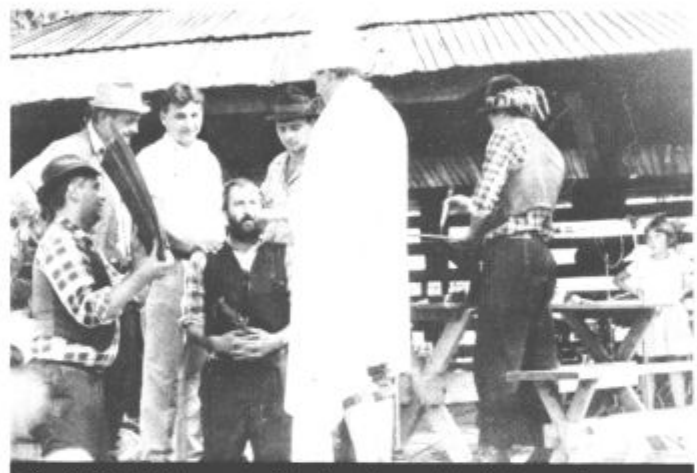
Če želiš biti flosar, te čakajo trde preizkušnje, predvsem pa mokre (zunaj in znotraj)

ve Štife do Luč in nazaj do Poljan in Mozirja — pa seveda domačini. Na obrežju Savinje so flos z rahlim zamikom uspešno udri, kasneje na njem prikazali dva zanimiva in predvsem šaljiva nekdanja flosarska običaja, po vseh predpisih in navadah pa v svoje vrste sprejeli novega flosarja in prav ta »flosarski krst« si letos zasluži posebno pohvalo. Za zaključek uradnega dela so se pogovorili še z najstarejšim živečim flosarjem in s turistoma, ki sta Ljubnemu najbolj zvesta. Zanimivo — Ljubno obiskujeta že natanko 30 let in prav toliko je »star« flosarski bal, zato so ju domačini in flosarji temu primerno tudi nagradili. Zvestoba pač veliko velja. Da je bilo kasneje in še dolgo v priljubljenem Vrblju veselo in zabavno, ni treba dvomiti. Srečno pot torej flosarskemu balu na Ljubnem ob vstopu v četrto desetletje. (fp)