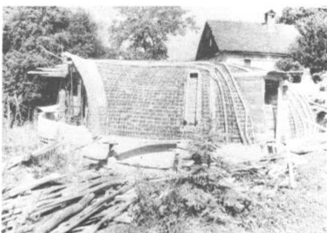
Hiša sicer še vedno ni podobna klasični, a že dobiva končno podobo. Kmalu bo prijeten in topel dom Cagličevih

Odhitimo v Bevče, kjer je gradbišče bioklimatske hiše