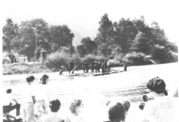
Udiranje flosa in igre na vodi so bile posebna poslastica