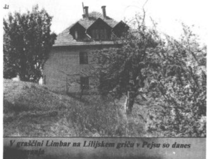
V graščini Limbar na Lilijskem griču v Pesju so danes

Pred prvo svetovno vojno je tedanji lastnik Limbarja prodal poslopje državi in takrat je bilo preurejeno v rudarska stanovanja. Kot zanimivost si velja ogledati lepo ohranjen le 0,9 metra globok vodnjak na vitelj ob graščini Limbar.