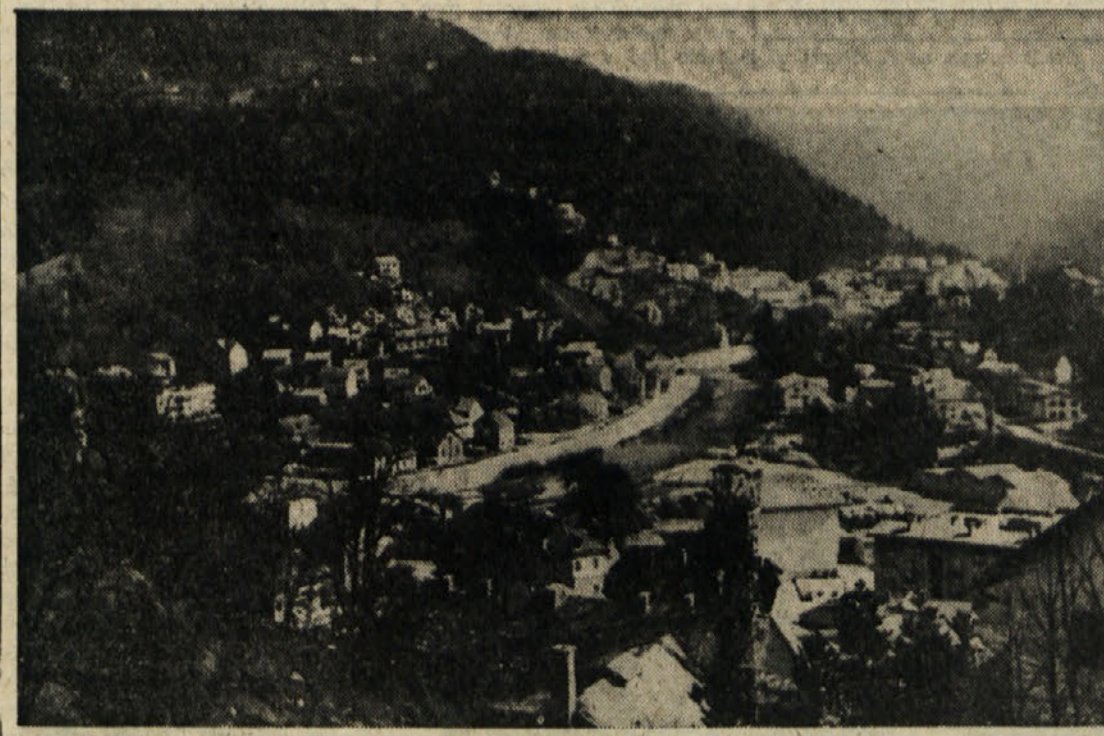
Pogled na vzhodni del mesta Idrija