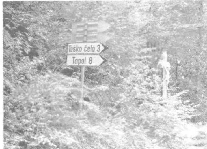
Na sedlu, kjer se cesta prevesi s Šišenske občine na Viško stran je odcep na Topol. Tu je stal lesen križ, ki pa so ga neznanci v šestdesetih letih, podrli, kajti v deželi so zasijali boljši časi. Sedaj pa se sprašujemo kakšni časi so prišli, ko križ zopet stoji in to betonski. Mogoče pa res pričakujemo pomoč z neba.