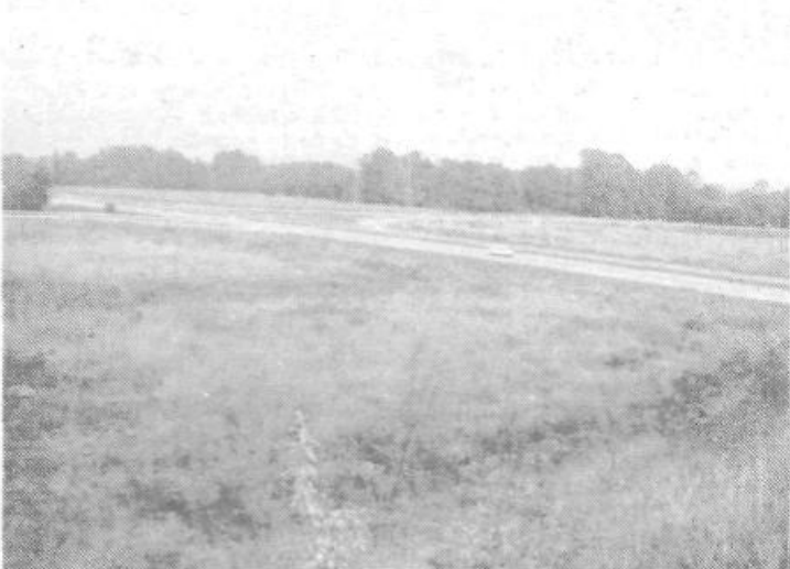
V Vižmarjih imamo veliko in sodobno cestno pentljo. Gotovo nimamo nič proti tovrstni sodobni ureditvi cestišč. A žalostno se je voziti po njej in gledati okoli VELIKE OBDELOVALNE POVRŠINE zaraščene s šavjem. Prav neverjetno, saj se pri vsakem zazidalnem načrtu bojimo, da nam še tiste male koščke kakovostne zemlje ne bi pozidali, po drugi strani nam je očitno odveč.