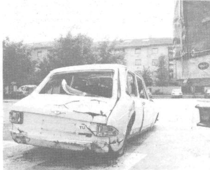
Ker so avtomobilski deli zelo dragi, se je tudi neznan stanovalec Preških blokov odločil, da bo odprl avtomobilski odpad. Moramo ga opozoriti, da bi vsaj svojo »firmo« lahko kam, na kakšen prometni znak obesil, drugače bodo ostali Preščani mislili, da je stoenka le nepotrebna in grda navlaka.