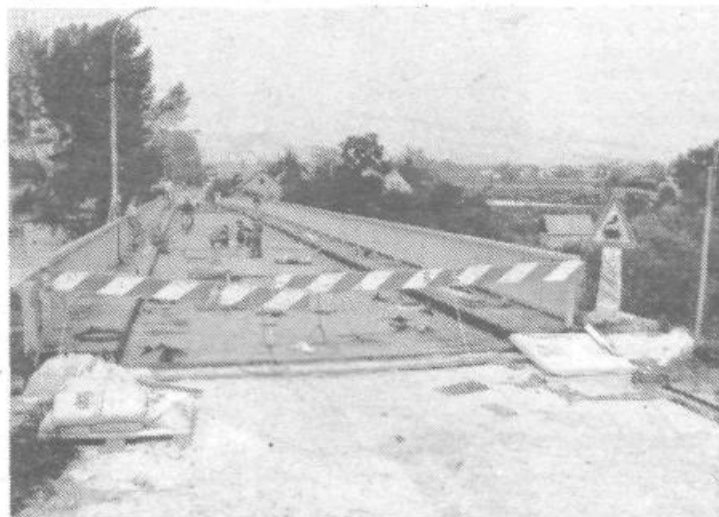
Verjeli ali ne most v Goričanah še ni odprt za promet. Gotovo zato, ker se skorajda sam obnavlja, saj delavci bolj pazijo, da jih kdo ne zaloti v kar najugodnejših položajih. Krajani pa naj pešajo ali po Sori čolnarijo z enega na drugi breg.