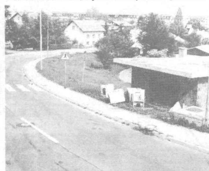
Ob cesti, ki se s Celovške vzpenja proti Pržanu, bo nekoč ali pa vsaj v bližnji prihodnosti servis pralnih strojev. Stranke opozarjamo, da pri naši birokraciji ni mogoče dobiti dovoljenja za tako obrt tako hitro in, da naj s svojimi odsluženimi gospodinjstvi aparati še malo počakajo. Če smo se zmotili, upamo da bodo z dobro voljo lastnika in komunale kmalu tam, kjer je prostor za tovrstne bisere bele tehnike.