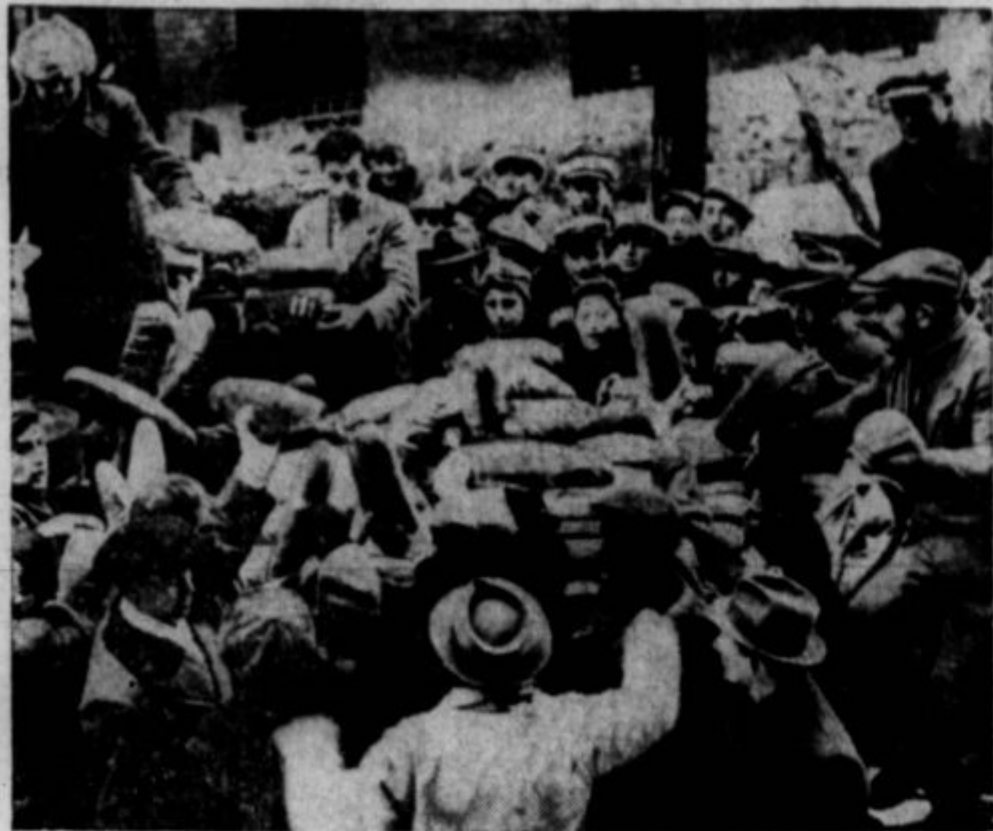
RAZDELJEVANJE KRUIHA je ena največjih nalog zaveznikov, kar jih imajo sedaj v Evropi. Gornje je prizor, ko ga dele židom v Berlinu.