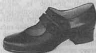
Model z modno, štirioglato konico in paščki čez nart