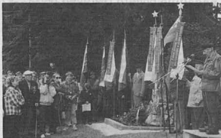
S srečanja borcev na Javorču