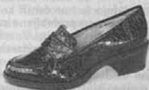
Modni čevljev v potiskanem loku z modnim podplatom in peto