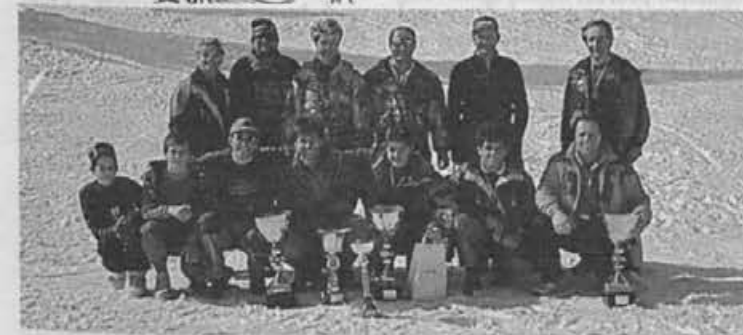
Ekipo Alpine, ki je tudi letos dosegla prvo mesto v pokalu Ski open

Delavski direktor naj bi skrbel za ustrezno organiziranje in izvajanje varnosti pri delu, kar je tako v interesu delavcev kot lastnikov družbe. Gre za preprečevanje poškodb pri delu in poklicnih bolezni pa tudi boleznih dela. Upoštevati je treba, da je lahko samo zdrav delavec kreativen in učinkovit in da lahko samo zdrav delavec prispeva k ustvarjanju nove vrednosti.