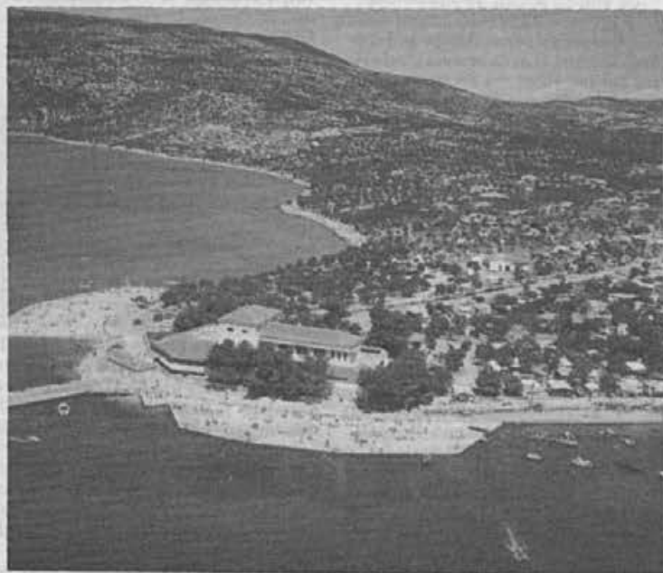
S počitniškega naselja Kovačine, kjer bomo letos letovali