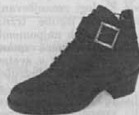
Gležnarji z močno štirioglato peto, podplat gladek