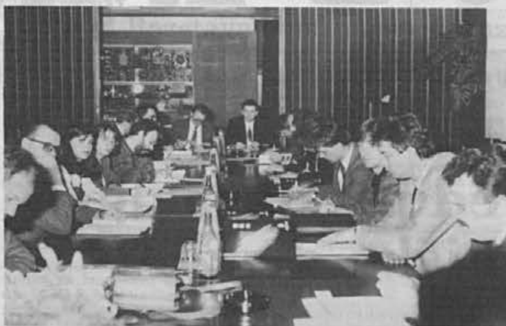
Kar okoli dvajset predstavnikov dvanajstih investicijskih skladov se je udeležilo predstavitve Alpine - pred morebitnim nakupom dela delnic