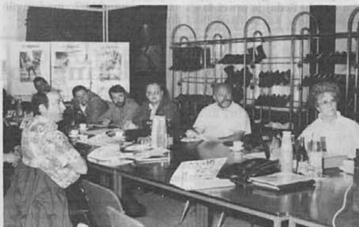
Strokovni posvet o varstvu pri delu v čevljarski in usnjarski industriji je bil tokrat v Alpini