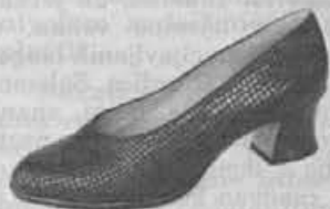
Modna, širša kopita, močna zvončasta peta, potiskani materiali...