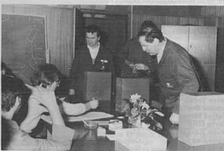
Izvolili smo svet delavcev

Svet delavcev, ki smo ga izvolili 13. aprila, tako ni organ delniške družbe, je pa pomemben zastopnik socialnih in kadrovskih vprašanj delavcev.