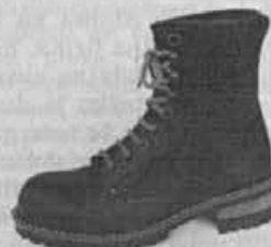
«BULER» - obutev za mlade