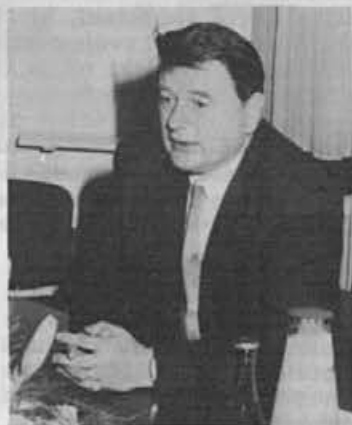
Direktor podjetja je predstavil Alpino pooblaščenim investicijskim družbam