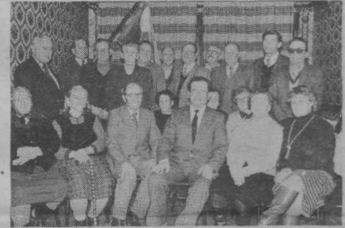
Člani združenja oziroma sekcije VVI Večve — Zgornji Kašelj, ki so bili navzoči na seji. Zaradi zdravstvenih razlogov se osem članov skupščine ni moglo udeležiti.