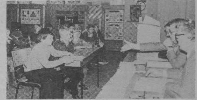
Ekipa je imela na voljo za razmislek le pet minut, naker je morala odgovoriti na tri vprašanja