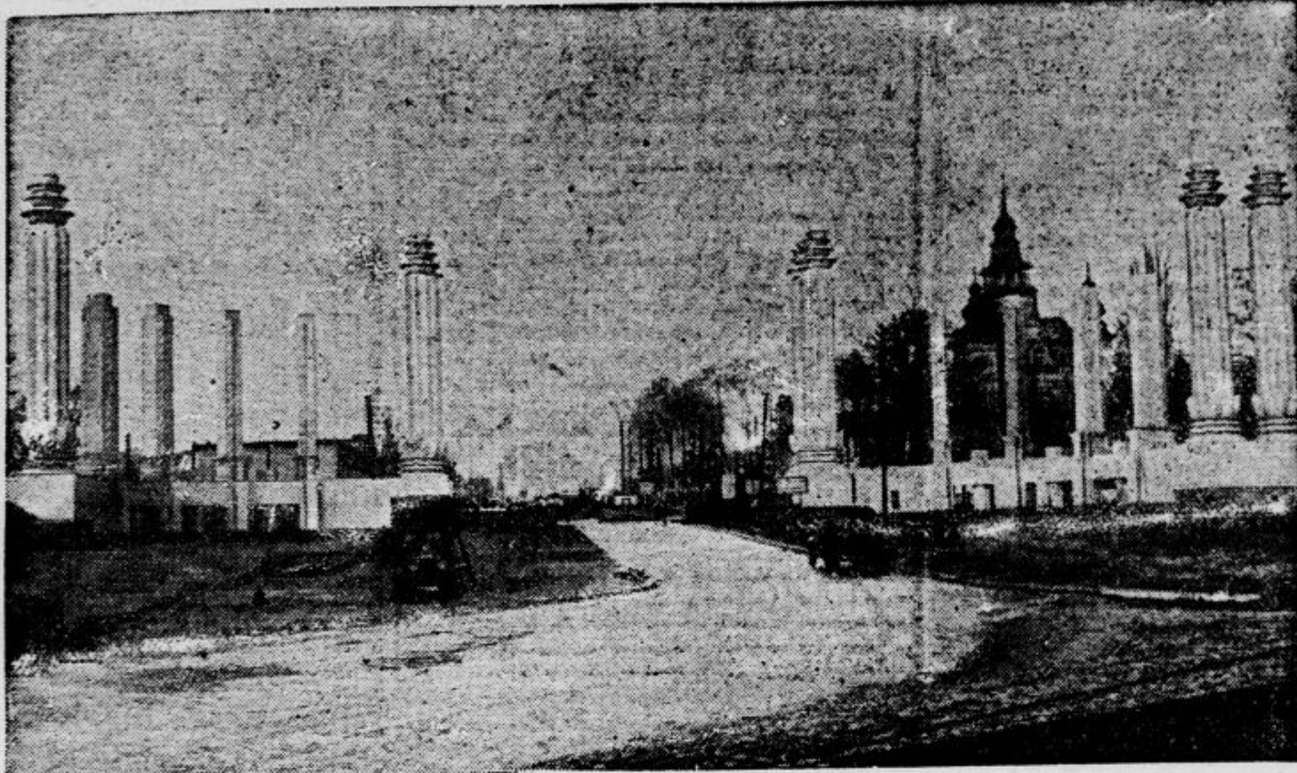
V belgijski prestolnici pripravljajo svetovno razstavo, za katere je že vse aranžirano. Slika nam kaže impozanten vhod na razstavišče