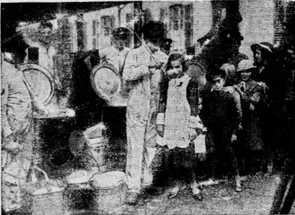
Angleški vojaki iz Essena, ki so stacionirani v bližini Neunkirchana pri Sarrebrucku, gostijo mlade Posaarce z vojaško juho