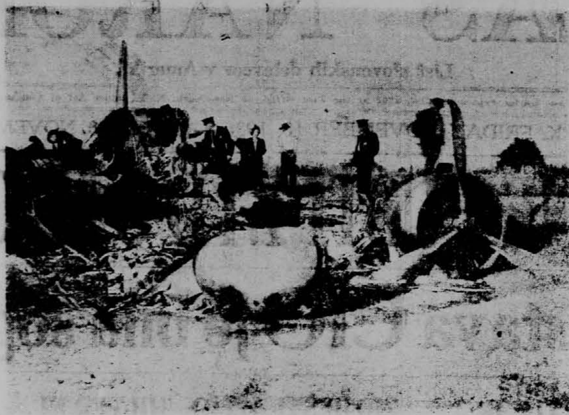
Ostanki potniškega letala, v katerem se je nahajalo petnajst oseb. Letalo je imelo dva motorja. Ko se je eden vnel je pilot s pomočjo drugega srečno pristal. Ko je bilo vseh štrinajst oseb na varnem, je letalo eksplodiralo.