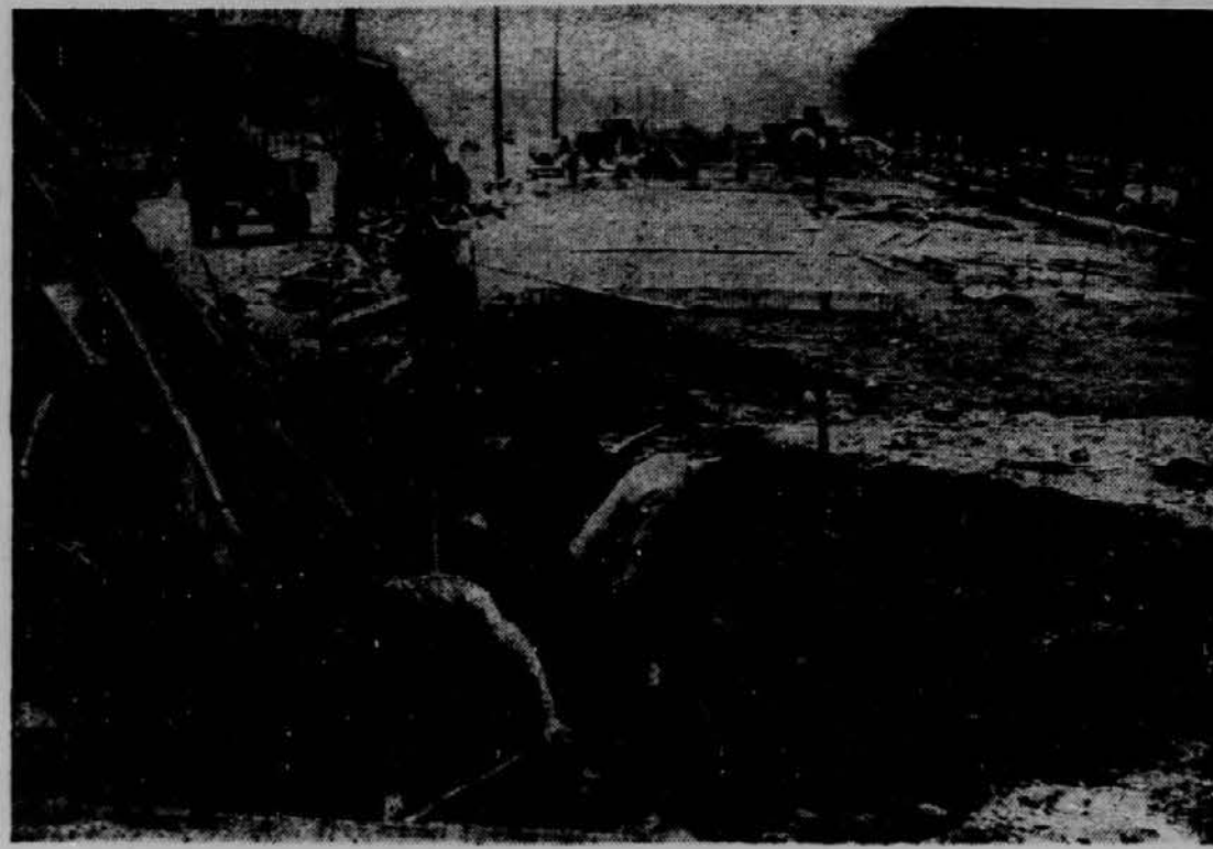
V Nemčiji so začeli graditi veliko moderno cesto, ki bo spajala Berlin z vzhodnimi in zapadnimi kraji Nemčije. Po nji bodo smeli voziti samo trucki in avtomobili.