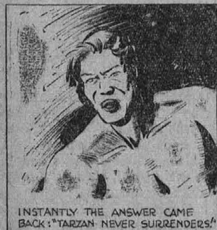
Takoj za tem pride tudi odgovor nazaj: "Tarzan se nikoli ne poda!"