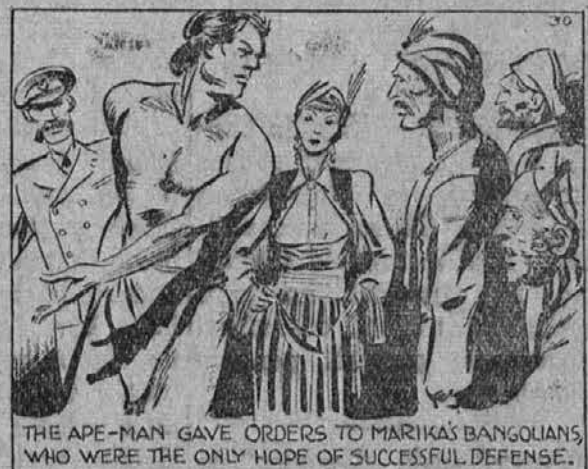
Tarzan je nato dal povelje Marikinih Bangoucem, ki so bili edino upanje uspešne brambe.