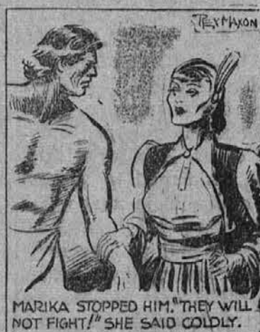
Toda Marika ga je ustavila. "Oni se ne bodo borili!" je rekla hladno.