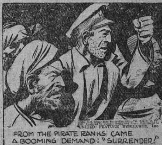
Iz skupine razbojnikov se tedaj nedavno zasliši bobneca zahteva: "Podajte se!"