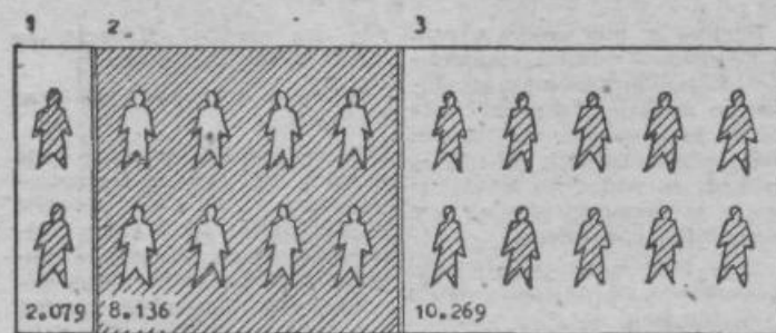
1. s fakulteto in srednjo šolo, 2. z nižjo šolo, 3. brez kvalifikacij

Ta risba kaže stanje strokovnega kadra v kmetijskih in obdelovalnih zadrugah v začetku leta 1956. Iz nje je razvidno, da zadruge nimajo dovolj kvalificiranega kmetijskega osebja. V 6.876 zadrugah, kmetijskih in obdelovalnih, dela le okrog 2.080 uslužbencev s fakultetno izobrazbo, kar pomeni, da pride na vsako tretjo zadrugo po en fakultetno izobražen uslužbenec. Od tega števila je le 1.052 uslužbencev, ki so kmetijski strokovnjaki. A od kmetijskih strokovnjakov, ki delajo v zadrugah, jih je le 170 agronomov, medtem ko so drugi tehniki s srednjo strokovno izobrazbo.