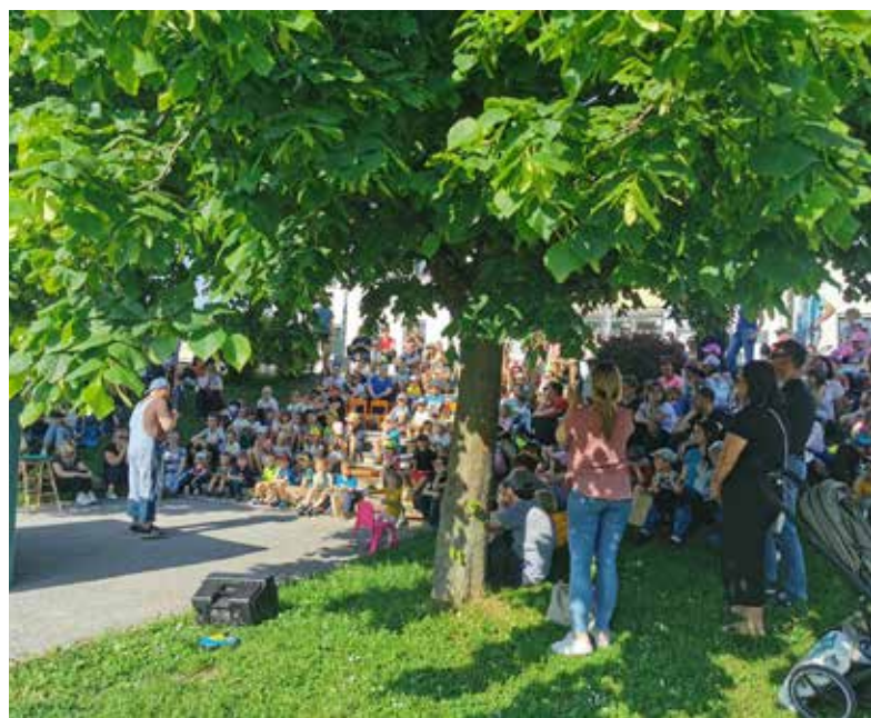
Zaključek Predšolske bralne značke in pravljīčnih uric z mačkom Murijem.

Čaka nas torej vroče bralno poletje, zato si pravočasno priskrbite počitniško branje, sicer pa smo v knjižnici vedno pripravljeni z bralnimi paketi presenečenja in drugimi bralnimi priporočili.