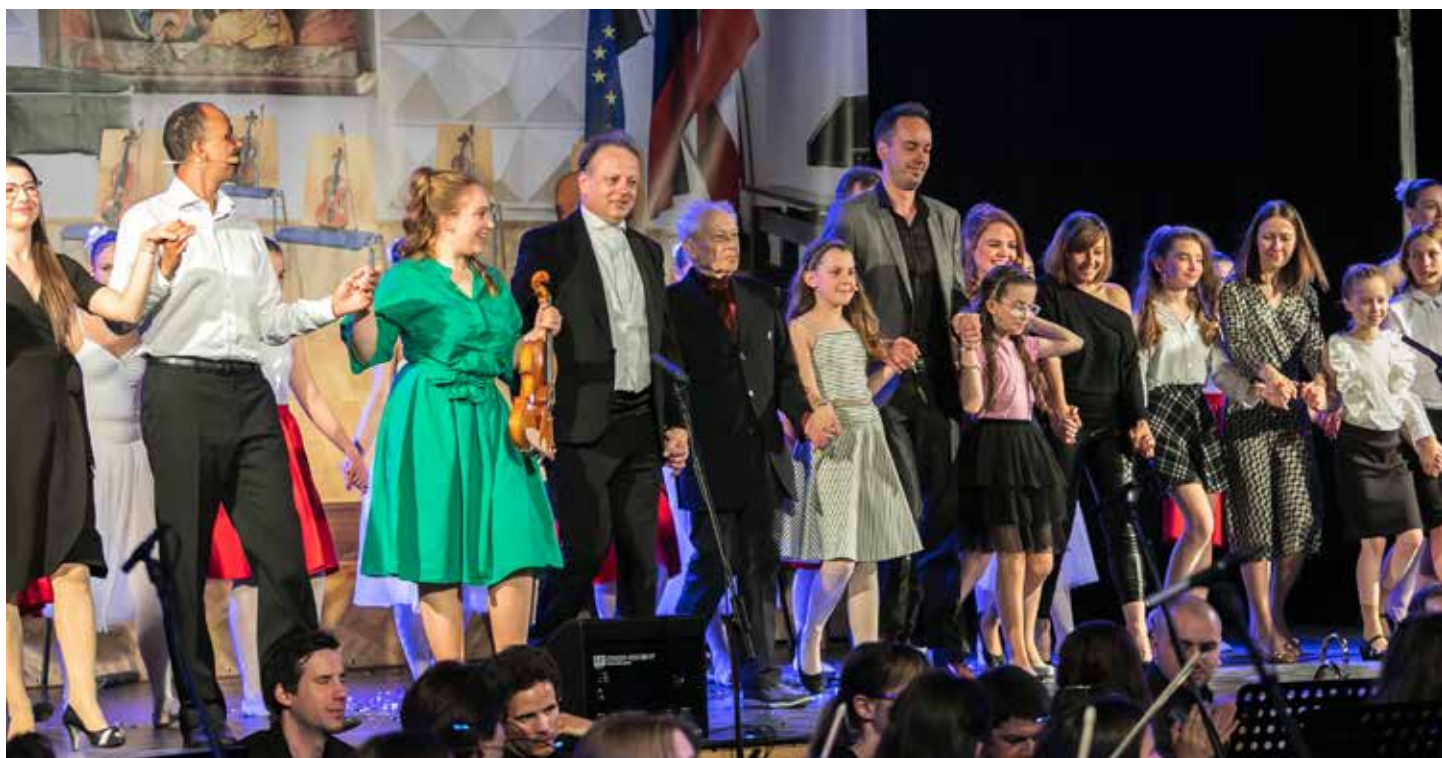
Osrednji ustvarjalci operete.