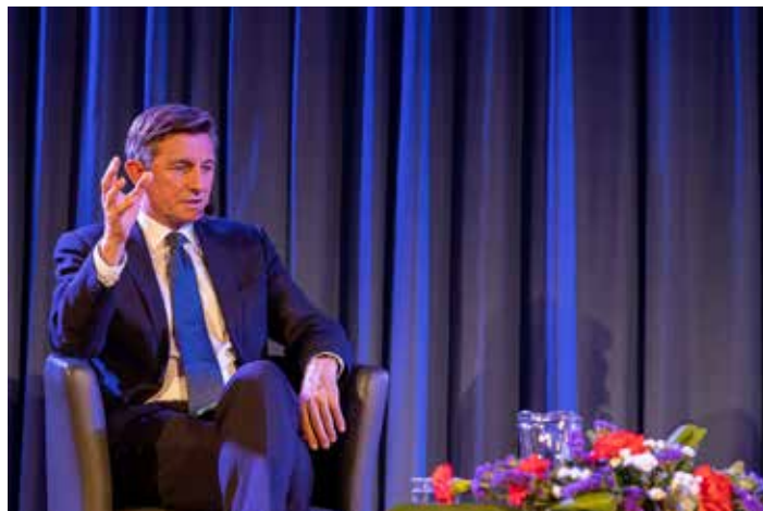
Podpis pod foto: »Borut Pahor, politik preudarnih misli in dejanj, gost Nikolajevih večerov«

V mednarodnih odnosih, ki so mu bili vselej najbližji, je bila ob treznosti, tehtnosti brez zaletavanj potrebna tudi dobršna mera prijaznosti. Ob tem je opozoril na mnoge incidente med Slovenijo in