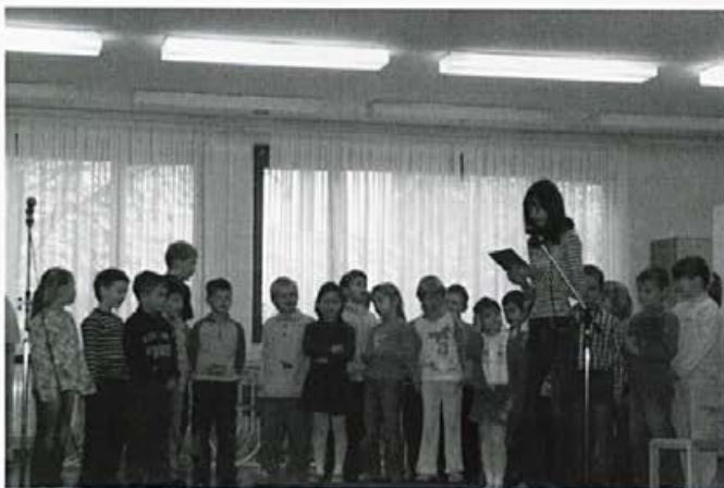
Sprejem prvošolcev v šolsko skupnost