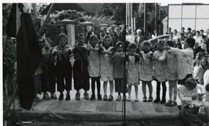
Nastop najmlajših pred Lamutovim likovnim salonom