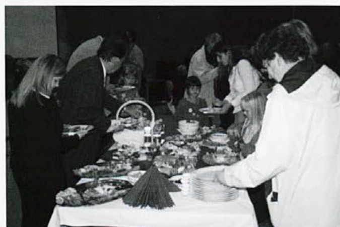
Ob okusni hrani naših odličnih kuharic je tudi druženje prijetnejše.