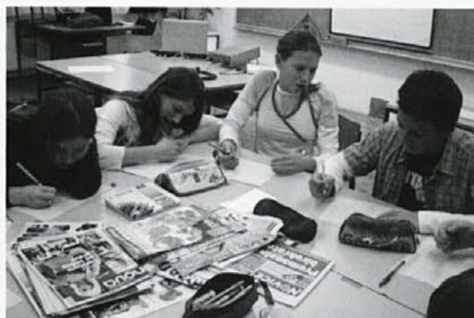
Skupina raziskovalcev 9. a razreda