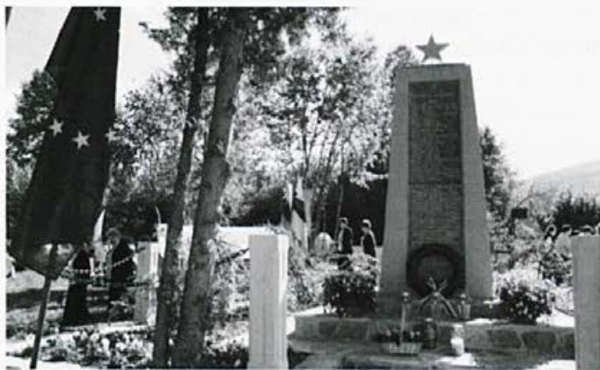
Obnovljen spomenik na Oštrcu