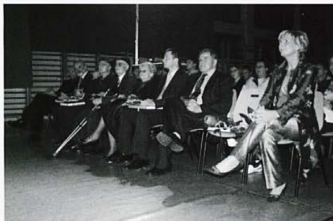
Visoki gostje na slavnostni akademiji