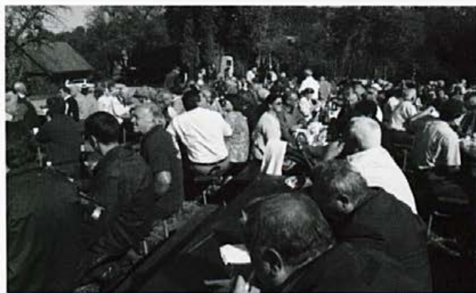
Prijetno druženje ob lovskem golažu