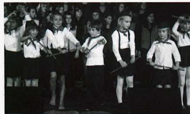
Plesalci skupine Harlekin so nas popeljali v čas pionirjev.