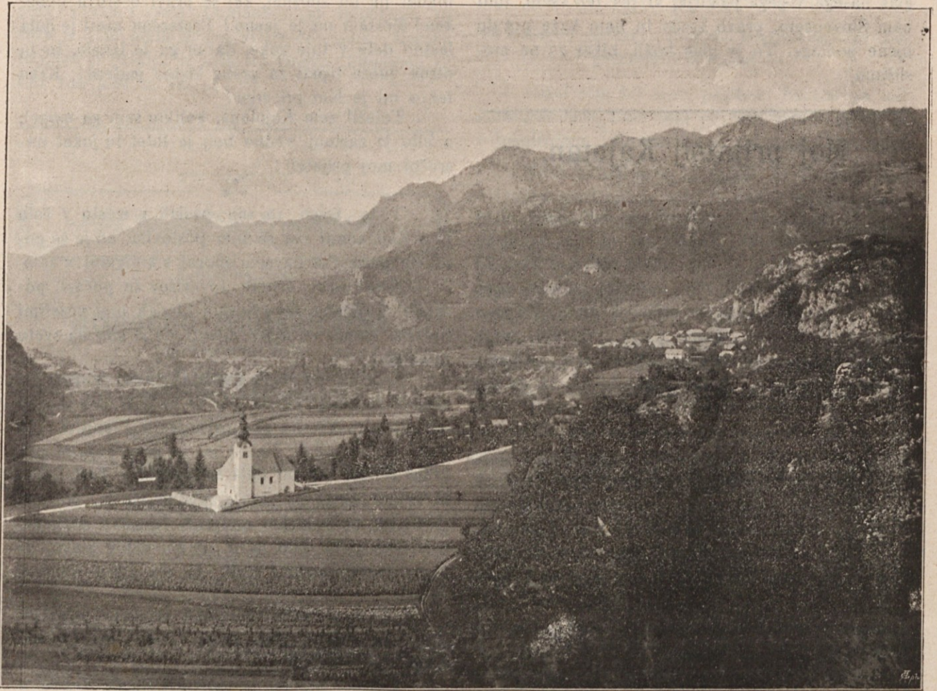
Bohinjska Bela na Gorenjskem.