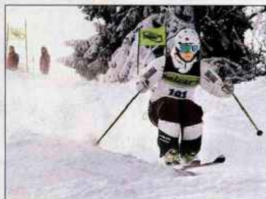
Na evropskem pokalu v smučanju po grbinah je nastopilo 78 tekmovalcev.