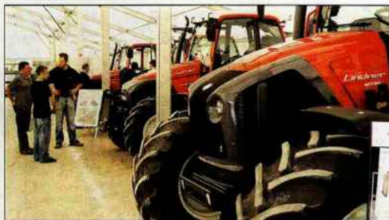
Olajšavo je možno uveljavljati tudi za nakup traktorja.

Kranj - Kot navajajo v davčni upravi, so do olajšave upravičeni vsi, ki so lani v okviru kmečkega gospodarstva ali agrarne skupnosti vlagali v osnovna sredstva in opremo, potrebno za opravljanje osnovne kmetijske in gozdarske dejavnosti. Za osnovno dejavnost se šteje pridelava, ki je v celoti ali pretežno vezana na uporabo kmetijskih in gozdnih zemljišč (razen pridelave sadik, okrasnih rastlin in intenzivnega vrtnarstva), pa tudi čebelarstvo in pridelava vina iz lastnega pridelka grozdja. Olajšavo je možno uveljavljati za investicije v traktorje, pluge, brane, mulčerja, valjarje, freze, sejalnike, sadišnike, škroplilnike, trosilnike, kombajne, kosilnice, obračalnike za seno, nakladalce in druge traktorske priključke, molzne stroje, hladilnike za mleko, cisterne, sode, krmilnike in napajalnike za živino v hlevih in na pašnikih, motorne žage, hidravlična dvigala, vitle, delovno orodje in drugo opremo, gozdne vlake, ceste, namakalne naprave, sadovnjake, plemensko in delovno živino (razen tiste, ki se pita) ... Olajšave pa ni možno uveljavljati za nakup zemljišč, za nakup ali gradnjo stavb, za nakup motornih vozil (z izjemo trak-