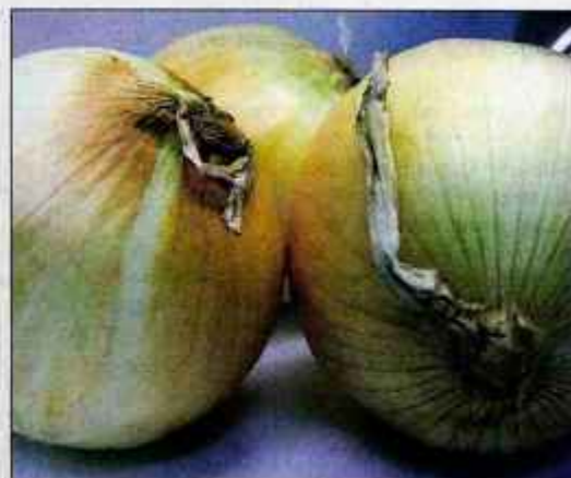
Čebula odžene stran tudi zdravnika.

snov, ki preprečuje strjevanje krvi, zaradi česar jo vse bolj čislajo kot preprečevalko kardiovaskularnih bolezni. Zniževala naj bi previsok krvni tlak in preprečevala aterosklerozo.