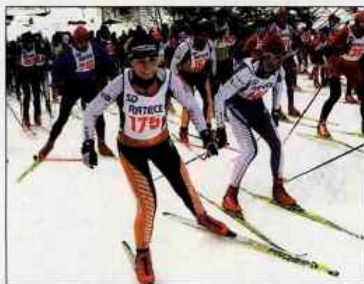
Na startu 21 km dolge proge je bilo 124 tekmovalcev.

Pokal SLOvenski maraton se bo nadaljeval 25. januarja s smučarskim tekom Ribniške kočice (20 km). Sledili bodo še tek Osankarica (1. februar), Bloški teki (8. februar), Trnovski maraton (15. februar), Vojsko (22. februar), Maraton Rogla - Unitur Rossi (7. marec) in za konec 22. marca še Poključski maraton AdriaticSlovenica.