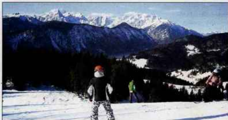
Smučišče Španov vrh nad Jesenicami - obratovati je pričelo že 20. decembra, sezona pa naj bi trajala vse do 20. marca.