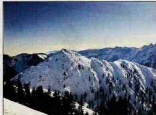
Bele peči s Trupejevega Poldneva