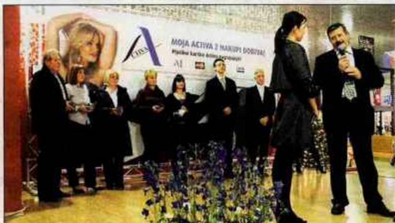
Na slovesnosti ob podelitvi nagrad izžrebanim imetnikom plačilnih kartic Activa

nagrad, avtomobilov Citroën C3 Exclusive, je bilo treba izpolniti obrazec z datumi in zneski petnajstih nakupov, opravljenih s katerokoli kartico iz sistema Activa. Na žrebanju v Kopru so imeli srečo