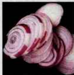
Čebula je preventiva pred prehladi in gripo.

minov, kot so A, B1, B2, C, E, K, H, P, vsebuje tudi minerale, predvsem kalij, kalcij in železo. Na splošno lahko rečemo, da spodbuja in usklajuje delovanje najrazličnejših funkcij notranjih organov, tako želodca, črevesja, jeter, ledvic, pljuč, mehurja, srca, ožilja, trebušne slinavke. Krepi, zavira infekcije, deluje diuretično, antibiotično, antibakterijsko, antialergično, lajša revmo, pospešuje izkašljevanje, pomaga pri bronhitisu, astmi, motnjah prebavil, ledvic in mehurja. Surova naj bi delovala še posebej na sečila, kuhana na prebavila. Čebula, ki jo skuhamo v mleku, odpravlja trebušne krče, vetrove in zgago. Čebulina kura se priporoča vsem, ki jih mučijo ledvični krči, ledvični kamni in zastajanje urina. Če se s polovico čebulne glave podrgnemo po ledjih ali spodnjem delu trebuha, naj bi se iz organizma izločilo več seča. Ker vsebuje glukokinin, ki znižuje količino sladkorja v krvi, koristi pri sladkorni bolezni. Pred leti so v čebuli odkrili