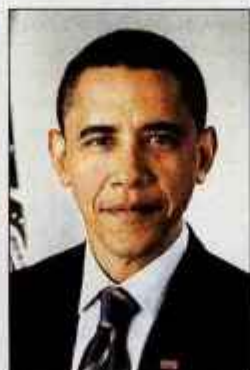
Barack Obama, novi ameriški predsednik