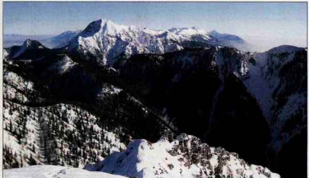
Pogled proti Kepi, Dovški Babi in Golici

Knjiga "Gorenjska Vodnik" predstavlja Gorenjsko na 312 straneh. Vsebuje 2000 fotografij, 50 kvalitetnih zemljevidov in podrobnih opisov lepot gorenjske pokrajine v slovenščini in šestih svetovnih jezikih.