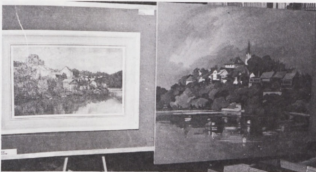
Številni Novomeščani so bili nad prikazanimi deli navdušeni