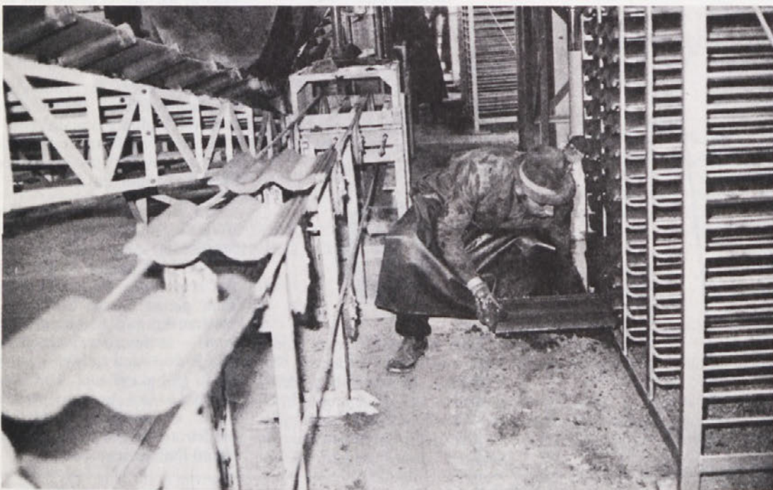
Delavci v „Strešniku“ še niso rekli zadnje besede . . .