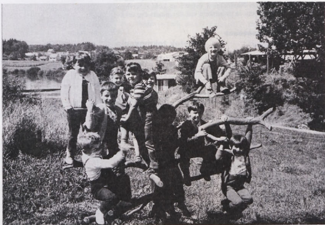
Nekaj nove opreme in igrač, ograjen prostor ter bel pesek, pa imajo naši otroci svoj svet . . .