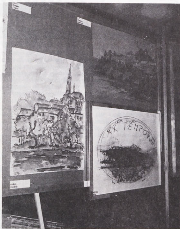
Ex tempore '74

Do konca tedna so umetniki pridno ustvarjali, vmes pa so si ogledali še Lamutov razstavnih salon v Kostanjevici. V soboto so se vsi zbrali na Gorjancih, kjer se je s prijateljskim piknikom uspešno končala letošnja slikarska kolonija.