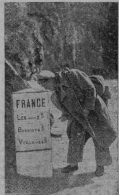
Rdeči španski begunec poljubi francoski obmejni kamen iz hvaležnosti, ker mu je uspел pobjeg.