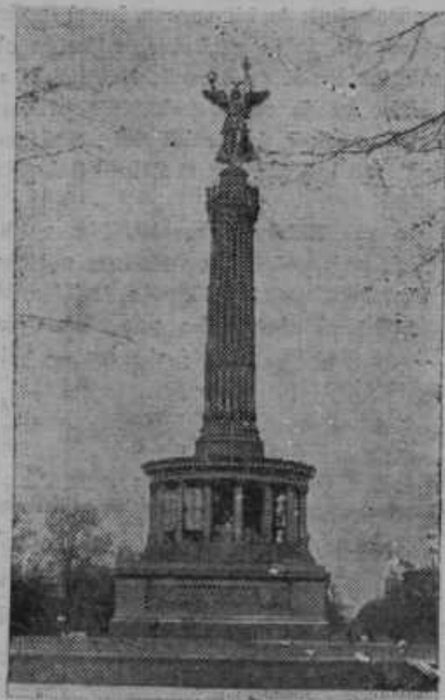
Zmagoslavni steber v Berlinu bo predstavil s Kraljevega trga v živalski vrt.