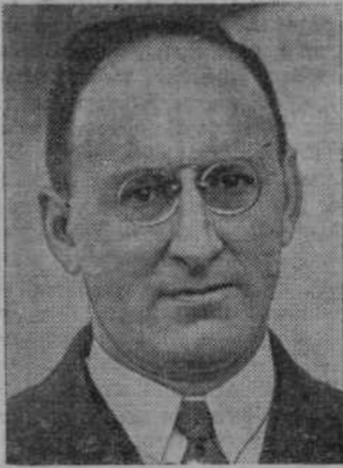
H. Morgenthau ml., novi finančni minister Združenih držav Severne Amerike.

ravnatelj Zadruga zveze v Ljubljani. Predavanje bo takoj po rani sv. maši ob sedmih v Prosvetnem domu. Ta dan ste v ljudno vabljeni vsi, stari in mladi. Dvorana mora biti tokrat nabito polna!