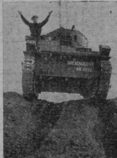
Zmagoviti tank Francoske armade po predoru nacionalistov do morja.