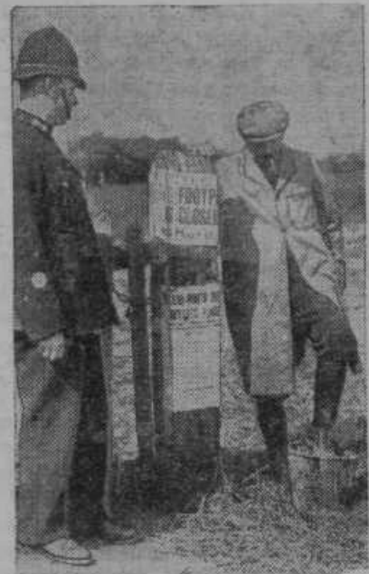
Slinavka in parkljevka je na Angleškem močno razširjena. Na sliki vidimo policista, ki pozivlja mesarja, da si razkuži obuvale.

drugem dopisu v »Domovini« z dne 14. aprila ravno isti dopisnik vprašuje, kaj je z elektrifikacijo naše občine, ko pa je akcija za elektrifikacijo ravno v dopisnikovi vasi naletela na najhujši odpor. Električni boji so v doglednem času zasvetili pri nas, želimo pa, da bi zasvetili tudi v glavi dopisnika »Domovine«, da bi spoznal, da je občinski odbor najmanj kriv. Dopisnik govori tudi o kmečkih žuljih, s katerimi so se zgradile nove stopnice proti cerkvi. Za vsak žulj, katerega nam pokaže dopisnik, toda le na svojih rokah, ne na jeziku, mu zagotovimo lepo nagrado!