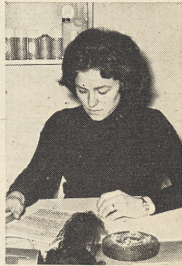
umetnega usnja in kemičnih proizvodov).

Dejstvo je, da smo se pričeli pripravljati na sejem pravočasno in premišljeno in da so nam s svojimi izkušnjami, predlogi, predvsem pa z dobro voljo za sodelovanje izredno pomagali predstavniki strokovnih služb (razvojno tehnološki inštitut in prodajna služba