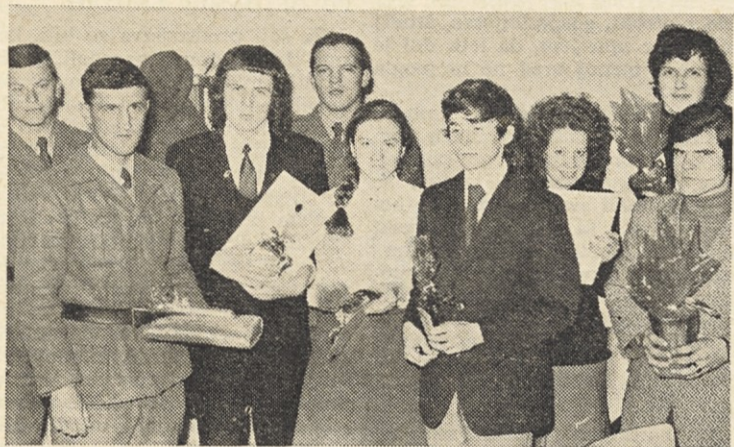
Zmagovalne ekipe iz oddaje »Vse o Titu«: ekipa JLA, ekipa Gimnazije in ekipa Iskre (od leve proti desni)

Po vsej Jugoslaviji se mladina pripravlja na praznovanje 80-letnice predsednika republike Josipa Broza Tita.