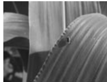
Samec koruznega hrošča