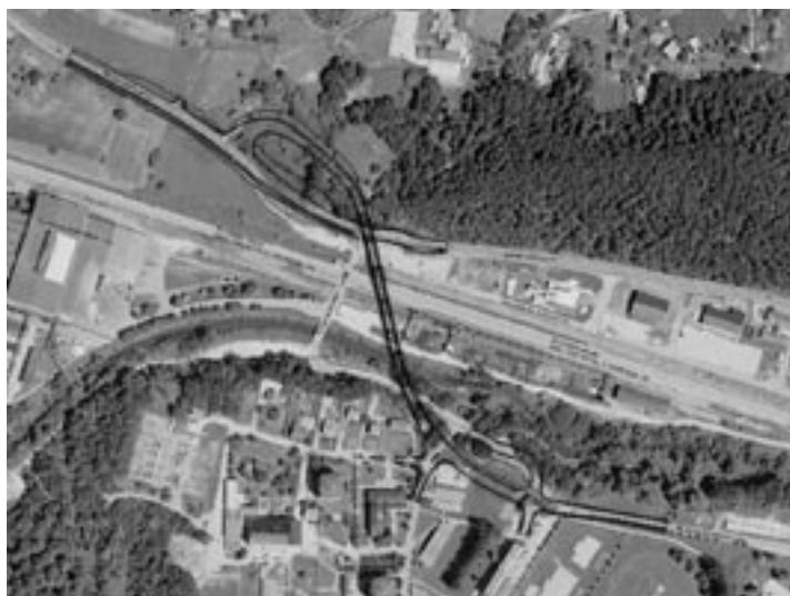
PREGLEDNA ORTO-FOTO-Model Nadvoz Lipa - Štore

Iz navedenega pa izhaja, da bo uradno objekt zaključen konec leta 2007. Vidimo se torej na otvoritvi.