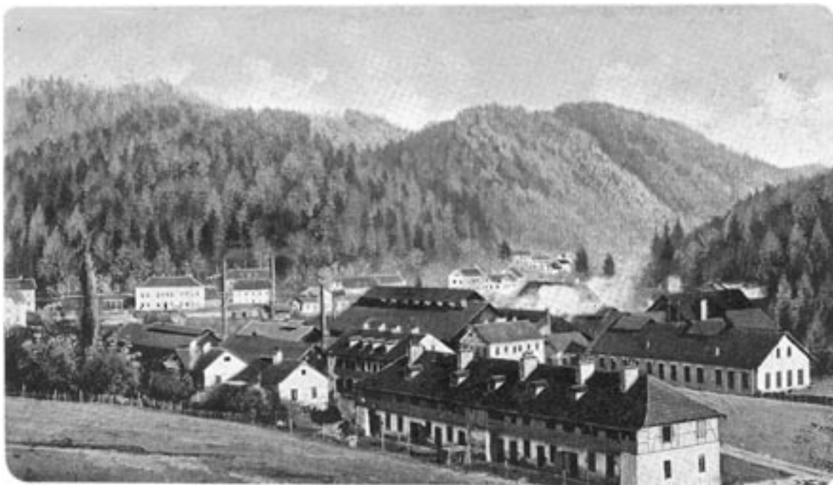
Štore leta 1902