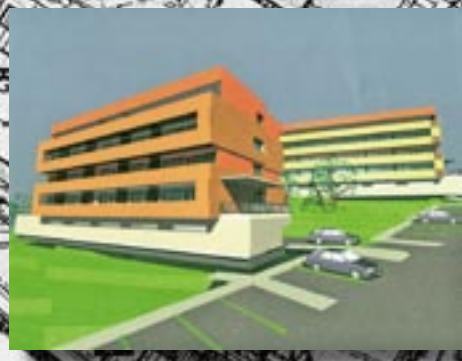
Prikaz širšega območja sprememb zazidalnega načrta Lipa-Štore