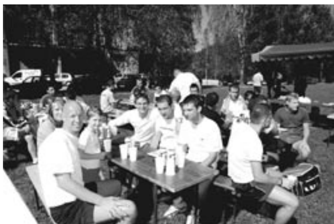
Druženje bo postalo tradicionalno