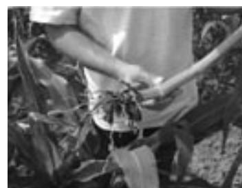
Ličinke so poškodovale korenine