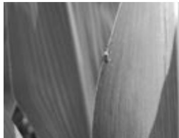
Samica koruznega hrošča

jih izležejo samice, so svetla, ovalne oblike in dolga do 0,5 mm. Iz jajčec se izležejo tanke in podolgovate ličinke, ki so bele barve in imajo temno glavo. Odrasle ličinke so dolge okrog 13 mm. Buba je prosta in bela.