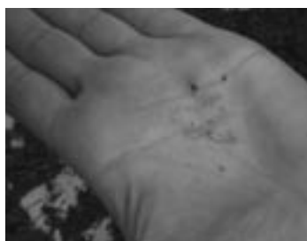
Ličinka koruznega hrošča

Koruzni hrošč se najhitreje širi na območjih, kjer pridelujejo koruzo v monokulturi, na širjenje, predvsem na velike razdalje, v večji meri vplivajo tudi vetrovi, transport, ... Odrasli hrošči se spomladi hranijo s koruznimi listi in povzročajo poškodbe podobne tistim, ki jih povzroči žitni