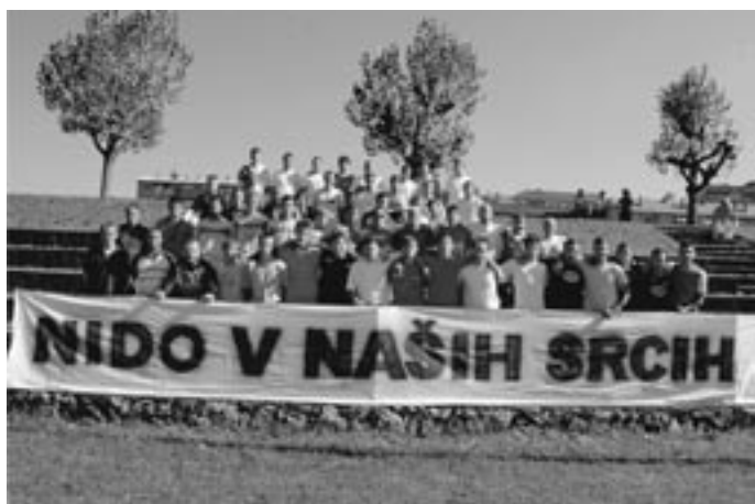
Turnirja se je udeležilo 8 ekip