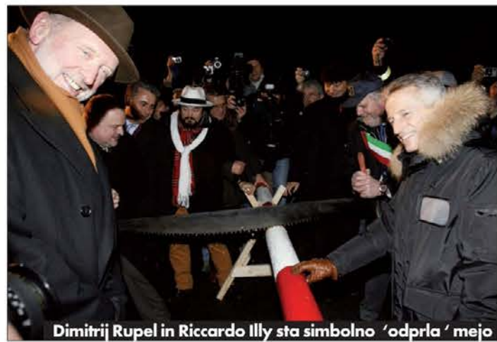
Dimitrij Rupel in Riccardo Illy sta simbolično 'odprla' mejo

skušam gledati naprej. Ali je slovenstvo vsaj ena izmed značilnosti, ki človeka v teh krajih lahko zaznamuje, se sprašujem? Poleg kakovosti, načina življenja, poštenosti, enakopravnosti z drugačnim, tudi uspeha, zakaj pa ne, lahko na spisek dodamo še slovenstvo? Mislim, da moramo to etnično komponento obdržati kot eno izmed značilnosti, ki nas bogati in označuje, navznoter in navzven. In to predvsem v svetu, ki se je v teh letih spremenil na boljše, ko si lahko z lahkoto spremenimo priimek, ki so ga nasilno poitalijančili pred več kot