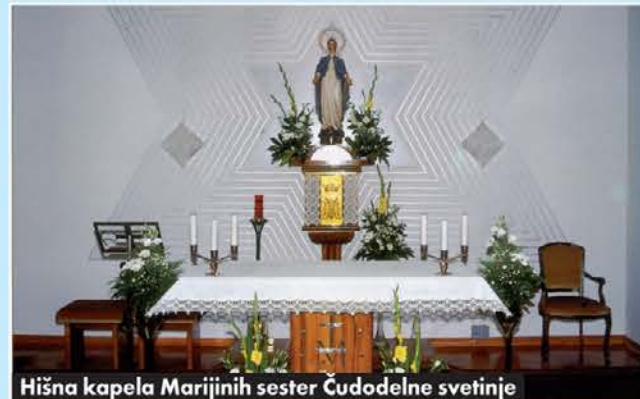
Hišna kapela Marijinih sester Čudodelne svetinje

Kongregacija sester sv. Križa je bila ustanovljena v času, ko se je pravkar začela porajati industrija.