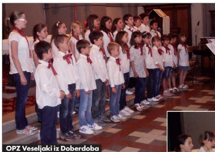
OPZ Veseljaki iz Doberdoba

Združenje cerkvenih pevskih zborov – Gorica odločno želi nadaljevati zastavljeno pot in tako po svojih močeh skrbeti za duhovno rast naše manjšine v duhu krščanskih vrednot in ljubezni do naroda; to je namreč eden izmed pogojev, da bo naša mladina dozorela v osebe, ki bodo še naprej opora pri obstoju in rasti naše narodne manjšine.