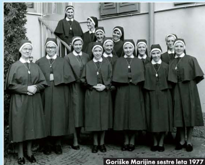
Goriške Marijine sestre leta 1977