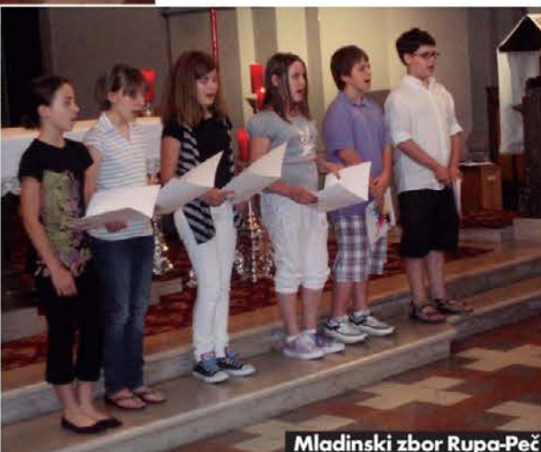
Mladinski zbor Rupa-Peč

zborov – Gorica je novoizvoljeni odbor sklenil, da bo namenil več pozornosti otroški in mladinski pevski dejavnosti tudi tako, da bo nudil večjo možnost nastopanja in s tem prikazovanja znanja. To je namreč velika spodbuda za vztrajno delo mladih pevcev in pevki ter njihovih pevovodij. Ko-