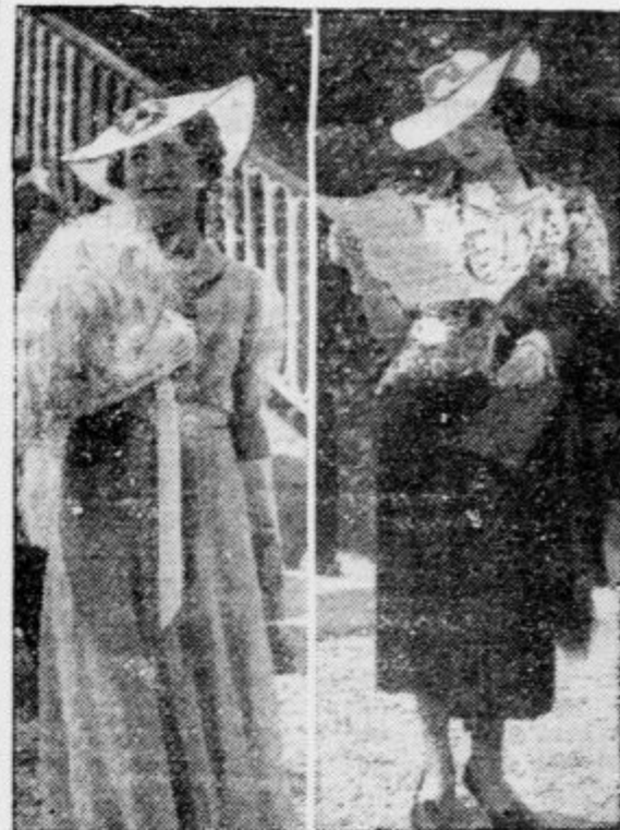
Na zadnjih konjskih dirkah v Autellu pri Parizu so kazale Parižanke najnovejše poletne kreacije modnih salonov