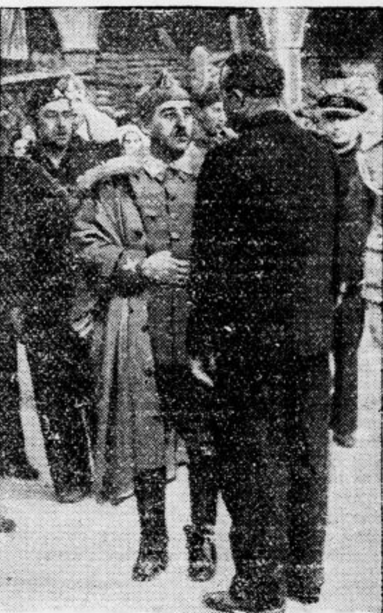
Zmagovalec na bojišču pri Bilbau, general Franco se razgovarja z ujetnikom