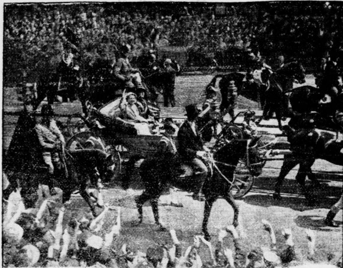
Holandska prestolonaslednica princesa Julijana se pelje s soprogom pa amsterdamskih ulicah