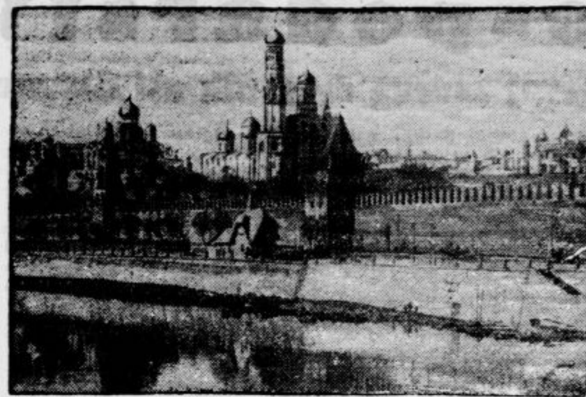
Pogled na ponosni Kremelj, kjer so se odigravala že mnoga važna poglavja ruske zgodovine. V tej palači vlada zdaj rdeči diktator Stalin