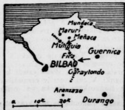
Zemljevid prikazuje položaj na bojišču okrog Bilbae