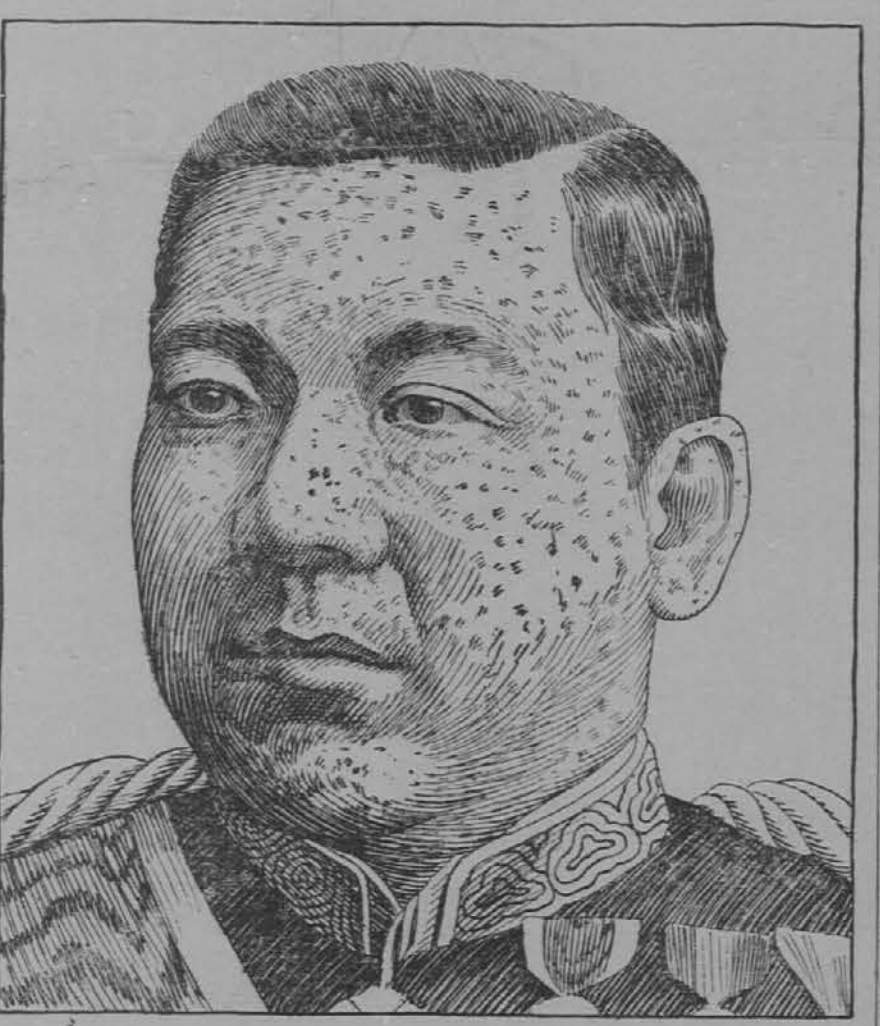
GEN. OYAMA, VRHOVNI POVELJNIK JAPONSKE VOJSKE.

Tokio, 12. sept. Maršal Oyama poroča, da so se kosaške čete pojavile