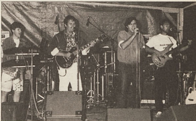
Lačni za rockom - skupina „Lačni Franz“

Minulo soboto pa so prav tako kot Bluesbreakerji navdušili na bilčovškem open-air-koncertu „polet 92“.