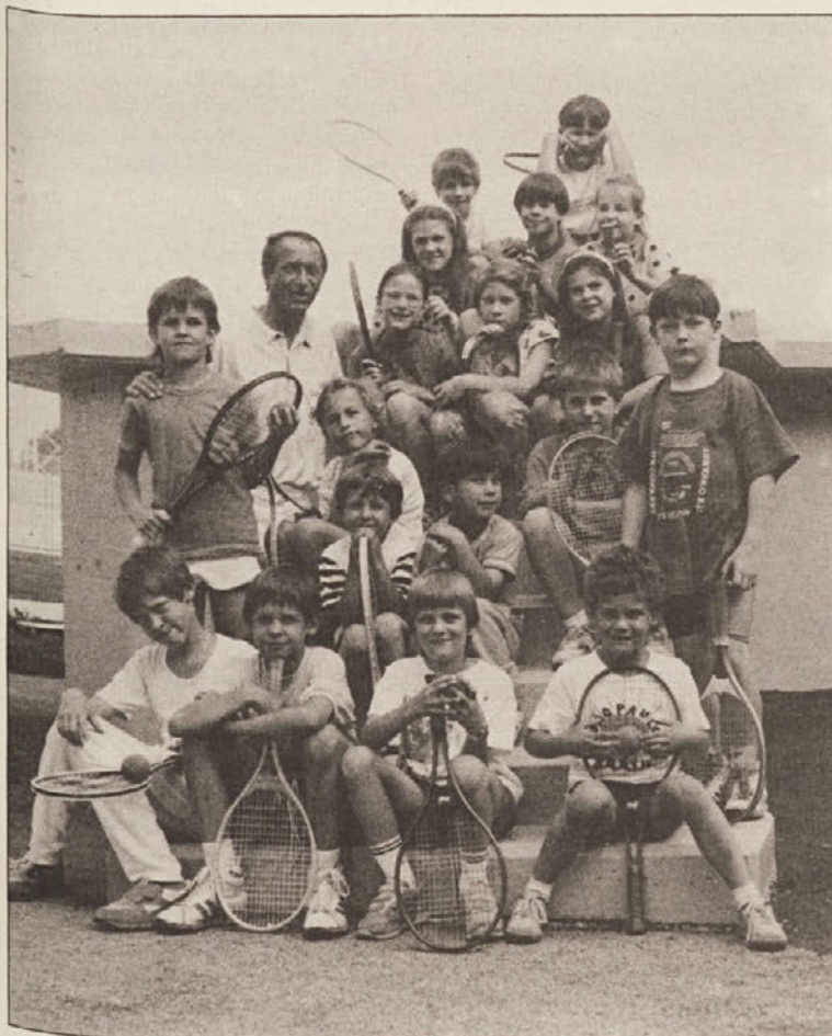
V časopisu poročajo otroci tudi o tečaju atletike.

Otroci Mohorjeve ljudske šole so si zastavili velik cilj in so v teku enega meseca izdali za konec šolskega leta pester šolski časopis, pri katerem je sodelovalo skoraj 30 otrok.