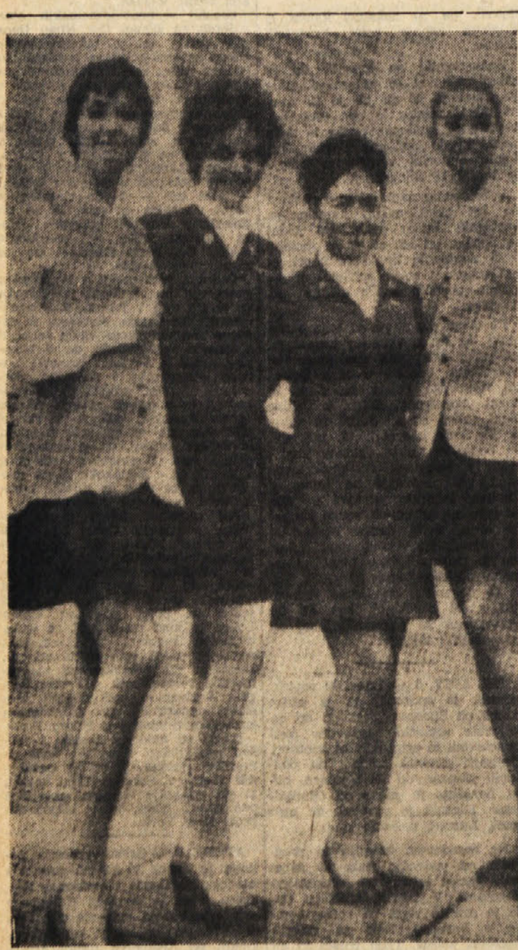
Novi in stari uslužbeniki pri Organizaciji združenih narodov

Do sedaj je podmornica «Ben Franklin» preplula pod poveljstvom oceanografskega raziskovalca Jacquesa Piccarda že 1280 km. Lz Miami Beacha je odpravila 14. julija letos. Sedaj je močvasto sporočilo, da je zdravo, kljub težkim pogojem