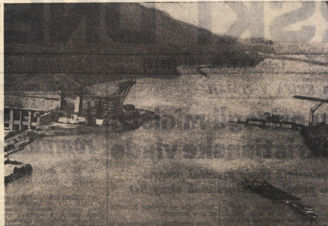
Djerdap: človeška zmaga nad veletokom

Z začetitvijo Donave v Djerdapu se bodo spremenili tisočletni pogoji plovbe po Donavi. Skozi stotletna so ladje in splavi pili skozi težnja vrata po naravnem toku Donave. Od sedaj naprej pa bo to naravno dogajanje odločno milijonov in milijonov kub metrov voda iz širnih planjav Srednje Evrope in goratih predelov Avstrije, tja do meja z Nemčijo, posega človeška roka. Zadržila bo veliko rečno korito ter izkoristila naravno silo vode za proizvodnjo električnega toka v prid Jugoslavije in Romunije, kajti pri tem velikem delu sta udeleženi obe državi. Gre res za veliko delo, ki predstavlja enega izmed najpomembnejših dosežkov izkoriščanja hidroenergetskih virov električnega toka. Poleg tega pa je izgradnja novega hidroenergetskega sistema v Djerdapu pomembna tudi, ker bodo postavljeni novi pogoji za plovbo ladij, vlačitve in splavov