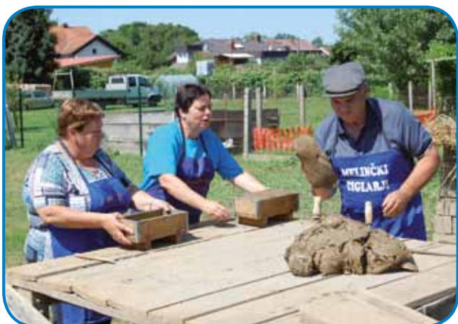
Člani Turističnega društva Brod Melinci prikazujejo, kako so njihovi predniki izdelovali opeke

V Turističnem društvu Brod Melinci so zbrali že veliko dokumentarnega gradiva o melinčkih ciglarjih in izdali o njih tudi knjigo. Dali so izdelati tudi orodje, kakršno so uporabljali za izdelovanje ciglov. To opravilo je trajalo od jutra do večera, so zapisali v knji-