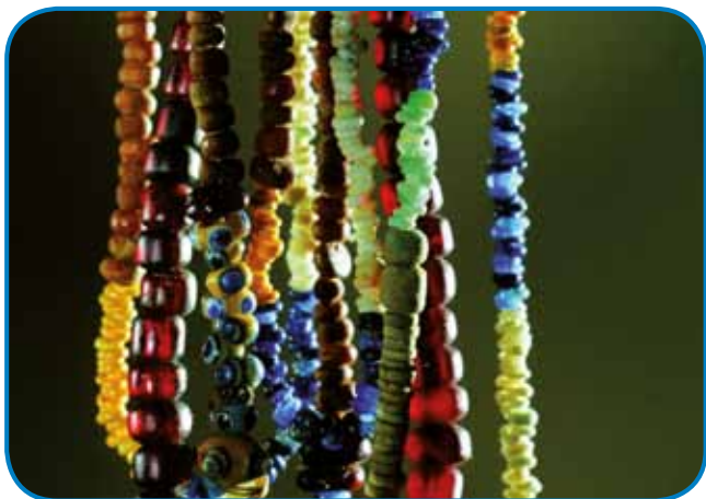
Steklene ogrlice Novomeščank, 8.-4. st. pr. n. št.

izdelki so bili že od nekdaj tako cenjeni, da si danes v resnici ne znamo predstavljati življenja brez njih in se niti ne sprašujemo, kdaj in kje so nastali. Dolenjska pa je pri nas tista pokrajina, ki je že v starejši železni dobi doživela pravi razcvet in sodi med najbogatejša središča v jugovzhodni Evropi. Tu so živeli železnodobni ali halštatski knezi, kar dokazujejo številna enkratna odkritja: med mnogimi vojaškimi najdbami in mojstrsko oblikovanimi bronastimi posodami je tukaj največ nakita iz bronu in jantarja ter več deset tisoč jagod iz raznobarnega stekla, številnih okrasij in barvnih kombinacij ter prefinjene izdelave, česar ni najti nikjer drugje v Evropi. Na tem območju so bile velike količine kremenčevega peska, ki se uporablja za izdelovanje stekla. Od tod poimevanje cvetoči dolenjski halštat. Dolenjska je bila prav zaradi tega v času starejše železne dobe, pred približno 2500 leti, zaradi kulturnega vzpona in ekonomske moči enakovredni del srednje Evrope. Arheologi so iz obdobja prazgodovine na tem ozemlju odkrili ogromne količine steklenih jagod, predvsem v ženskih grobovih. Jagode so bile bodisi spete v ogrlice bodisi razpršene v grobovih. Ustvarjene so v najrazličnejših barvah, tudi v jantarnju, ki so ga prevažali po jantarni poti z