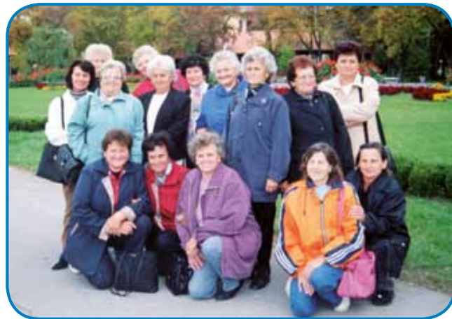
Trno rada je ojdla spejvat k varaškim ljudskim pevкам

vala sem v skupini Lacina Korpiča, sledkar pa še z Varaškimi ženskami. Nika mi je nej žau, zato ka s spejvanjom v telko pa v taše lejpa mesta sem leko ojdla, kama bi ovak nikdar nej prišla. Najbola se mi je tisto vidlo, gda smo v Portoroži nastopali, pa prvo paut sem zaglednila maurdije. Tau nikdar ne morem