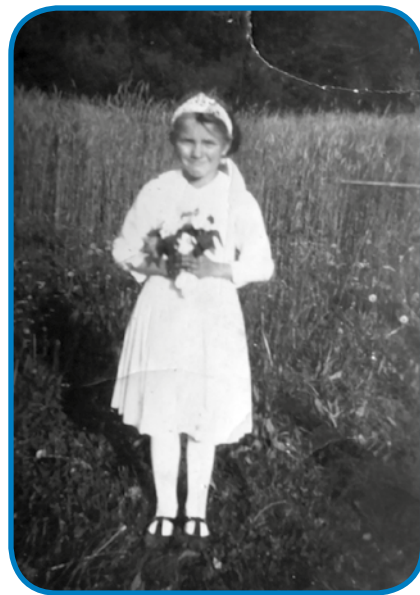
Te kejp so napravili pred njim ramom po prvom prečiščavanji

»Tau me je vsigdar fejst veselilo, spej-