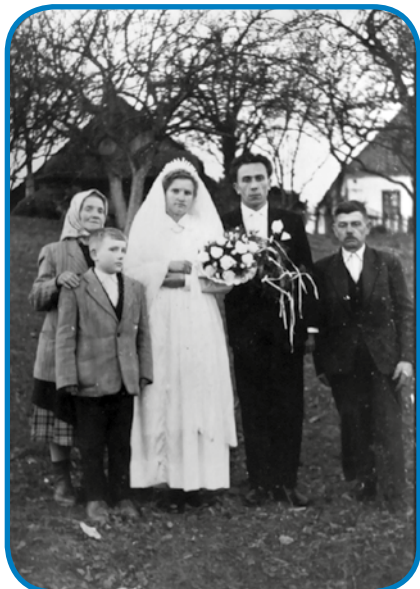
Zdavanjski kejp s prvim možaum, na kejpji so Mickini stariške tō

»Saused je eden stari ladjen biu, on je emo biciklin, on je mena vsigdar pravo, aj se pelam, tak sem se navčila, depa nej je bilau leko. Zato ka moški biciklin emo, gda sem prvo paut prej k štange stau-pila, na drügi tau sem prej-kzletejla. Nej je leko bilau, depa zato sem rada bila, ka sem se navčila pelati. Na ra-