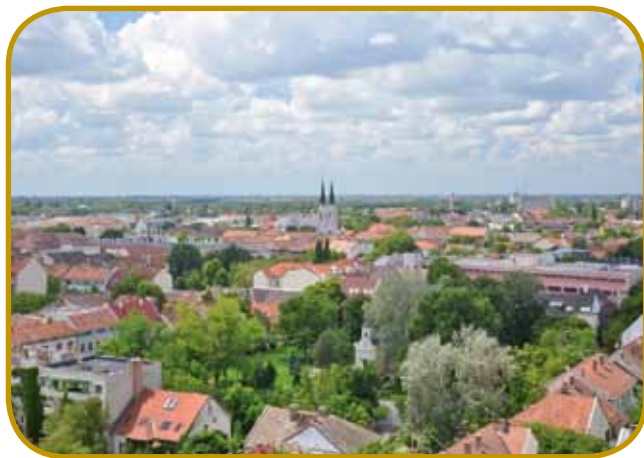
Hódmezővásárhely je drügi najvejši madžarski varaš po teritoriji - že duga stoletja sliši med glavne centre Alfölda

Ostanimo eške v krajini kauli Szegeda! V šterom koli letnom časi pridemo v varaš Mórahalom , se leko v kaupanci pod milim nebom kaupamo v zdravilnoj vodej - eške v zimskom mrazi tō. Gda se pa navolimo, se splača gorpoiskati park z maketami erični vogrski zidin ali konjensko gledališče v mesti. Če po vsejm tejm