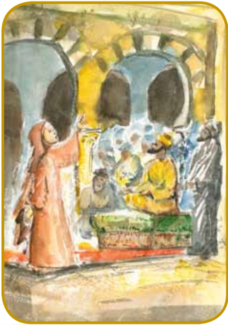
Sveta Evgenija tomači krščanjske vörške istine arabskoma kalifi - vmorili so go zavolo »špotanja islama«

Pred smrtjov se je spakivo na pod ednoga padaša, za en malo je daubo plüchnico in mogo lečiti v postelo. Vnaugi lidgé so ga gorpoiskali, de je pa nikšo pomauč nej vzeu. Za slobaud so ma pojbičke zaspejvali pesem »Mati je dreselna stala«, mrau je 23. marciüša. Pokopali so ga s