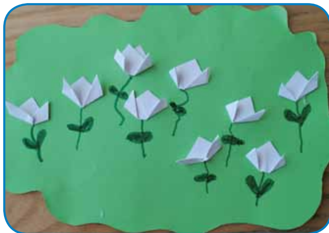
Sebestyén Papp, 5 let, vrtec Sakalovci