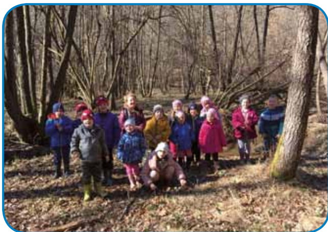
Sakalovski malčki v gozdu