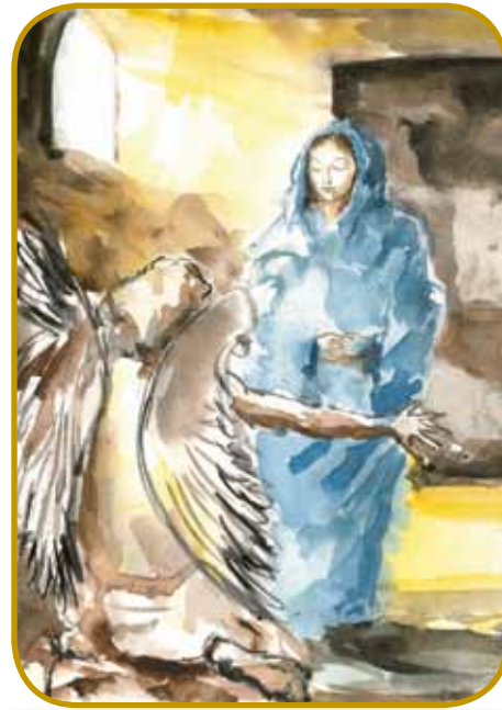
»Je angeu Gospaudov oznano Mariji in ona spočela od svetoga Düha« - radi spejvamo v naši cerkvaj tö