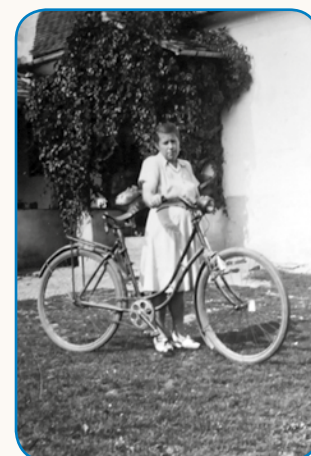
Biciklin je na brejgi ... stran 4