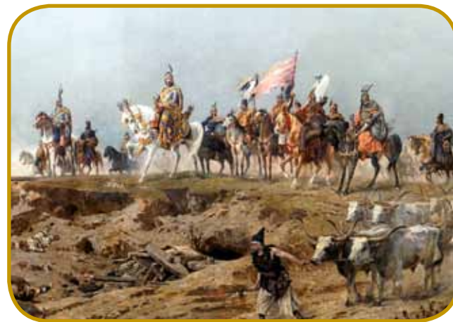
Krožni kejp Árpáda Fesztya v Ópusztaszeri - vojvoda Árpáda je molar namalo po sebi, šamana pa po svojoj ženi

Gda se pelamo prauti mejnoma prehodi v Nagylaki , se nam splača staviti pri ednom posebnom zgodovinskem spomeniki: 6 kilomejterov od vési Apátfalva stogi veuki kameni malteški križ, šteroga so prej vösklesali v spomin krala Ladislava Ku-