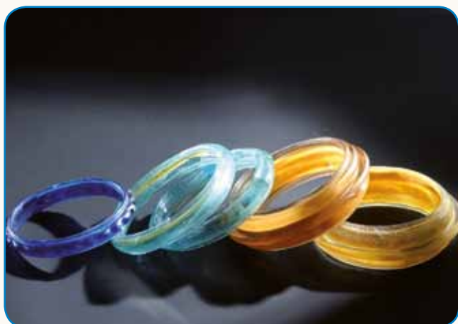
STEKLO NA SLOVENSkih TLEH stran 3