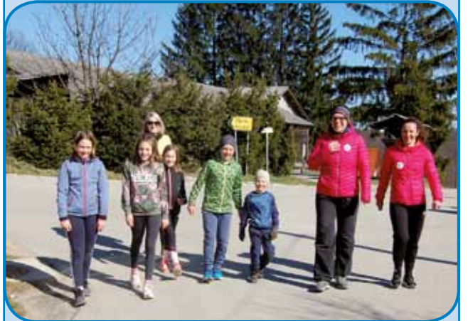
Pohod do Piramide po vinogradniški pokrajini nad Lendavo

Piramida se imenuje najvišji vrh v Lendavskih in Dolgovaških gorcah, do katerega se radi podajo rekreativci in športniki iz Lendave in od drugod. Vrh se tako imenuje po kam-