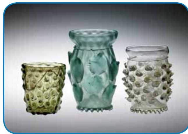
Ljubljanske steklarne, 16. stol

glavice; pri tem pa gre za izjemne filigranske izdelke, ki so nastajali v obdobju 1. tisočletja pr. n. št. Sijajne so bile tudi stekleničke posebnih amforskih oblik iz 5. in 6. st. pr. n. št., saj le-te spominjajo na tiste iz stare Grčije in Egipta. Tovrstni zelo tanki in prosojni primeri so se pri nas nahajali v