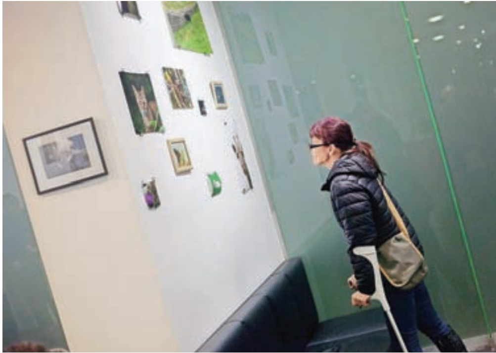
Razstava Foto kluba Kamnik je v domu kulture na ogled do konca leta

»Največkrat se je skupinsko poseganje v fotografije iz-