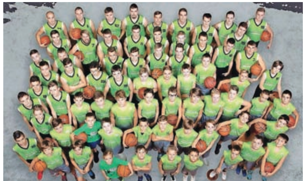
Kamniški košarkarji

Kamnik – Po nizu slabših predstav, ki so se vse končale s porazom, so nasprotnikom podarili tri zmage. Po rezultatih sodeč je bil sv. Nikolaj oziroma Miklavž radodaren do vsakega nasprotnika, ki je v zadnjem času stopil v kamniško dvorano. Vendar, če postavimo šalo na stran, je treba pohvaliti naše košarkarje za izredno borbena igro. Velika želja po zmagi se je pokazala tudi na igrišču, saj sta se zadnji dve tekmi odločali v zadnjih sekundah tekme. Žal je našim fantom ponovno zmanjkalo kanček še kako potrebne sreče, ki pride najbolj prav v takšnih trenutkih. Poškodbe so poskrbele za odsotnost petih košarkarjev, kar je močno zdesetkalo kamniško klop ter vplivalo na razplet tekme. Velik udarec je povzročila tudi odsotnost