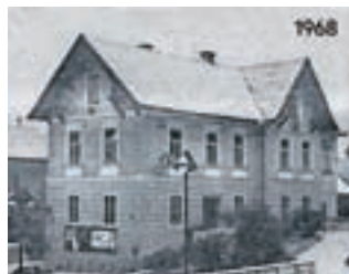
Stavba stare knjižnice skozi čas

Že nekaj let z nejevoljo opazujem pročelje stare kamniške knjižnice na Kolodvorski 2. Iz meni neznanih vzrokov je lastnik pohitel z odstranitvijo vsega okrasja, štukatur in podobnega z objekta, ne da bi to nadomestil z novim, kar se mi zdi nedopustno. To »oskubljeno kokoš« tako gledamo že nekaj let. Že samo dejstvo, da fasade ne nameravajo obnoviti, ampak jo bodo »zamenjali«, me preseneča, navažno odgovorni niso tako milostni pri dajanju soglasij. Ampak nisem strokovnjak in se v to ne spuščam. Morda so nove direktive na pohodu. Da pa objekt, ki ima očitno gradbeno