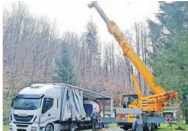
Nove nosilne vrvi na dveh kolutih po dvajset ton so v ponedeljek pripeljali iz Avstrije.

planino. Čeprav je naša družba zgolj upravljavec žičniških naprav in imamo po zakonu pravico do štiridesetih delovnih dni letnega remonta, se te dni zelo trudimo najti rešitev za alternativne prevoze. A razumeti je treba, da sem kot direktor dolžen skrbeti za dobrobit družbe, ne za dobrobit posameznikov, ki imajo tam svoje turistične kočje in jih oddajajo,« še pravi.