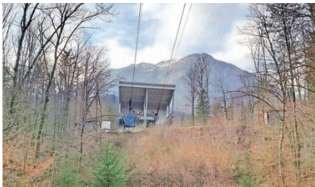
Nihalka na Veliko planino od 3. decembra ne vozi, tako pa bo predvidoma še vsaj mesec dni.

Rezultati pregleda so bili nenačrtovan dogodek, ki je presenetil tako vodstvo družbe in zaposlene kot tudi preglednike iz ZAG-a, nam je v uvodu pojasnil direktor in zatrdil, da nikakor ne velja, da na menjavo vrvi niso bili pripravljeni. Ne nazadnje se je že ob nakupu nosilnih vrvi pred dvajseti-