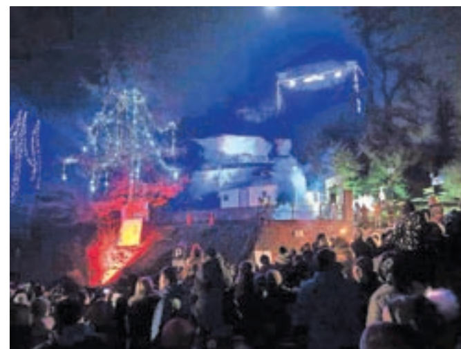
Osrednje kamniško Miklavževanje na pobočju Malega gradu