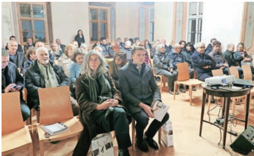
Nova knjiga je med Kamničani pričakovano naletela na veliko zanimanja.

Kamnik – Akcija Luč miru iz Betlehema že več kot tri desetletja prinaša upanje ljudem po vsem svetu, da pride tudi v občino Kamnik, pa skrbijo kamniški skvti. Letos so jo prinesli z Dunaja in jo v sredo, 18. decembra, pred sejo občinskega sveta prinesli tudi na občino. Prebrali so tudi poslaničnik, katere geslo je letos Ne boj se goreti! J. P.