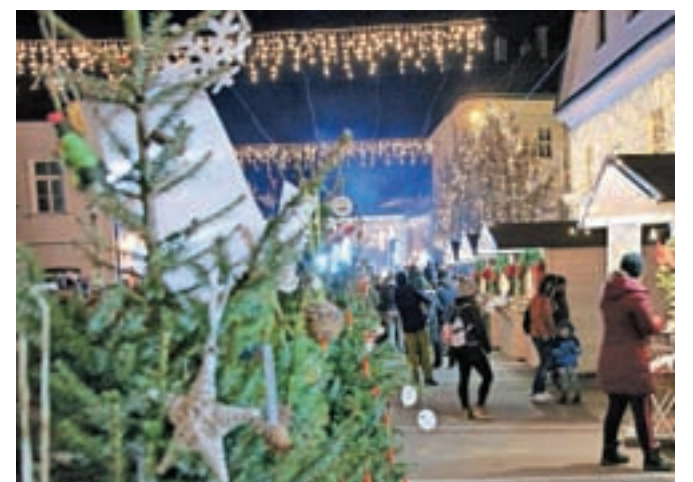
Središče Kamnika je te dni mesto za druženje, kulturne in glasbene dogodke ter praznične nakupe.

Leto bodo Kamničani in številni drugi obiskovalci zaključili s tradicionalnim silvestrovanjem na prostem, ki bo znova na Glav-