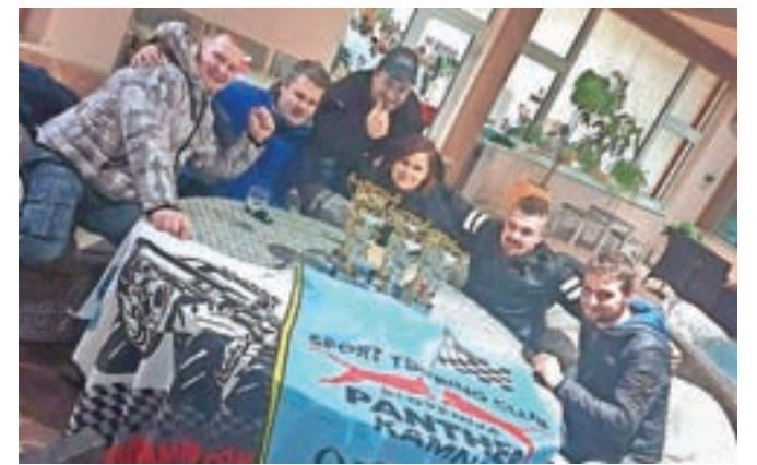
Tekmovalci kluba STC Panther Kamnik

Člani kluba STC Panther Kamnik so osvojili naslov državnih prvakov v off roadu za leto 2019.