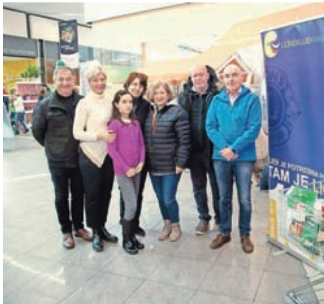
Del ekipe kamniških Lionsov, ki so pomagali na letošnji dobrodelni stojnici