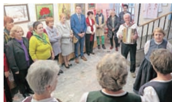
Na odprtju razstave vezenin v tehniki rišelj