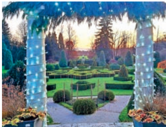
Okrašeni francoski park v Arboretumu

Volčji Potok – Na tisoče novoletnih lučk je decembra zažarel tudi v parku Arboretum. Razsvetljena pot se začne v drevoredu, od koder soj lučk vabi v francoski vrt. Za prijetnejše zimske sprehode so priljubljeno razstavo cvetličnih iluzij predstavili v šotor, vsak dan med 17. in 19. uro pa bodo ob šotoru na voljo tudi topli napitki. Arboretum bo do 5. januarja odprt vsak dan do 19. ure, z izjemo božičnega in silvestrskega večera. J. P.