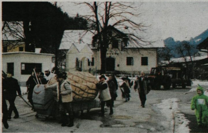
Motniški polž se je takole podal na pot iz Motnika proti Vranskemu.

ga in občine Vransko - velika črna vrana je lačno odpirala svoj kljun. Dve kozi in ena »koza« so iskali prostor za »kuple-raj« (tega v Kamniku že desetletja išče Temni valček). Predstavili so se lukovski rokavnjaci, pa francoski vojaki z zajetim rokavnjajem. Iz prazgodovinskega gozda se je prikazal pračlovek. Po cesti se je sprehaljal ginekolog Špička. Na starinskem kolesu, kjer je zadnje kolo precej večjega premera kot prednje, se je vozil gospod s cilin-