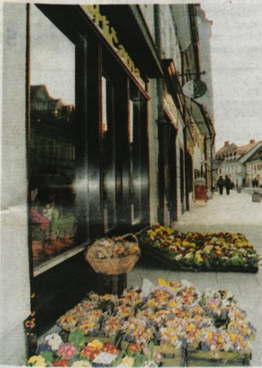
Za pomladansko podobo šotne poskrbi edino vrtnar Letnar s svojimi trobenticami in mačehami, o kakšnem cvetju v betonskih cvetličnih koritih pa še ni nobenega duha ...