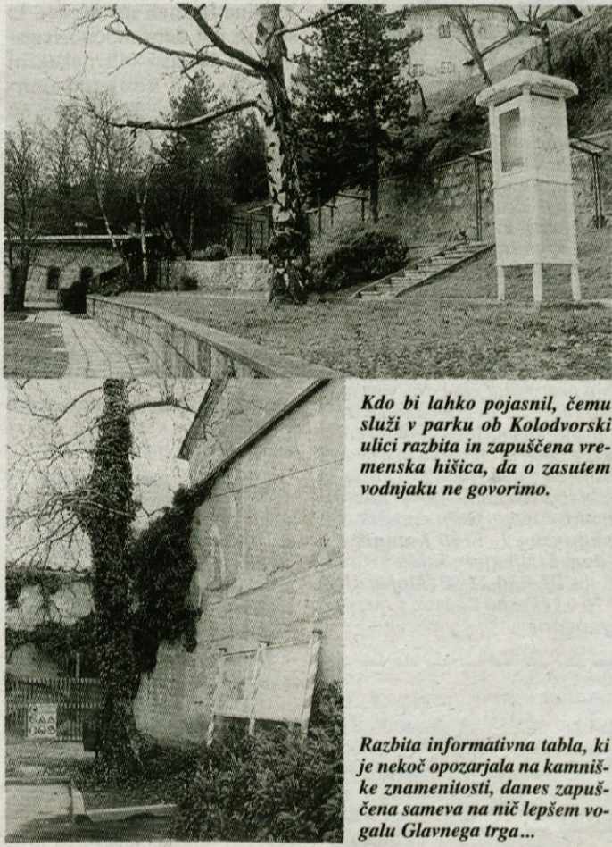
Kdo bi lahko pojasnil, čemu služi v parku ob Kolodvorski ulici razbita in zapuščena vremenska hišica, da o zasutem vodnjaku ne govorimo.