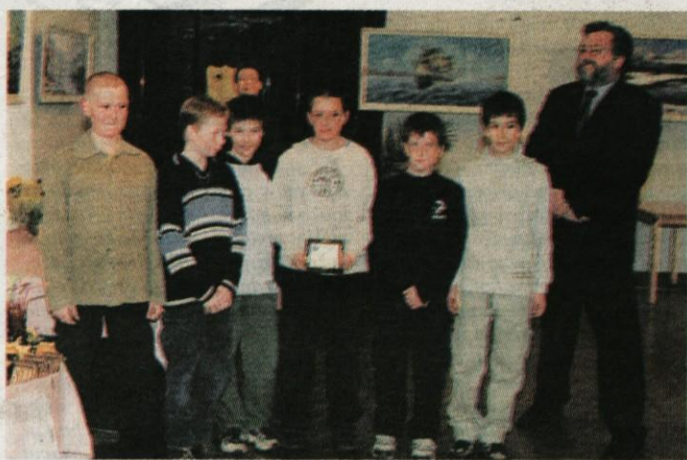
Ekipa mlajših dečkov OŠ Frana Albrehta