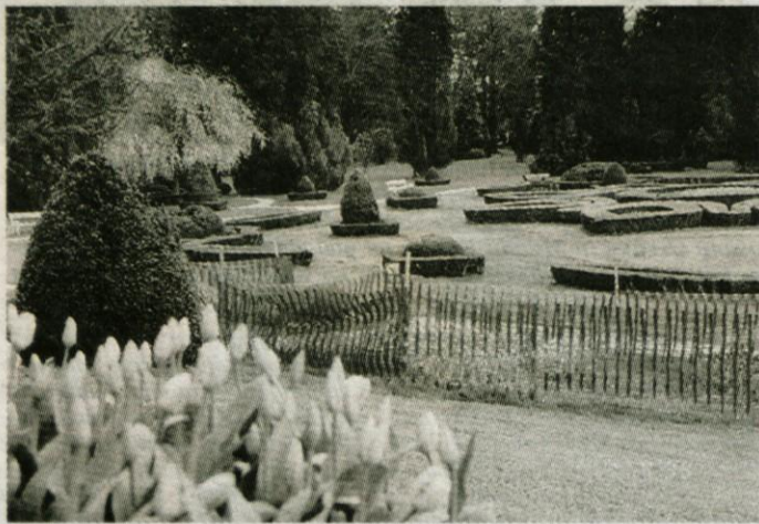
Denacionalizacijski zahtevek v zvezi z Arboretumom Volčji Potok je v pristojnosti reševanja Ministrstva za kulturo, saj je vlada v oktobru leta 1999 Arboretum razglasila za kulturni spomenik državnega pomena.

Postopoma bo tako tudi problematika izvajanja Zakona o denacionalizaciji dočkala svetlejšo plat. SAŠA MEJAČ