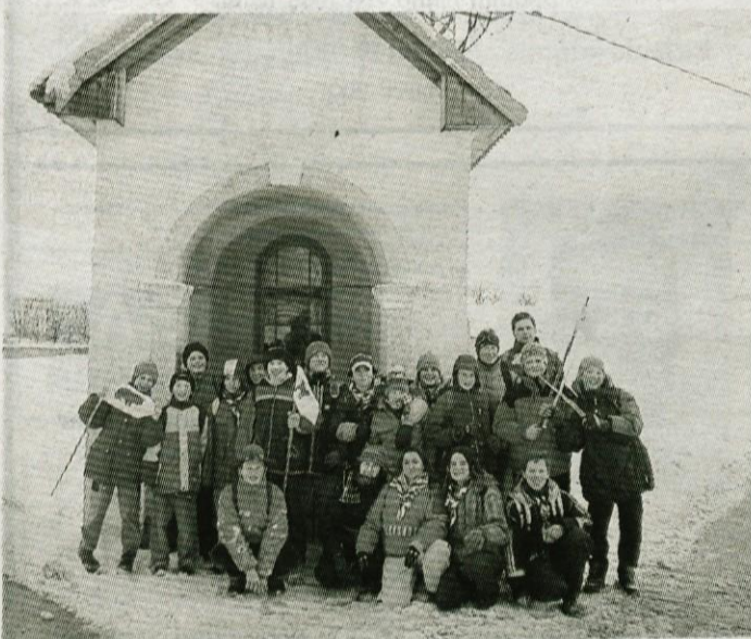
...in naj bo križ ob poti kakor srečanje s prijateljem (iz skavtske molitve)

ra Ogrinec. Za olimpijskim ognjem smo tekli proti cerkvi, v bližini katere so se igre tudi pričele. Vsakič smo tekmovali po vodih. Prva igra je bila teritorialna s spretnostjo reagiranja, sledila je kraja rutice, kjer smo se po dva in dva spoprijeli v teku. Čisto na koncu pa je bil še lov na lisico, ki je potekal v gozdu. Drugi dan smo med pohodom imeli igro zadani predmet, ko smo morali kolega z zavezanimi očmi usmerjati do predmeta. Po popoldanski sveti maši pa smo imeli v jedilnici še vsestranski kviz. Zadnji dan zimovanja pa je bila velika igra. Vsak si je okrog glave zavezal trak s štirimestno številko. Nasprotnik ni smel videti tvoje številke, tvoja naloga pa je bila videti nasprotnikovo. Lahko si se s celom naslonil na drevo, nisi pa si je smel pokriti z rokami. V skupni seštevek zbranih točk je šlo tudi jutranje ocenjevanje pospravljenosti sob. Na koncu smo olimpijsko zmago slavili medvedi.