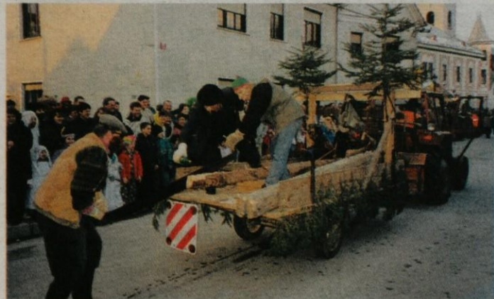
Motniški gozdarji in tesarji na pustnem karnevalu na Vranskem.

videli nekaj res izvornih mask. Gasilci z Ločice so predstavili najhitrejši in najmodernejši gasilsko vozilo - helikopter s špricanjem na eno cev. Simbol tr-