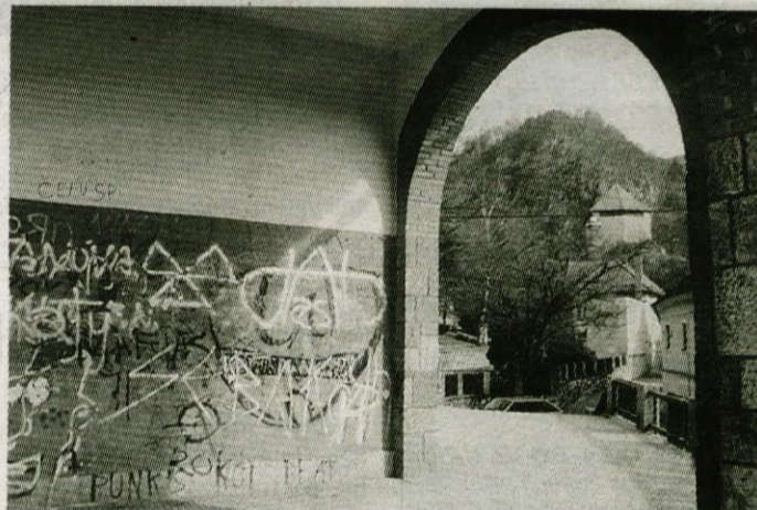
Takole »okrašena« sprejema izletnika kamniška postaja, ki že zdavnaj ne opravlja več svoje prvotne naloge.