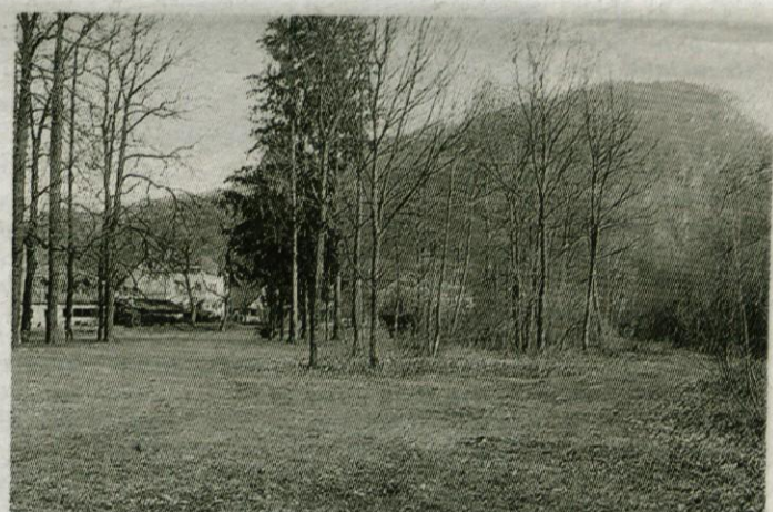
Nekoč znameniti Kršmančev park ob Bistrici so občudovali turisti, ki so se zdravili v bližnjem Kurhausu, danes pa je pozabljen in zaraščen...