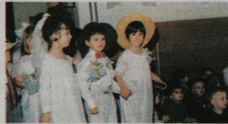
Nevesta in ženin s pričo na poti proti oltarju ...

Iz lanskoletne spontane odločitve medvedkov, da se poročita medvedek in medvedka, se je letos razvila velika zabava, na kateri se je poročilo šest medvedjih parov, rajalo pa veliko malih gostov. Štiriindvajset medvedkov in medvedk se je s pomočjo Mame medvedke Renate in Velike sestre medvedke Nataše že mnogo prej lotilo priprav na veliki svečani dogodek, tako kot je običaj pri velikih medvedkih. Doma so zbirali primerne poročne in svatovske obleke, počasi so si dvorili in iskali primerne partnerja, nato napisali poročno vabilo vsem prijateljem in staršem, pripravili po-