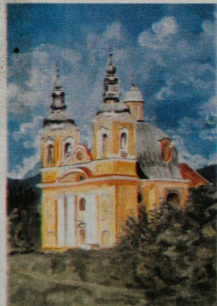
Tunjiska cerkev - tempera, iz leta 2000