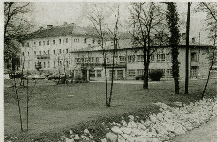
Na področju denacionalizacije stavb in stavbnih zemljišč Upravna enota Kamnik še ni odločila le v zahtevku glede Delavskega doma na Cankarjevi cesti, ki pa je že v reševanju.

Veljavnost starih potnih listov se izteče 5. avgusta 2002 , tako, da imajo imetniki dovolj časa, da jih zamenujejo. Ob tem potrebujejo poleg vloge še novo fotografijo in seveda denar. Odločili se bodo lah-