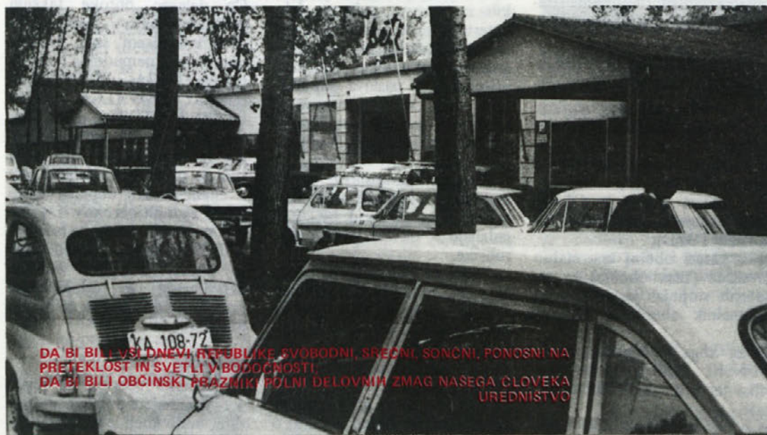
DA BI BILI VSI DNEVI REPUBLIKE SVOBODNI, SREČNI, SONČNI, PONOSNI NA PRETEKLOST IN SVETLI V BODOČNOSTI! DA BI BILI OBČINSKI PRAZNIK POLNI DELOVNIH ZMAG NAŠEGA ČLOVEKA UREDNIŠTVO