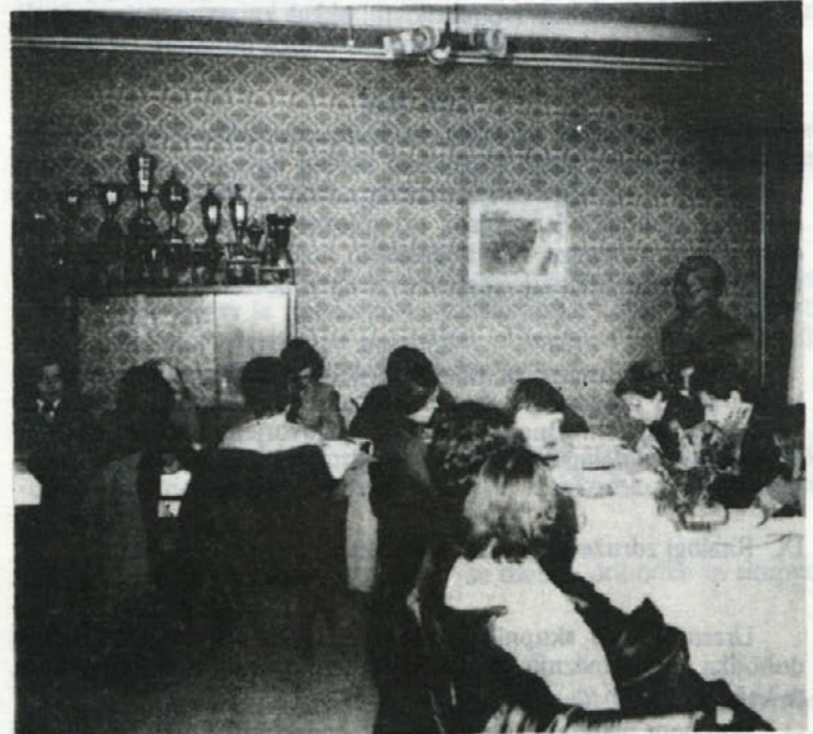
KONFERENCE — Te dni so potekale konference osnovnih organizacij Zveze komunistov, na katerih so komunisti Beti kritično ocenili delo v preteklosti, izvolili nove sekretarje in si zadali naloge za v bodoče. Vsebinsko so bile konference zelo bogate.