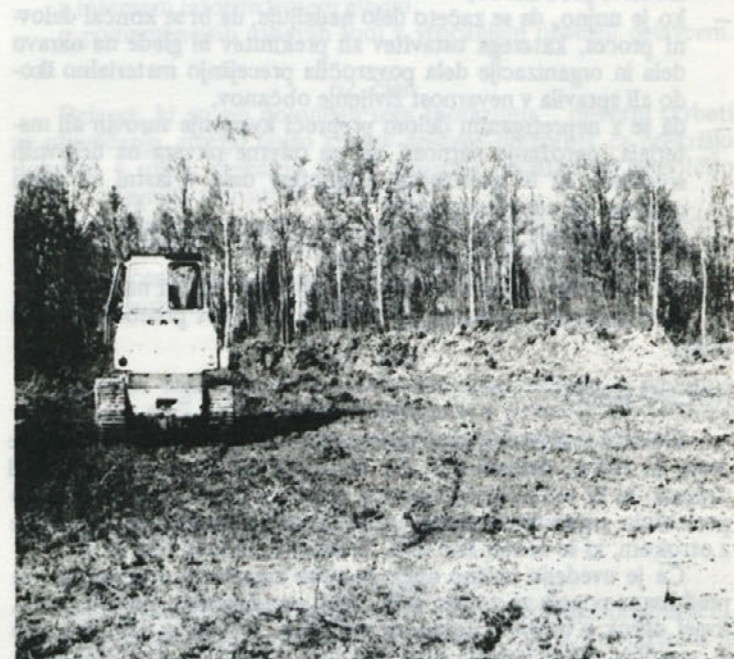
NOVOGRADNJA – V Žakanju, nedaleč od Jurovskega broda, je buldožer v začetku novembra odstranil plast zemlje, na kateri bo zrasla konfekcijska hala. Približno sto ljudi bo našlo zasluzek, investitor novogradnje je Beti. O zidavi bomo še poročali.

Delovno razmerje lahko sklene vsak, kdor izpolnjuje pogoje, ki jih določijo delavci v temeljni organizaciji glede na potrebe delovnega procesa, v skladu s katalogom nalog in obveznosti na način, kot jih določa zakon.