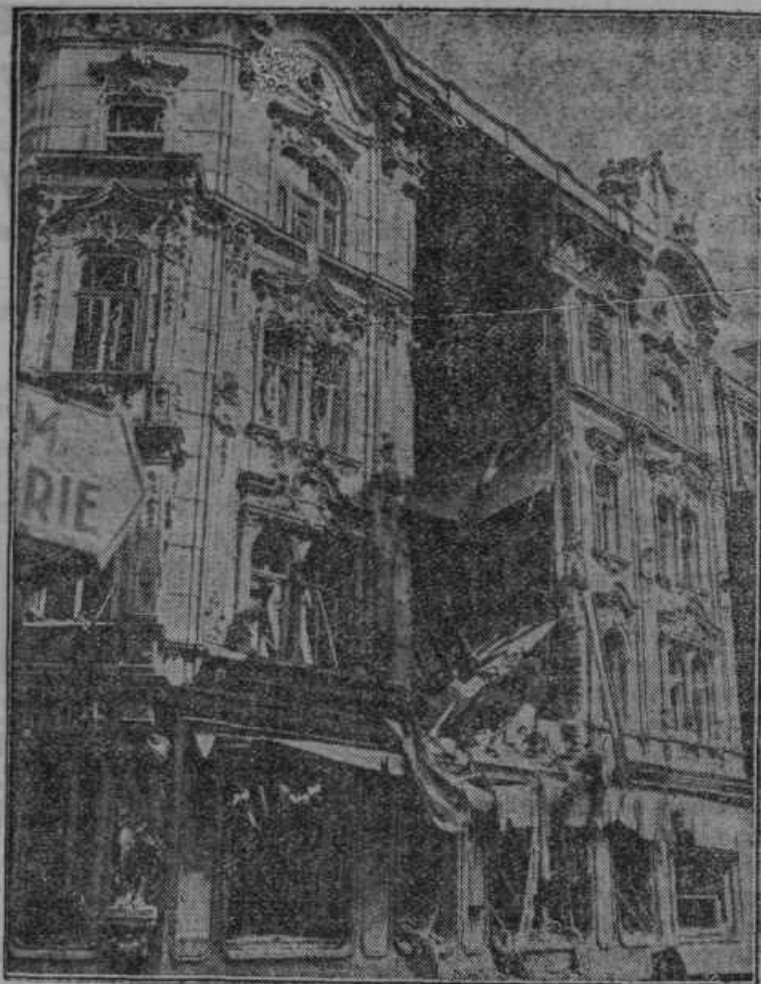
Dinamitna eksplozija v Brnu je zahtevala 7 smrtnih žrtev.