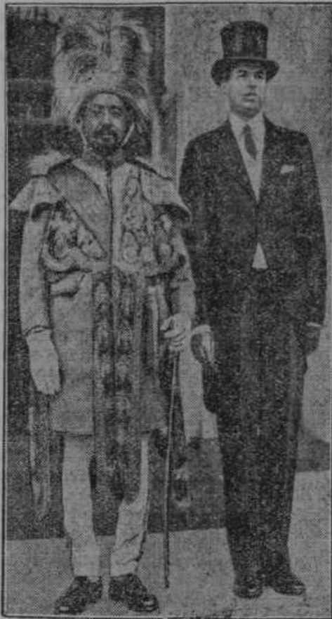
Abesinski princ prinaša v spremstvu pritočnika ameriškega, predsednika Rooseveltu pozdrave cesarja Abesinije (v vzhodni Afriki.)

ni ostala neprizadeta niti ena trgovina in so uničene tudi vse zaloge blaga. Nad 10.000 prebivalcev je izgubilo vse svoje imetje. Med prebivalstvom vlada silna žalost in potrto. Mnogi so izvršili samomor. Koliko človeških žrtev je zahtevala nesreča, se še ni dalo ugotoviti. Do sedaj pogrešajo okrog 100 ljudi.