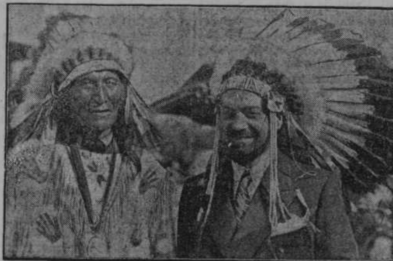
Italijanski letalski minister Balbo je obiskal s 23 vodnimi letali svetovno razstavo v Čikagi. Počastitev ministra s slavnostnim pokrivalom poglavarja Sioux-Indijancev.