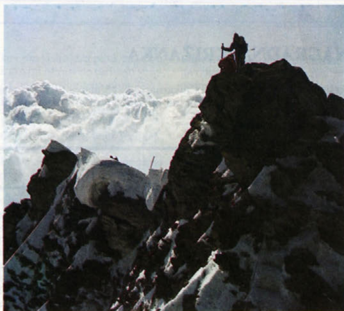
Vzpon na Grossglockner leta 1983

dolini za otroke cinkarniških delavcev. Vsi, ki bi želeli poslati otroke na planinski tabor, naj se prijavijo najkasneje do konca meseca marca predsedniku planinske sekcije. V poštev pridejo otroci od 4-8 razreda osnovne šole. Tabor se bo organiziral, če bo dovolj prijav. Vse podrobnejše informacije boste dobili ob prijavi oz. sestanku s starši, ki bo sklican po zaključnih prijavah.