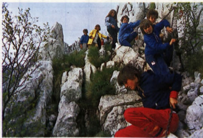
Spust z Nanosa

pač pa vas bomo o dnevu izleta pravočasno obvestili s plakati ali pa v Informatorju.