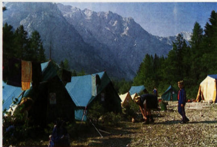
Tabor planincev pionirjev v Logarski dolini

Za planinstvo, ki se odvija v netekmovalnih oblikah, na prostem v naravnem okolju in ob različnih vremenskih pogojih, udeleženci izletov ne dobijo priznanj, potrebnih rekvizitov in ostalih oblačil, temveč se sredstva rabijo za drage prevoze do vznožja gora. Minimalna sredstva pa za izobraževanje in obnavljanje tečajev planinskih vodnikov, ki vodijo izlete.