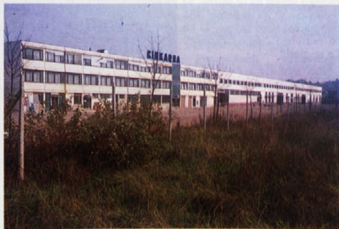
V novem poslovno blagovnem centru Cinkarne so DE Marketing, posebna finančna služba ter skladišče, ki si počasi utira pot k novi organizaciji.