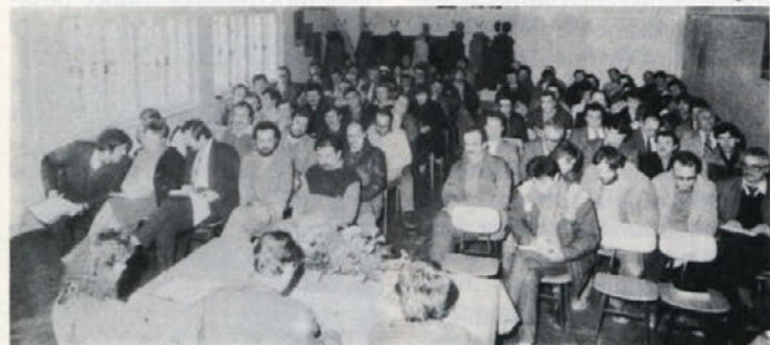
Komunisti, zbrani na akcijski konferenci