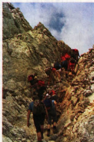
Čez RŽ na Triglav