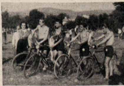
„... jezdili so svoje „konjičke“, da je bilo veselje...“

Po kratki toda živahni diskusiji je tovariš Rado prečital pravila Slovenske fizikulture zveze in jih dal na glasovanje; vsi navzoči so jih soglasno sprejeli. Nato so delegati na podlagi pravil sklepali tudi o vseh drugih vprašanjih, med drugimi je občni zbor sprejel v Slovensko fizikulture zvezo vseh devet že obstoječih in uradno priznanih Slovenskih fiz-