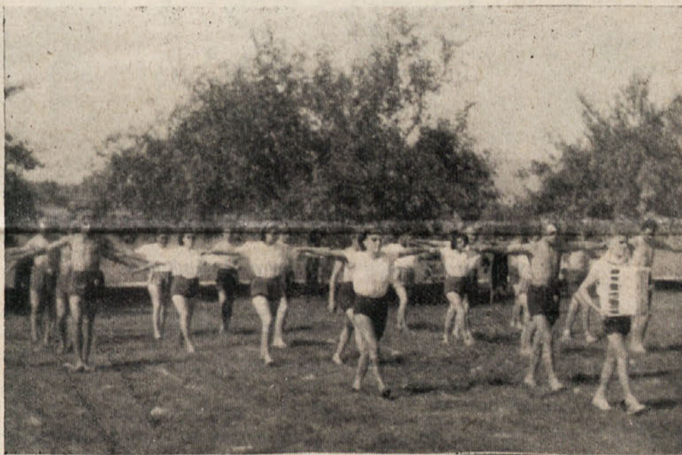
Živahen je bil nastop fizikalnikov

gočila, da se naša mladina šola v svobodni Jugoslaviji, in nikdar več se ne bi zbirali na raznih naših prireditvah in tudi danes ne bi stali tukaj, če ne bi dnevno manifestirali in z delom dokazovali, da smo živ del slovenskega naroda in da ostanemo na Slovenskem Koroškem mi gospodarji.