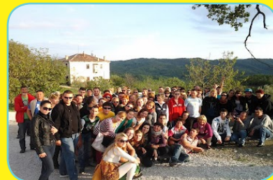
Še pozdrav poletju in prijateljem ter nasvidenje do 2013

Sledil je še zadnji pozdrav poletju in želja, da bomo tako uspešno sodelovali tudi v letu 2013 in se ponovno srečali s prijatelji v VIRC-u.