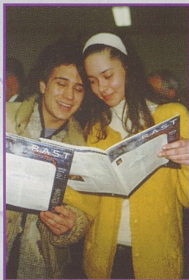
Nova Rast ugaja!

sledi, da vsak lahko tudi z majhnim dejanjem pripomore k izoblikovanju lastne prihodnosti v državi. Drugi tabor, tabor razočaranih, pa se v času, ko se volilna temperatura dviga, izogiba vsakega vmešavanja. Namišljena zavezništva, tajni sporazumi, motilne liste, barviti spori in prepiri, nesoglasja, bombne eksplozije, tipične italijanske polemike ter zagrizena zavzetost politikov, za katero ne vedo, ali gre za resnično osebno nagnjenje (glej grško 'πόλις') ali zgolj za stremljenje po denarnem dobičku, le poglobljajo njihovo neopredeljenost.