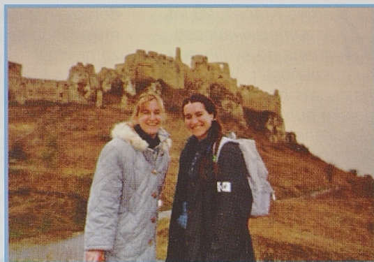
zgoraj: Špisški hrad – naša dekleta so opustošila Slovaško