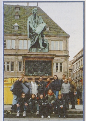
Odprava na trgu Gutenberg