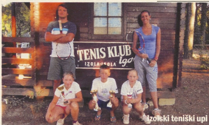
Izolski teniški upi