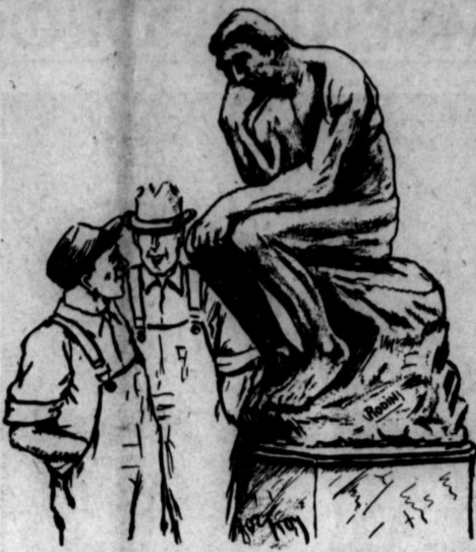
"VIDIŠ, to je spomenik Rodinovega misleca." "Da, ampak čemu ne bi bila tudi midva misleca?"