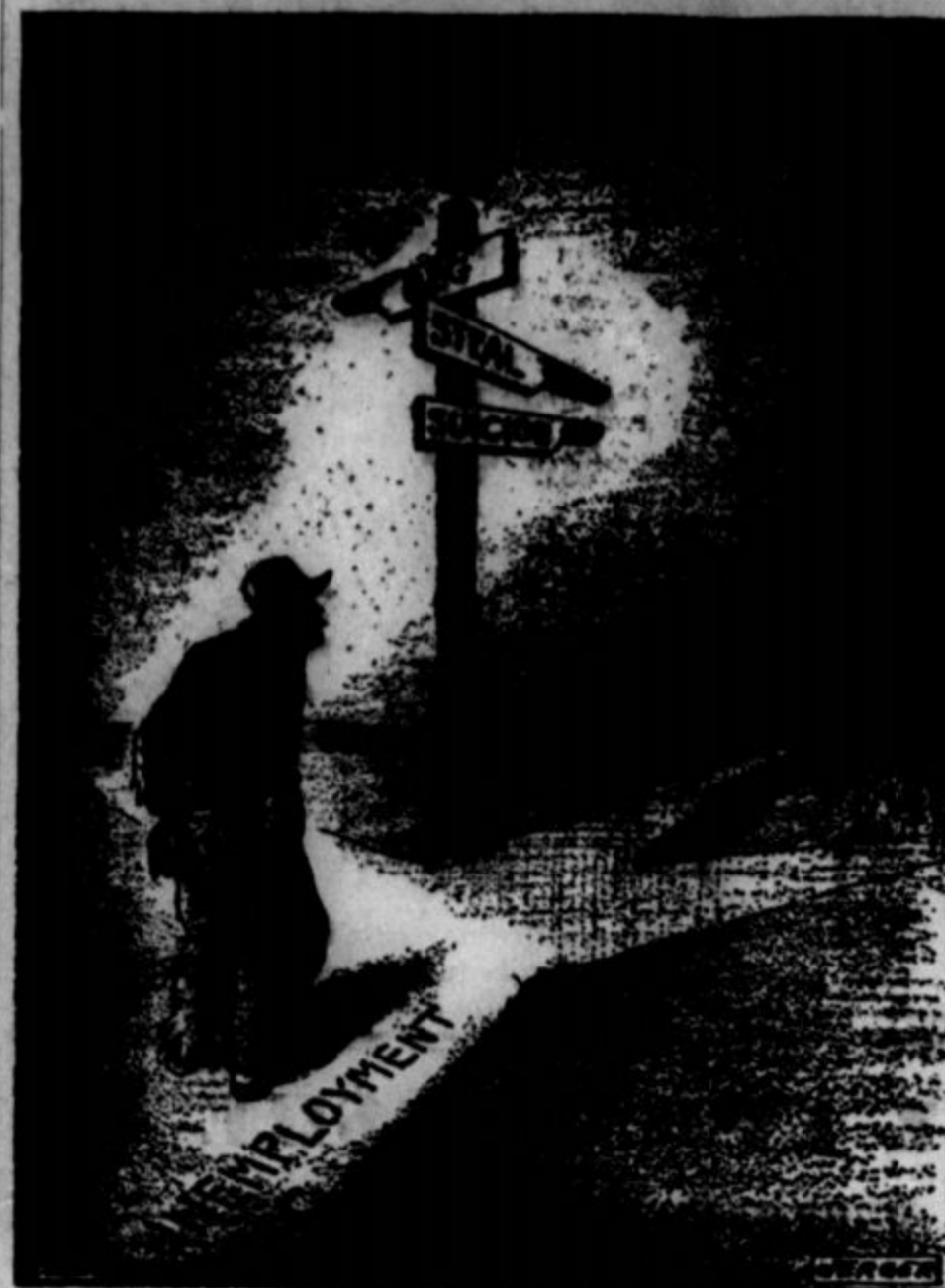
BREZPOSELNI — KAM? Nad tri milijone jih je že v deželi, kar se morda malo sliši — toda vprašajte posameznega brezposelnega, ki stika za delom, pa vam bo povedal, kako on misli o tem.

V dobah preobratov se mašuje vsako tako zamernjenje. Evropski vzhod je glasen dokaz, da ni neznanje zadosten ščit zoper revolucionarno navdušenje; ampak če postane nositeljica revolucije slabo izobražena masa, je naravno, da se razveže tisoč primitivnih občutkov in se gode