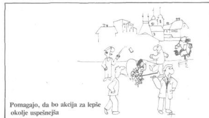
Pomagajo, da bo akcija za lepše okolje uspešnejša