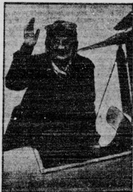
Angleška letalka Betty Kirby-Green je preletela 11.000 km dolgo progo med Londonom in južnim koncem Afrike v 46 urah in s tem dosegla čas, ki ga še nihče ni dosegel.

Hud potres je bil pretekli teden v sovjetskem Turkestanu.