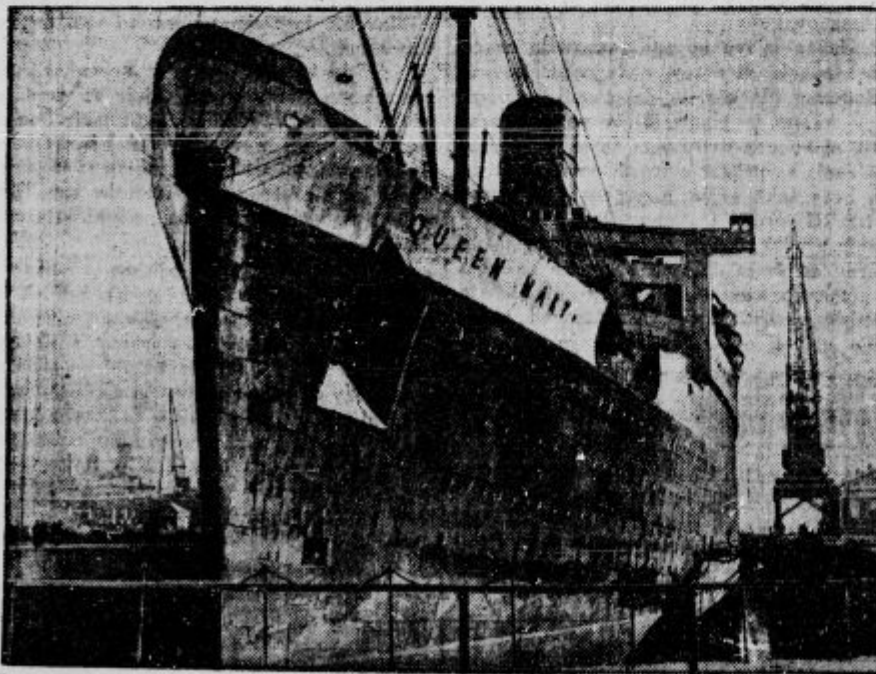
Največji parnik na svetu Queen Mary se viharji na zadnji voznji v Ameriko tako poskodovali, da ga sedaj v ladijedelnici temeljito popravljajo.

d Usmilite se sirot! Banska uprava oskrbuje in vzgaja v svojih zavodih in pri rejnicah na deželi znatno število otrok, ki so osiroteli, odnosno zapuščeni. V sedanjih razmerah je pričelo število teh malčkov tako naraščati, da bankski upravi ni mogoče več nuditi vsem tem sirotam potrebno oskrbo. V mnogih primerih želijo zakonci vseh slojev, ki sami nimajo otrok, pa tudi starejše samostojne osebe, sprejeti iz ljubezni kakega otroka po njihovi lastni izbihi v brezplačno oskrbo ali za svojega. Na te družine ali osebe se obrača banska uprava in jih prosi, da bi sprejeli katero teh sirot in ji nudili trajen dom, oskrbo in vzgojo in s tem nadomestili starše. Dobrotniki, ki bi bili pripravljeni sprejeti kakega teh otrok, naj sporočijo to potom svojih občin banovinskemu dečjemu domu v Ljubljani, Streliška ulica št. 14. V prijavah naj navedejo: Ime in priimek reflektantov, natančno bivališče, oddaljenost od kolodvora in šole, družinske, premoženjske,