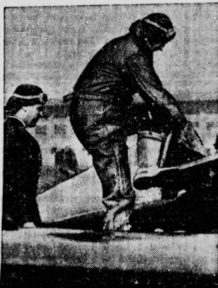
Predsednik republike Irske — De Valera — se je te dni prvič vozil v zrakoplovu nad svojo deželo. Pilotiral je znani letalec Lindberg, ki živi sedaj na Irskem.