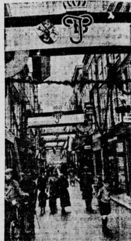
Nizozemska predstolonaslednica Julijana se bo v kratkem poročila. Da so ljudje s poroko zadovoljni, je videti iz tega, kako so lepo okrasili ulico glavne mesta za to slovesno priliko.

mu reče Peter ter mu prisoli z desnico krepko zaušnico čez levo uho, z levico pa čez desno. Ko se je neznanec opotekal, je skočil Peter s svojim suknjičem na kolo, ter se je odpeljal. Še enkrat se je ozrl nazaj, ko je neznanec upil, se pridušal in mahal s palico za njim; a Peter je bil pri svojem.