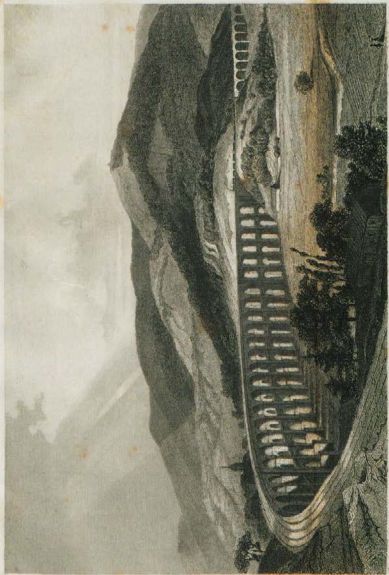
Wadst zu Franzenstorf