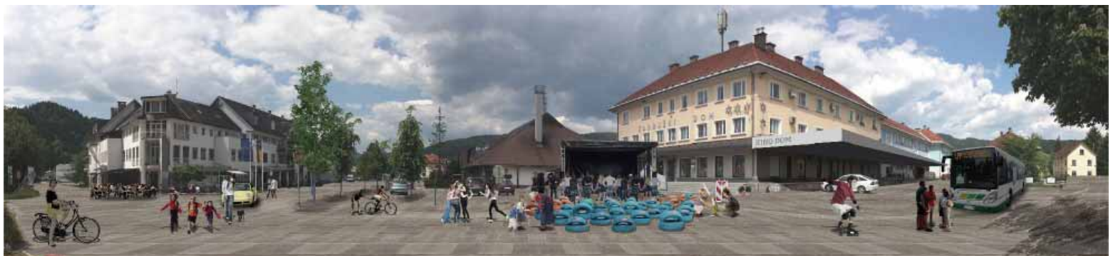
JEDRO KRAJA PO POSTOPNI TRANSFORMACIJI - prostor je namenjen dogodkom, tržnici, pešcem, kolesarjem, ter la delno avtomobilom.