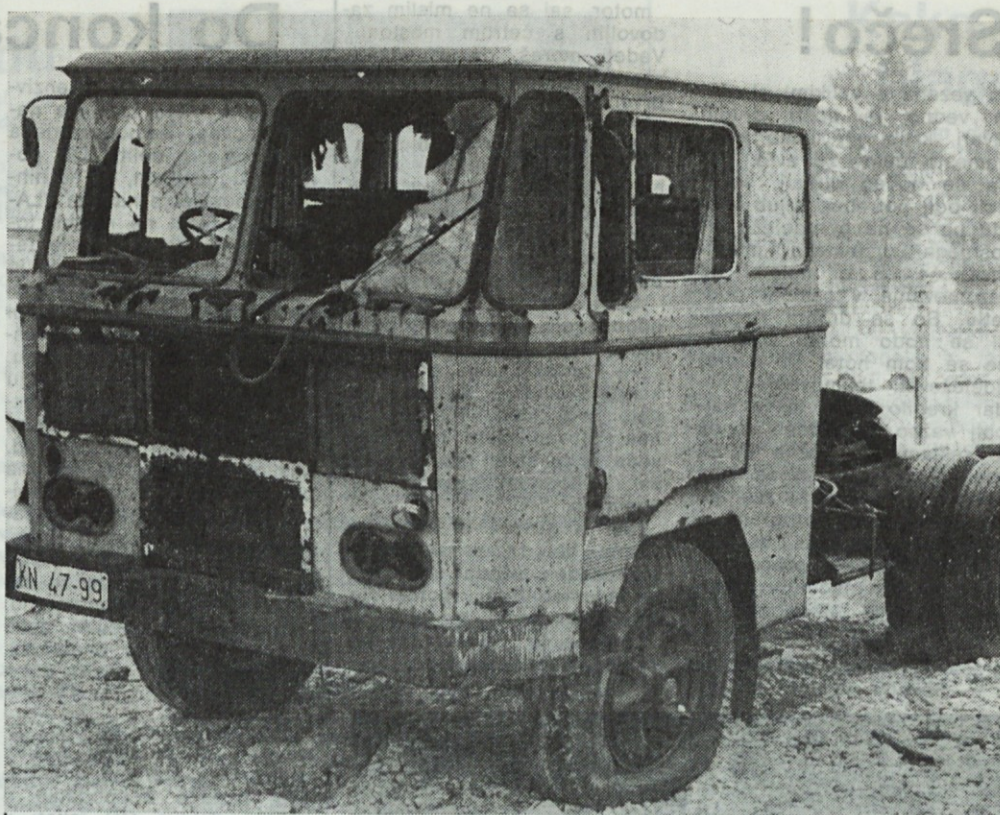
UGANKA: Povejte mi, ali stojim na Celovski 288 že 7 let kot »test avto«, ali kot »okrasni predmet«?