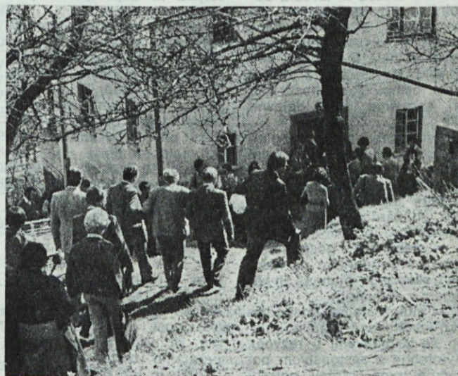
Še en posnetek s srečanja na Čebinah

NOVINARJI GLASIL V ZDRUŽENEM DELU, ZBRANI NA SREČANJU NA ČEBINAH. ČEBINE, 24. MARCA 1977.