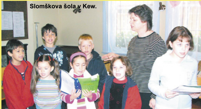
Slomškova šola v Kew.