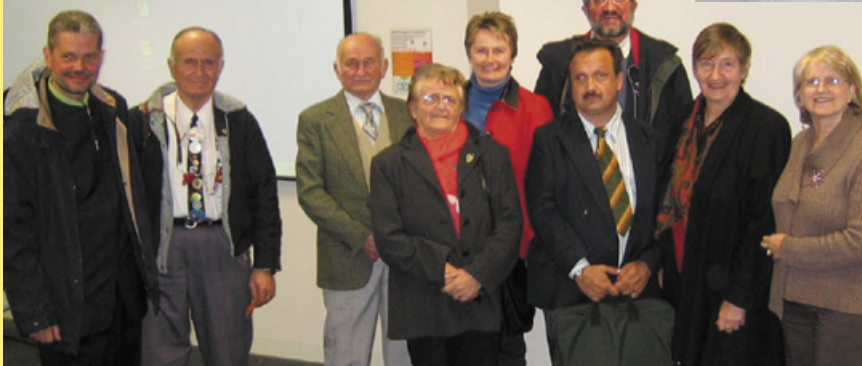
Po mednarodni konferenci na viktorijski univerzi.