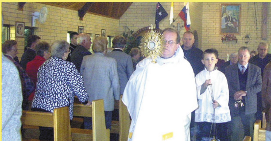
Procesija sv. Rešnjega Telesa in Krvi v Adelaidi.