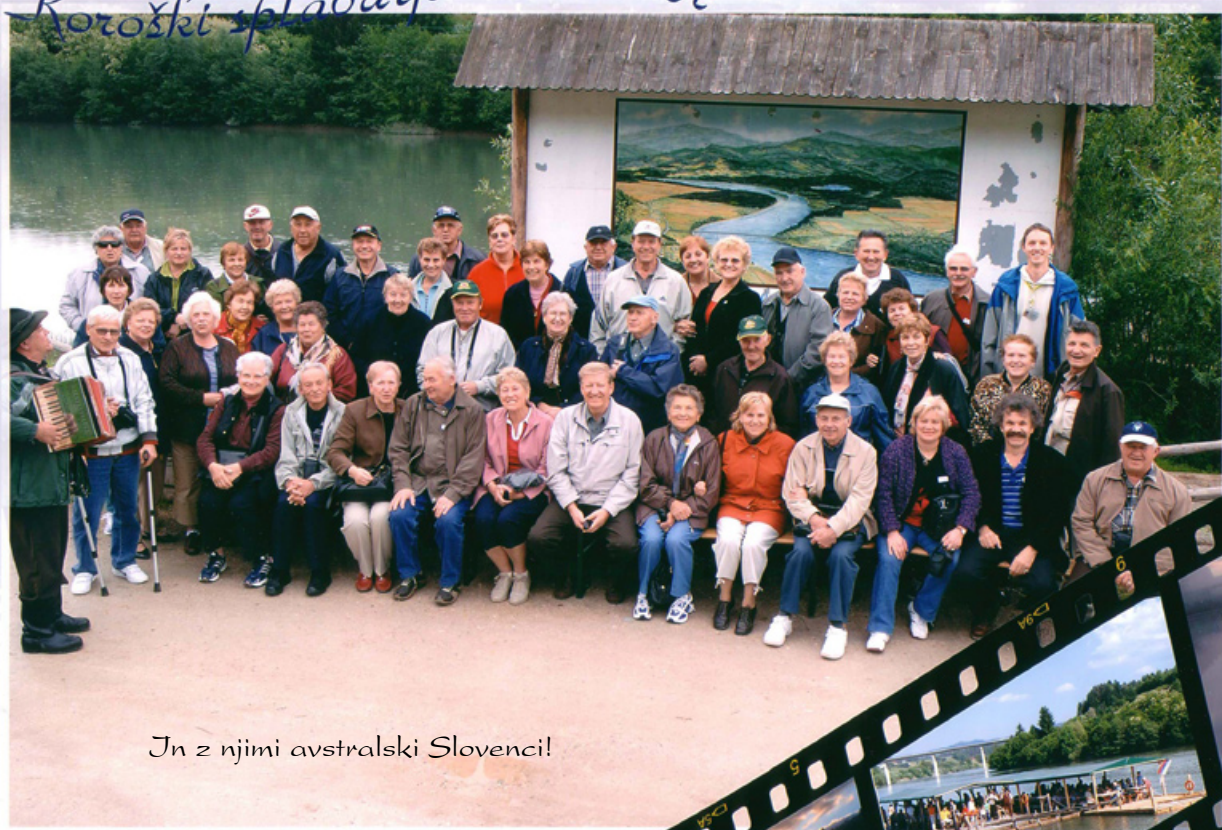
In z njimi avstralski Slovenci!