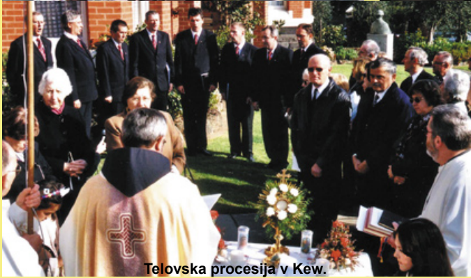
Telovska procesija v Kew.