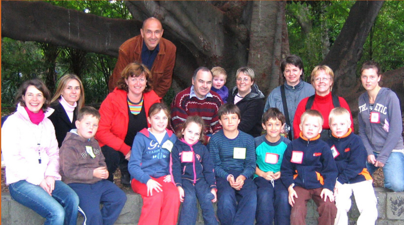
Otroci Slomškove šole iz Kew s starši in učiteljicami.