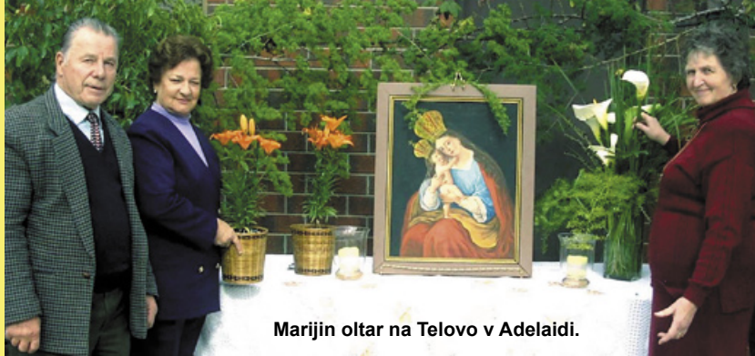
Marijin oltar na Telovo v Adelaidi.