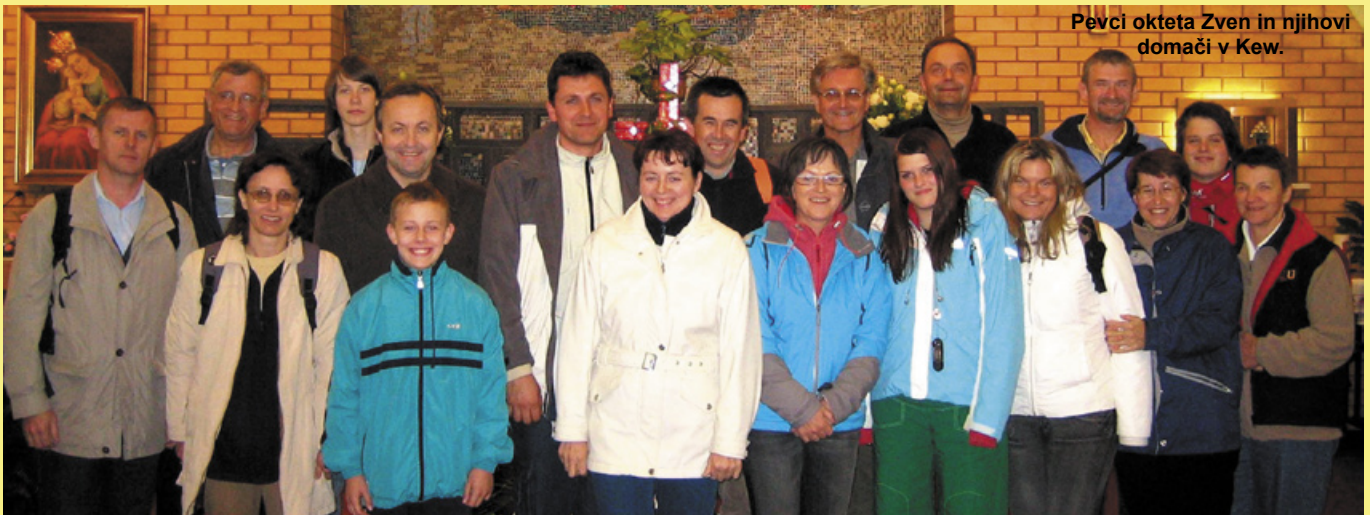
Pevci okteta Zven in njihovi domači v Kew.