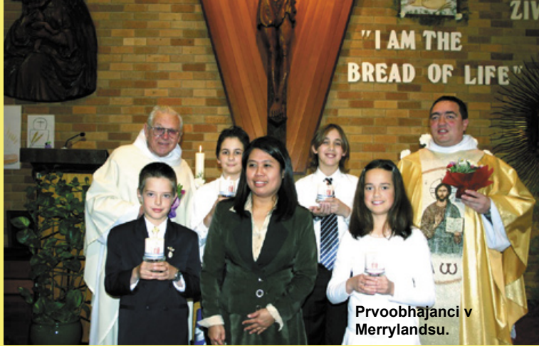
Prvoobhajanci v Merrylandsu.