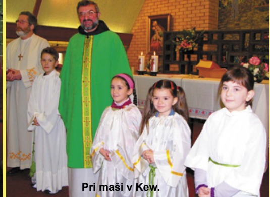
Pri maši v Kew.