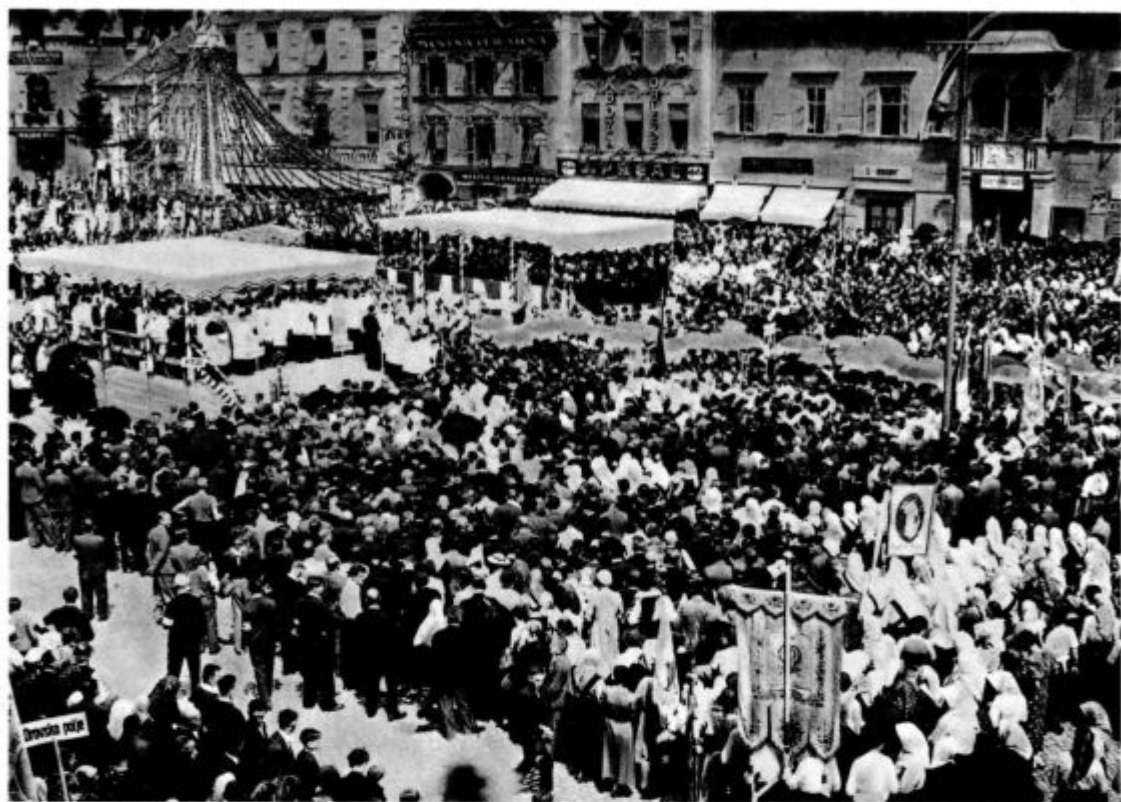
b) Sv. maša na glavnem trgu v Mariboru

njegovim sijajem in vablivo lepoto. Bogoslovci so se ločili od njega, kakor da so na otoku sredi mesta.