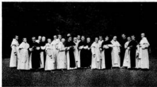
b) Samostanski bratje novinci v Slični

»Že od nekdanj se naša formula glasi: Promitto stabilitatem, conversionem morum meorum et oboedientiam secundum regulam s. Benedicti... obljubim stalnost, premenjenje