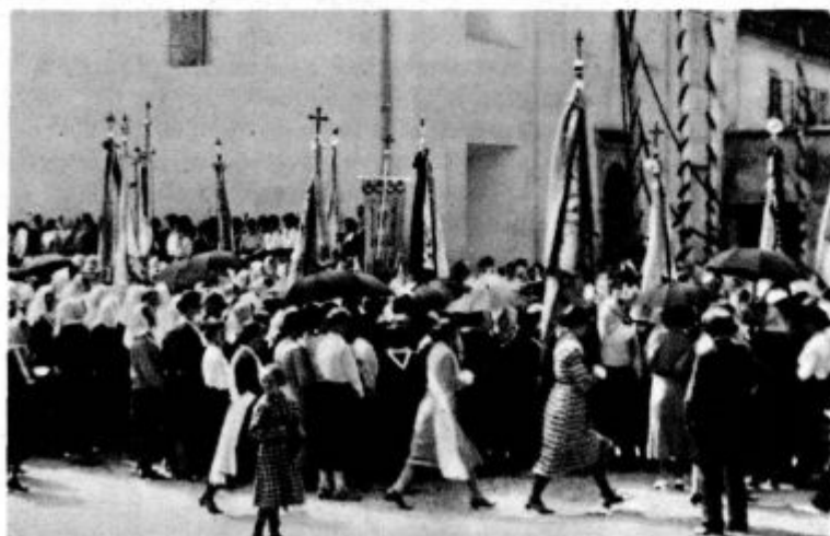
c) Svečanost Marijinih družb v Slični ob začetku 800 letnice. 4000 udeleženk

S kakim navdušenjem jih je pač sprejela krščanska občina! Kako je žarelo obličje škofu v sv. sreči, da se je čreda njegovih »svetih« pomnožila! Z vonljivim oljem jih je sedaj Kristusov namestnik pomazilil in svoje »božje otroke« odel v belo krstno oblačilo. — Tudi samostanski kandidat vstane k novemu življenju. Od člana do člana samostanske družine hiti, vsak ga prisrčno dviga k sebi in mu da poljub miru. Potem mu pa opat nadenene novo redovno obleko: bel habit in čezenj črn škapulir s pasom in na vse to belo krstno oblačilo.