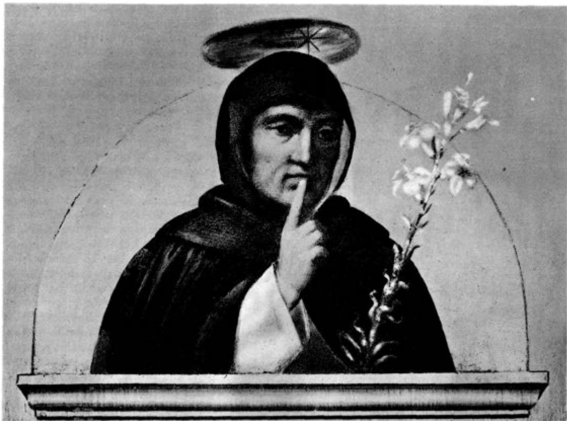
Sv. Dominik, 4. avgusta

Vse to bo doprineslo, da se bomo izkazali vredne domačega svetnika, ki naj ga nam nakloni božja dobrotljivost.