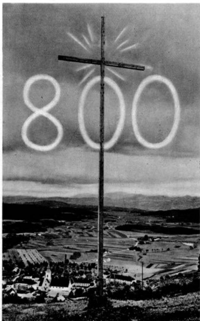
Za 800 letnico stiškega samostana: a) Slična z ehar. križem

veselega, ozkosrčnega. To je povsem zgrešeno pojmovanje! Vprav nasprotno je res! Mogel bi vam v pojasnilo navesti prav nazorno, moderno primeri! Ste vi gospod, morda turist?»