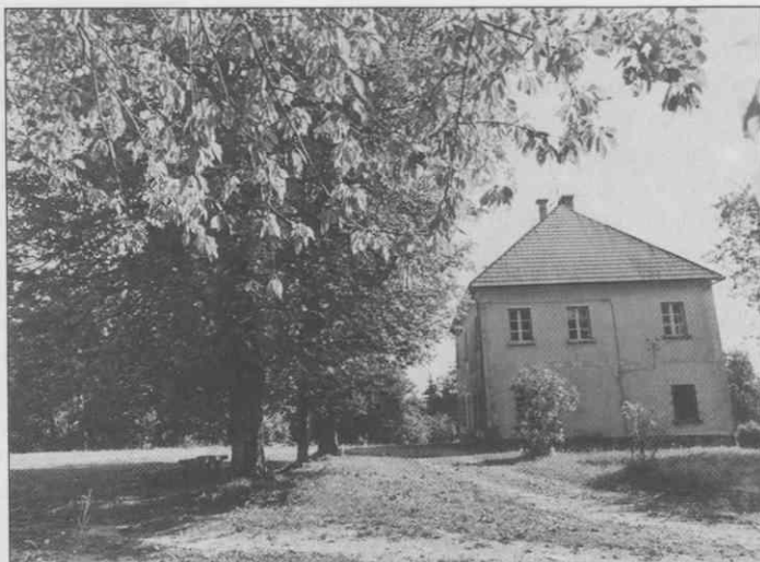
Zdihovo, ekspoziturna cerkev Matere Božje leta 1953 in leta 1993.

Oktober 1953 so prebivalci Zdihovega in okoliških vasi morali zapustiti svoje domove zaradi izgradnje podzemskih zaščitnih objektov v Škrlju. Naslednje leto so cerkev podrli.