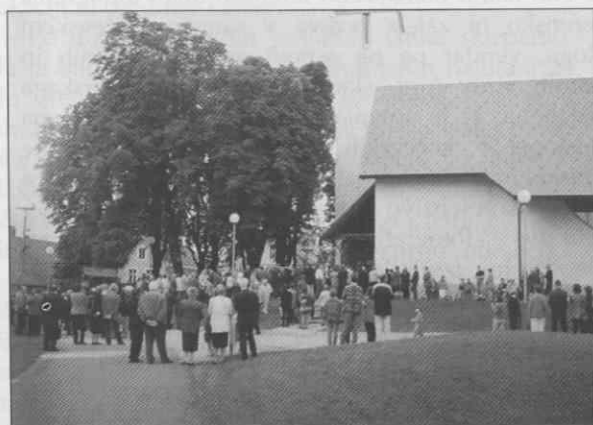
Kočevska Reka, župnijska cerkev sv. Janeza Krstnika leta 1948 (vir Muzej Kočevje), leta 1991 (foto in vir dr. Mitja Ferenc) in 20. junija 1999 (foto in vir dr. Mitja Ferenc).

Sinonim za načrtno rušenje sakralnih objektov na Kočevskem je porušenje župnijske cerkve v Kočevski Reki, januarja 1954. Novo cerkev, blagoslovljeno 20. junija 1999, je kot simbolni dolg države za številne med vojno in po vojni porušene sakralne objekte financirala tudi slovenska država.