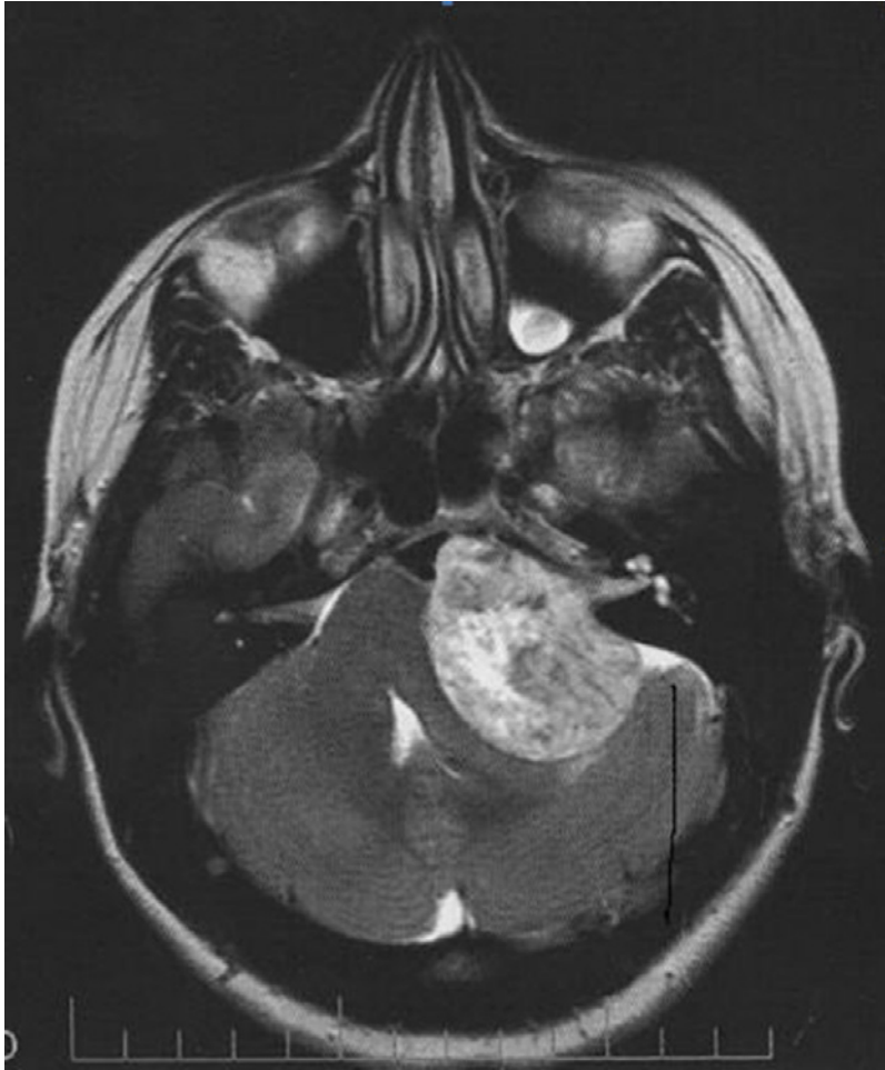
Slika 1: MR glave (dne 29. 7. 2011): infratentorialno je do 4,6 × 3,5 cm velik ekstraaksialen tumor s centrom v levem pontocerebelarnem kotu. Tumor sega tudi v medialni del levega notranjega sluhovoda, odrija pons in cerebelarne strukture proti desni strani.

kap, poškodba glave, intrakranialni tumorji, okužba živčevja z virusom herpes zoster ali simplex, degenerativne bolezni centralnega živčnega sistema ali pa vzrok ni znan. Tipično klinično sliko sestavljajo enostranske kožne razjede v obliki polmeseca, ki najpogosteje prizadenejo nosnice ( ala nasi ), lica in ustnice. Patogeneza teh trdovratnih razjed ni dobro raziskana. Vzroke pripisujejo nevrotrofičnim faktorjem in spremenjeni aktivnosti simpatikusa, glavno vlogo pa naj bi imela pacientova avtomanipulacija prizadetih mest. 1,2,3 V prispevku bomo predstavili primer bolnice, pri kateri se je po nevrokirurški odstranitvi gigantskega statoakustičnega nevrinoma pojavila enostranska razjeda levega nosnega krila. Boljše razumevanje tega sindroma bi omogočilo zgodnjo prepoznavo in ustrezno zdravljenje bolnikov.