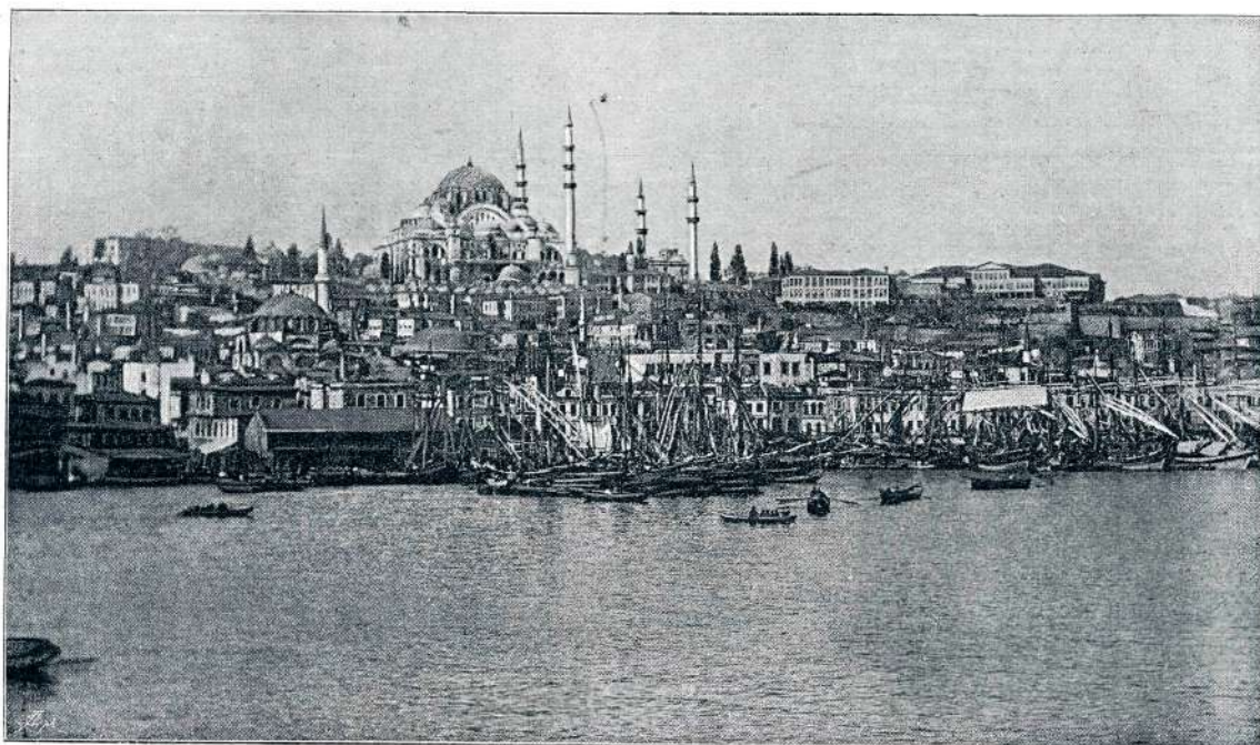
POGLED NA CARIGRAD IZ ZLATEGA ROGA

Pevci so nekateri iz poklica, drugi zaradi zaslužka, kajti bogati age in begi sijajno obdare onega, ki jim poje po volji. Za šest tednov je dal neki beg svojemu pevcu dva vola in