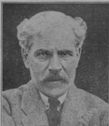
Macdonald, angleški min. predsednik.