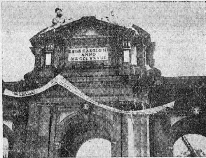
Madridski gasilci ob slavni Alcali v akciji