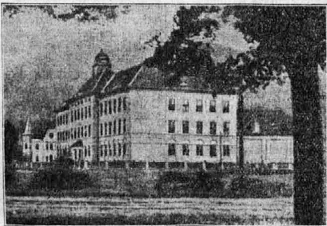
Gimnazija v Celju

šmarnski srez do Sotle in proti jugu do Save in ob Savi noter preko Brežic do hrvatske meje. Silno je to ozemlje in za to se ni čuditi, da je iz te pokrajine toliko mladine v celjskih šolah.