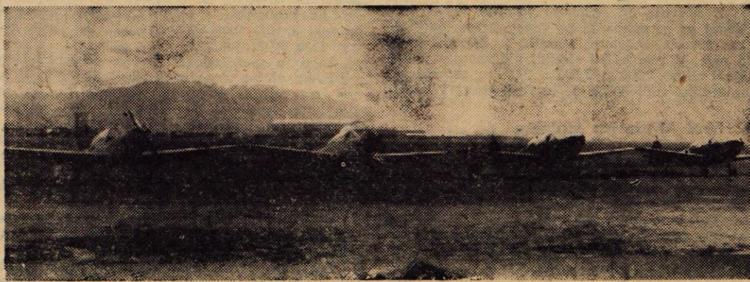
Četvorka rezervne eskadrile pred vzletom na ljubljanskem letališču

Takšno je bilo popoldne med letalci rezervne eskadrile med veselimi in prijetnimi mladenci zrelih let. So različnih poklicev, skupno pa jim je eno — letalstvo in ljubezen do njega. Vsak dan se vračajo na letališče, čeprav po delu v tovarni, uradu... Čeprav niso spočiti, radi letijo, kajti v letenju uživajo, ob tem pa se izpopolnjujejo. Družijo prijeto s koristnim.