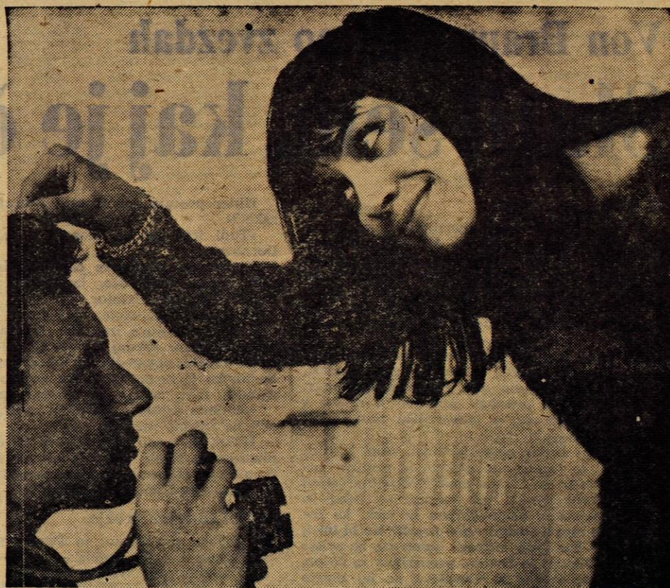
Pred mladim Cavalierem se je z alžirsko temo spoprijel že Jean-Luc Godard s filmom »Mali vojak«, posnetim leta 1960 in nato tri leta prepovedanim, v katerem sta zaigrala Michel Subor (mladega terorista O. A. S. in Anna Karina pripadnico F. L. N.

imeli resnično umetniško vrednost — pri tem pa tudi take, v katerih sam ne bom igral. Glavno vlogo bom prevzel posebej v filmih mladih in neznanih režiserjev, da bi jim tako komercialno utrl pot. Na ta način mislim pomagati novim nadarjenim ustvarjalcem pri njihovem uveljavljanju. Če sem čisto